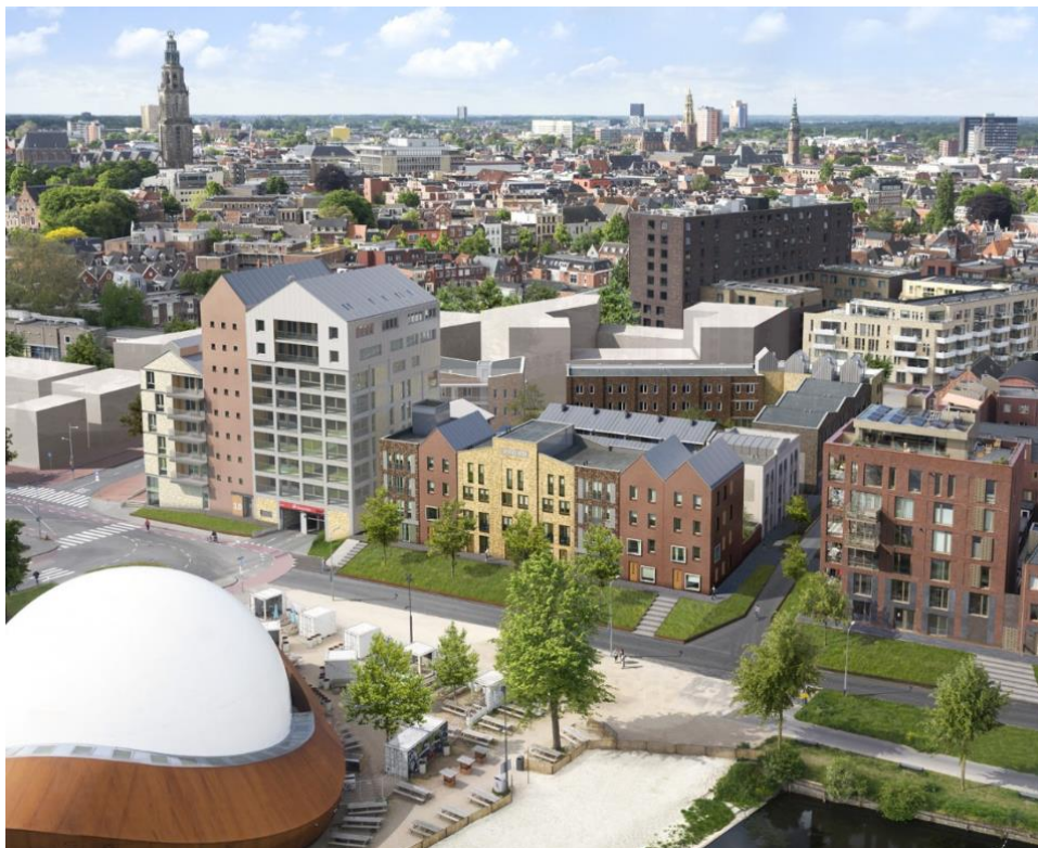
Impressie eindsituatie vanaf medio 2022

In fase 1, die deze week is begonnen en loopt tot eind 2020 / begin 2021, zal er worden gebouwd aan 37 grondgebonden woningen en het appartementencomplex met 40 appartementen voor Stichting 't Ebbingehofje. Vanaf eind dit jaar zullen de resterende 58 appartementen worden gebouwd (fase 2). Het appartementengebouw boven de ingang van de parkeergarage Boterdiep wordt 9 verdiepingen hoog en heeft een bouwtijd van circa anderhalf jaar.