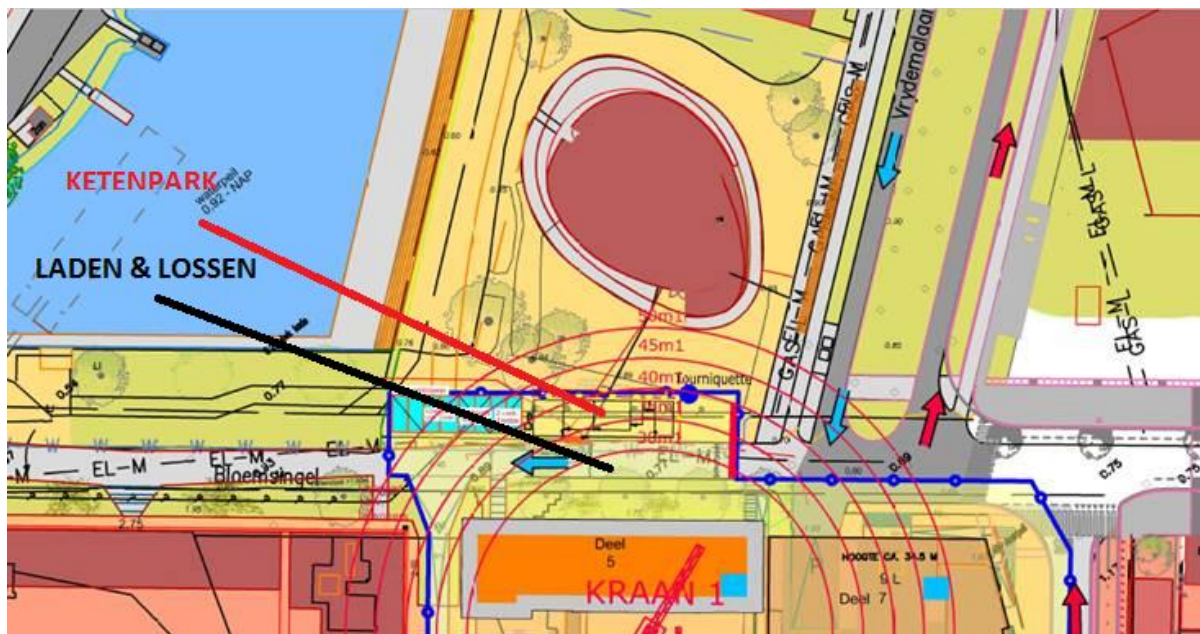
Deel bouwplaats voor DOT

Aangezien dit de laatste bebouwing op de Boterdiepgarage is, is het niet meer mogelijk om het ketenpark en het laden en lossen op het dek van de garage zelf te organiseren, zoals in de vorige fases gebeurde.