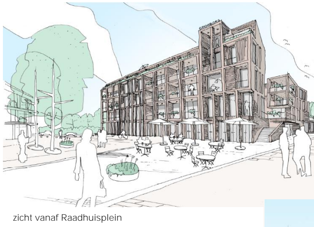
zicht vanaf Raadhuisplein

De kaderstelling werd vertaald naar een Programma van Eisen en deze vormde de basis voor een Europese aanbestedingsprocedure die eind 2017 is doorlopen. In december 2017 leidde dit tot een voorselectie van drie partijen en uit de eindbeoordeling van deze laatste drie kwam het plan van Explorius Vastgoedontwikkeling (zie hieronder) als beste naar voren.