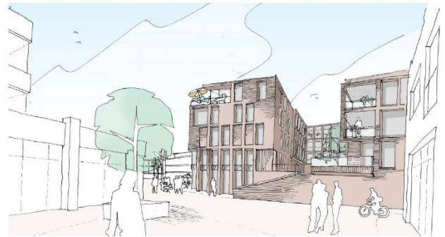
zicht vanaf Brinkhorst (winkelstraat Zuidzijde)