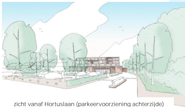
zicht vanaf Hortuslaan (parkeervoorziening achterzijde)