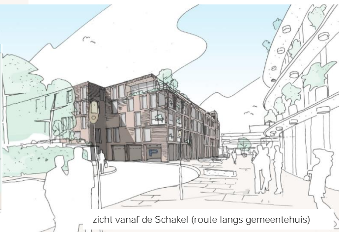
zicht vanaf de Schakel (route langs gemeentehuis)

Onderdeel van het plan van Explorius is de verplaatsing van de Aldi die nu net buiten het feitelijke centrum is gelegen. Daarmee wordt het centrum compacter gemaakt, concentreren we het winkelaanbod zoals dat in de centrumvisie wordt beoogd en brengen we een potentiële trekker in het centrum. De supermarkt wordt ontsloten vanaf de parkeerplaats aan de 'achterzijde' (zijde Hortuslaan) . Aan de Raadhuisplein-zijde wordt een aantrekkelijke en gevarieerde pleingevel gerealiseerd die op de begane grond wordt gevuld met horeca en dagwinkels; een invulling die de looplijn langs de oostzijde van het plein versterkt. Ook de zuidzijde wordt deels gevuld met dagwinkels, waarmee ook vanuit de Brinkhorst een aantrekkelijke geleiding naar het plein ontstaat. Daarboven komen een 32-tal appartementen en onder het bouwblok wordt een parkeergarage ten behoeve van de appartementen gerealiseerd. De winkelbezoekers kunnen achter het blok parkeren, waarbij inmiddels duidelijk is dat deze parkeervoorziening ook beperkt gebruikt kan blijven worden voor centrumbezoekers.