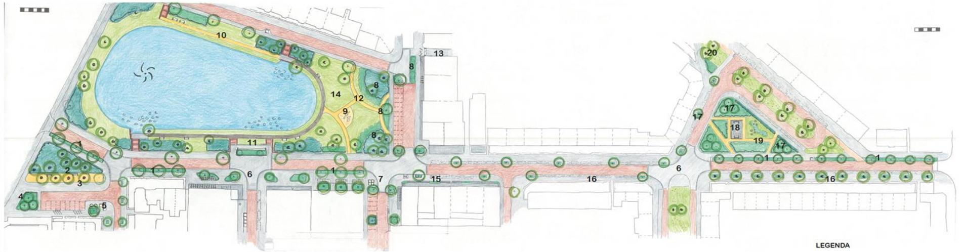
1 Nieuwe boomstructuur in kleurrijke beplanting