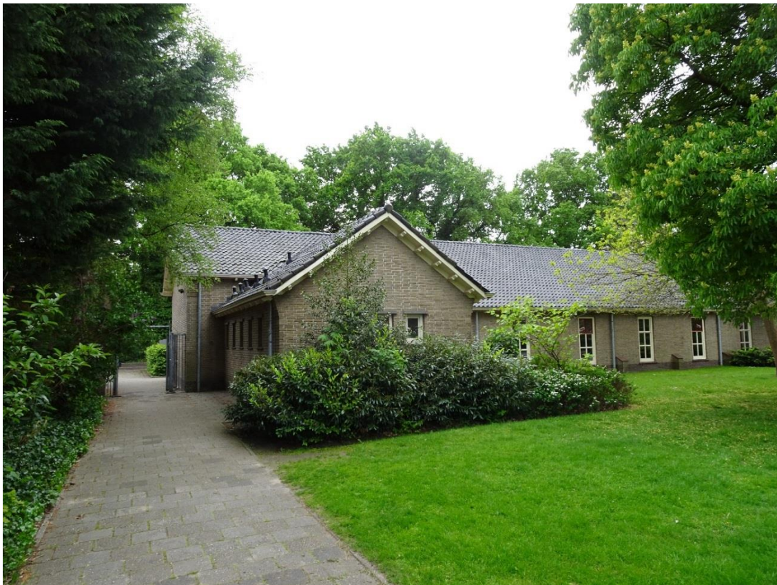
Voorzijde met toiletvleugel