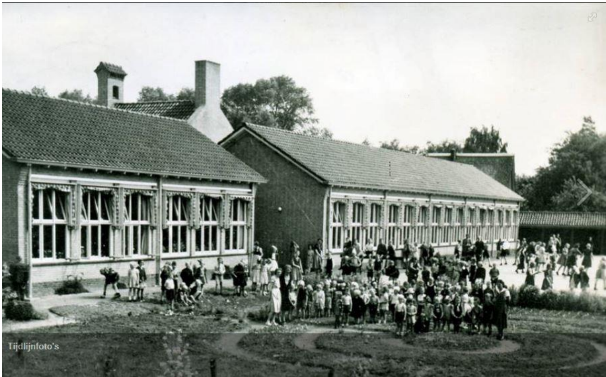
Achterzijde van de school, Jaren '50