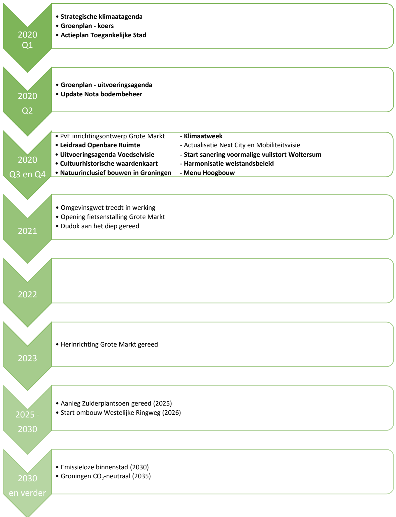
Figuur 3. Tijdlijn programma Leefkwaliteit