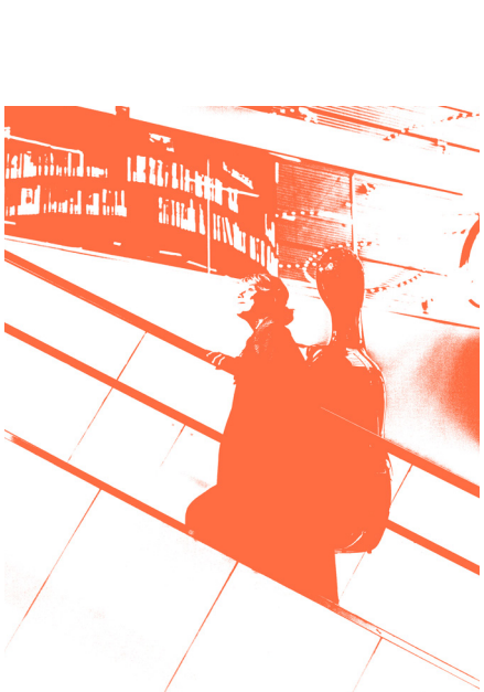
Kamerorkest van het Noorden 40