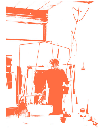
Jildau Nijboer 88

Een bruisende stad koestert zijn talenten 96