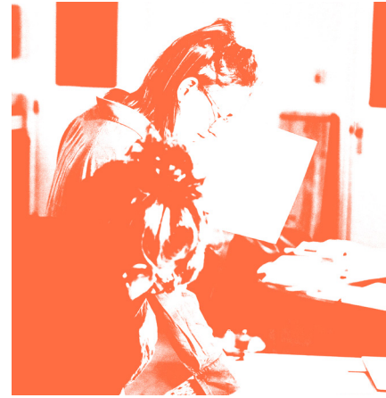
Profound Play 58