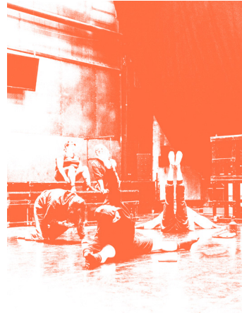
Teddy's Last Ride 30