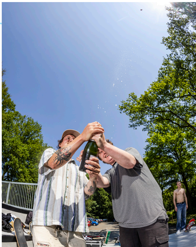
Afbeelding 15: opening stedelijk skatepark Stadspark door initiatiefnemers

Tot slot is ook cofinanciering vanuit het Urban Sports Netwerk een mogelijkheid om de budgetten te vergroten. Fase 2 van het stedelijk skatepark is hier een goed voorbeeld van. Rollend Groningen, een collectief van skaters, BMX'ers, inliners en steppers, is samen met een fondsenwerver bezig om de helft van het benodigde bedrag voor de tweede helft van het skatepark bij elkaar te krijgen. Deze constructie is voor de toekomst wellicht kansrijk om meer aanspraak te maken op fondsen en subsidies.