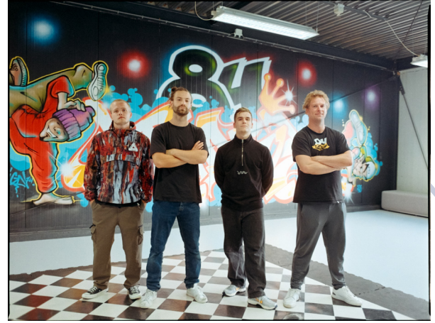
Afbeelding 7: breakdancers van 84studio