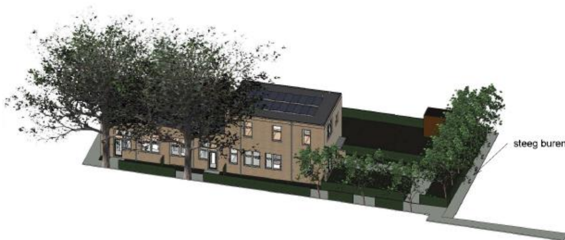
verbeelding nieuwe situatie (bron:Melein Architectuur)

De drie woningen zullen worden voorzien van een tuin met berging in het achtererf gebied. Het plangebied zal toegankelijk zijn via de bestaande zijingang langs de kerk die direct ten zuiden ligt van het plangebied. Het terrein is niet toegankelijk voor auto's.