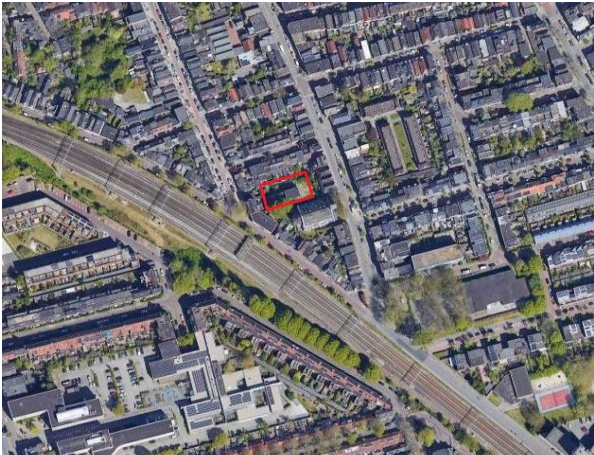
Ligging Oosterweg 83 in de stad

Ten zuidwesten van het plangebied ligt het spoor.