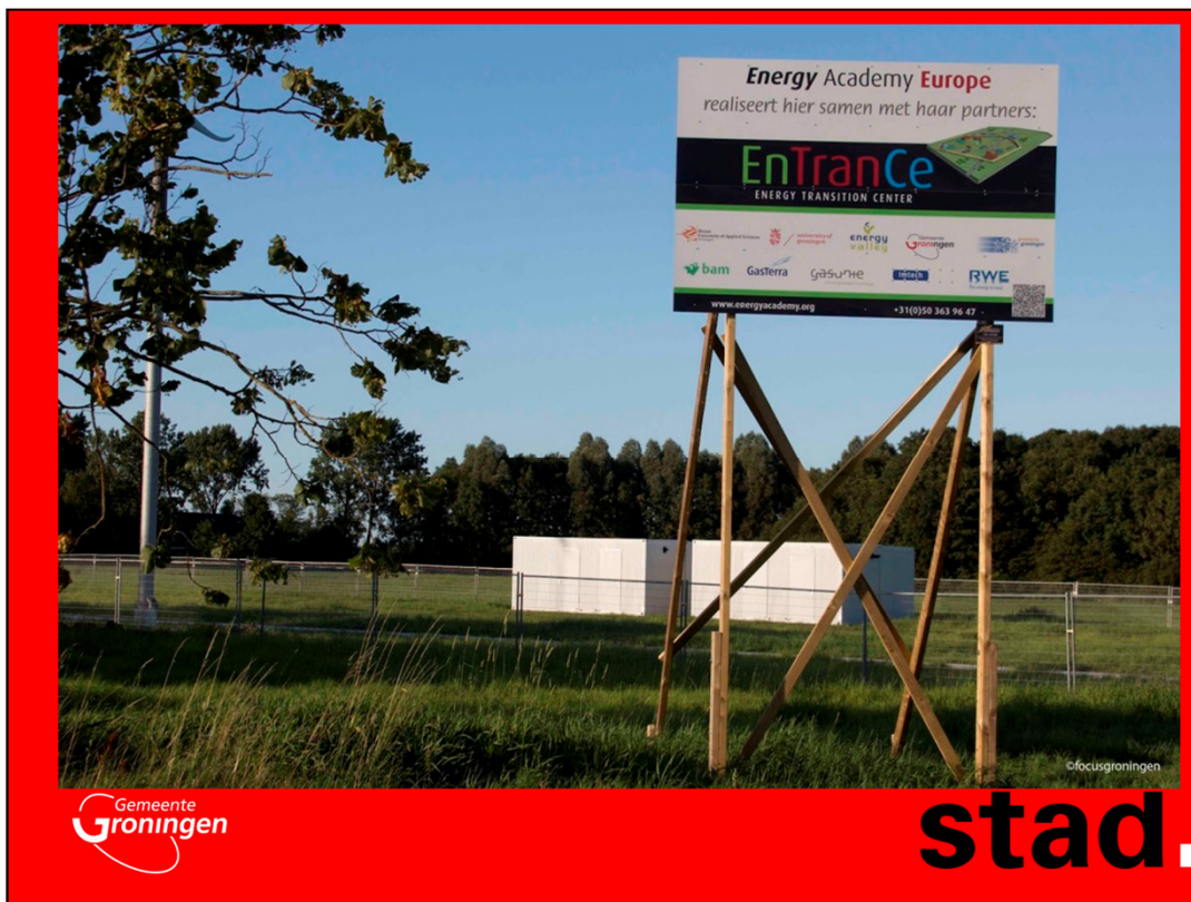
Ontwikkeling van het Energy Transition Centre: een proeftuin voor toegepast onderzoek naar de energievoorzieningen van de toekomst.