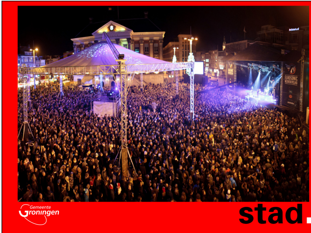
Eurosonic: één van de grootste pop-podia van Europa.