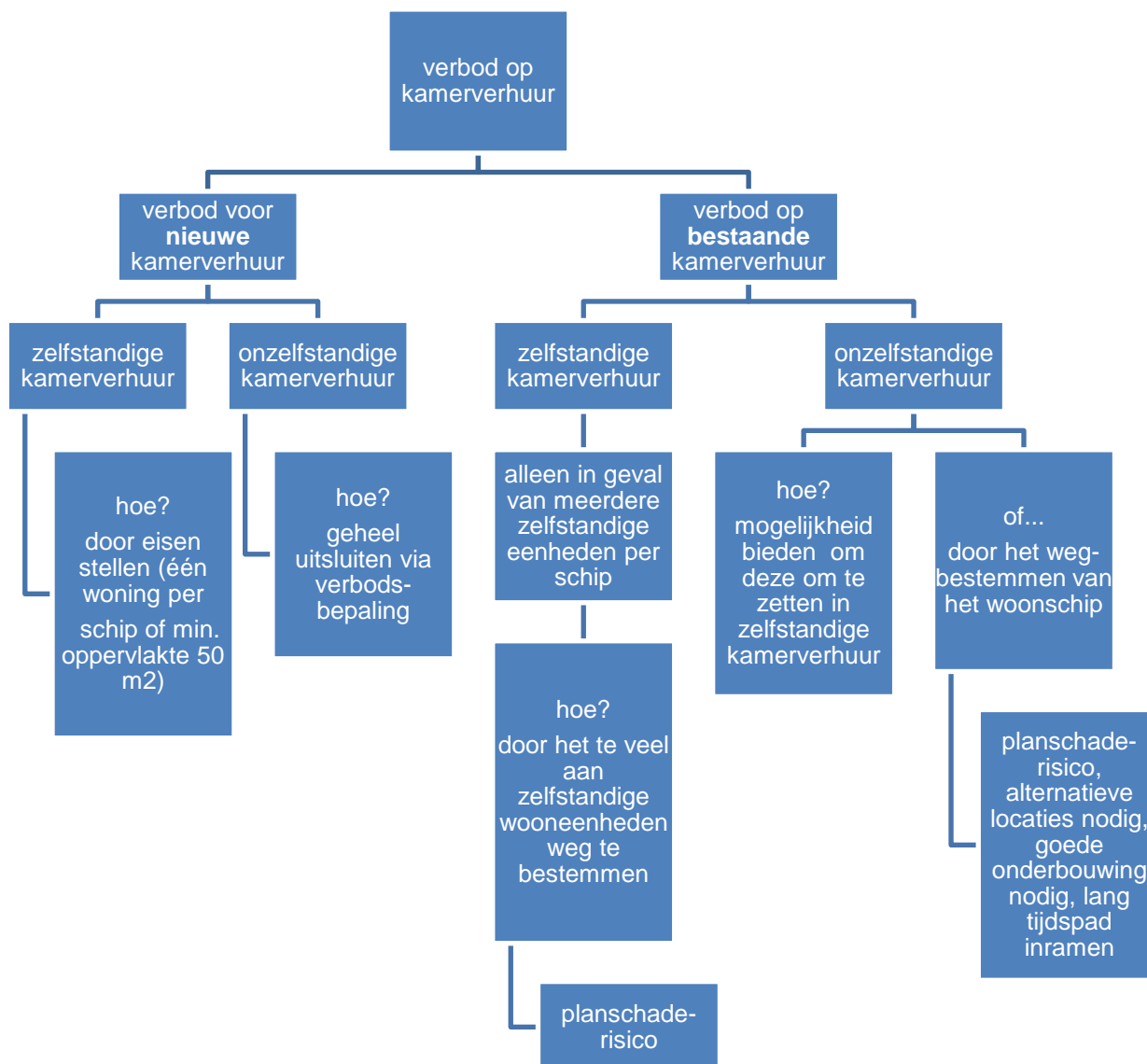
schema verbod kamerverhuur 7