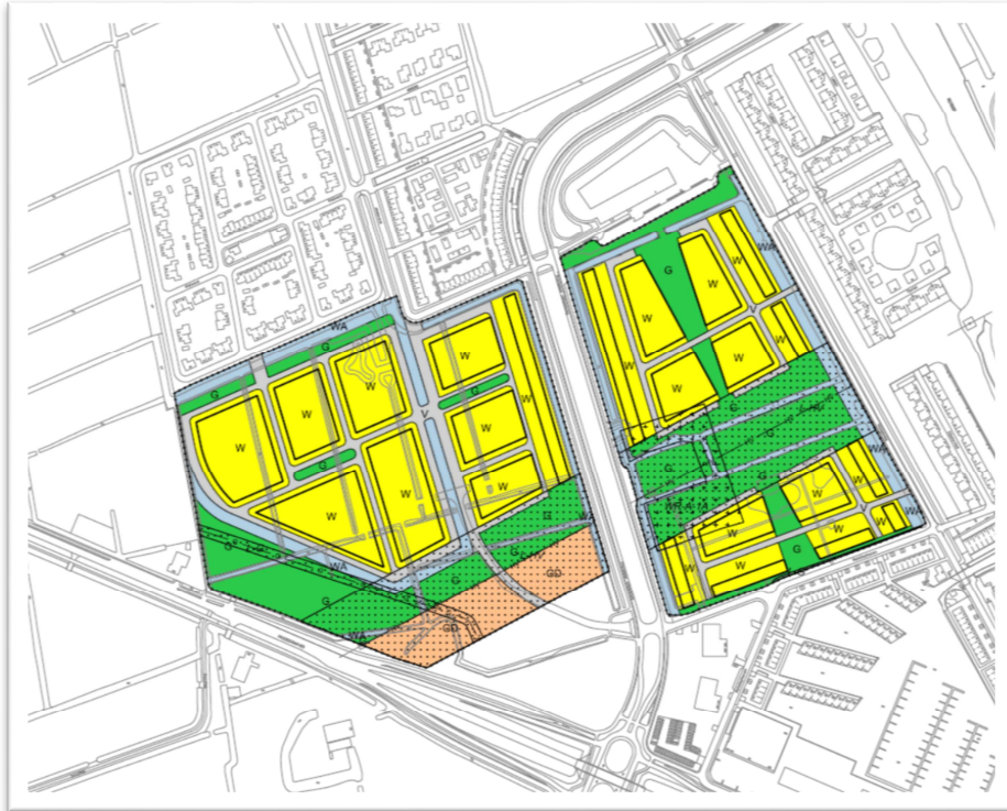
Figuur 2: Begrenzing van het plangebied en de bouwvlakken