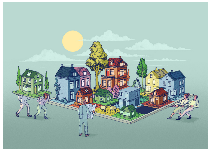
ILLUSTRATIETALENT IN HET MAGAZINE