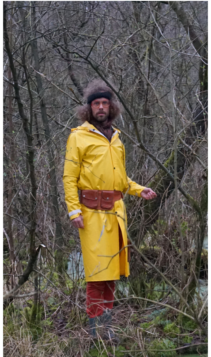
(VOOR)EXPEDITIE TASMAN OP GRASNAPOLSKY

de ontwikkeling van en rond De Linkse Mannen Lossen het op. We gaan uit van minimaal twee afleveringen in 2021, al dan niet aangevuld met afleveringen die tot stand komen als 'Linkse Mannen COVID-19-achterwacht'.