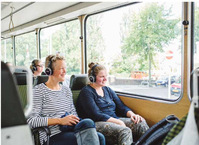
AUDIOTOUR TIJDENS NOORDERZON

Wat betreft de opschaling beschouwen we 2021 als een pilotjaar. We beginnen overzichtelijk met als doel het symposium de komende jaren verder uit te bouwen tot een begrip binnen en buiten Groningen. Thematisch focust het