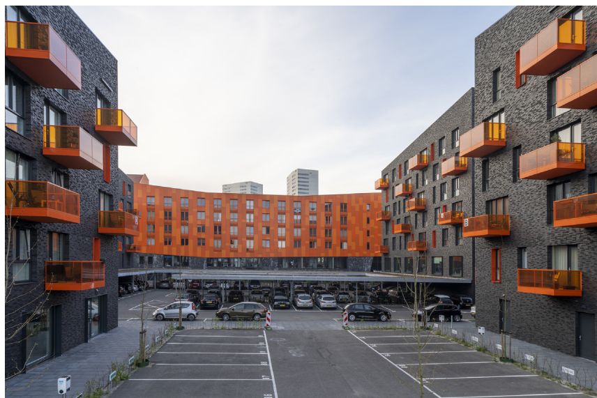
PARKEERNORM VERSUS LEEFBARE WOONOMGEVING