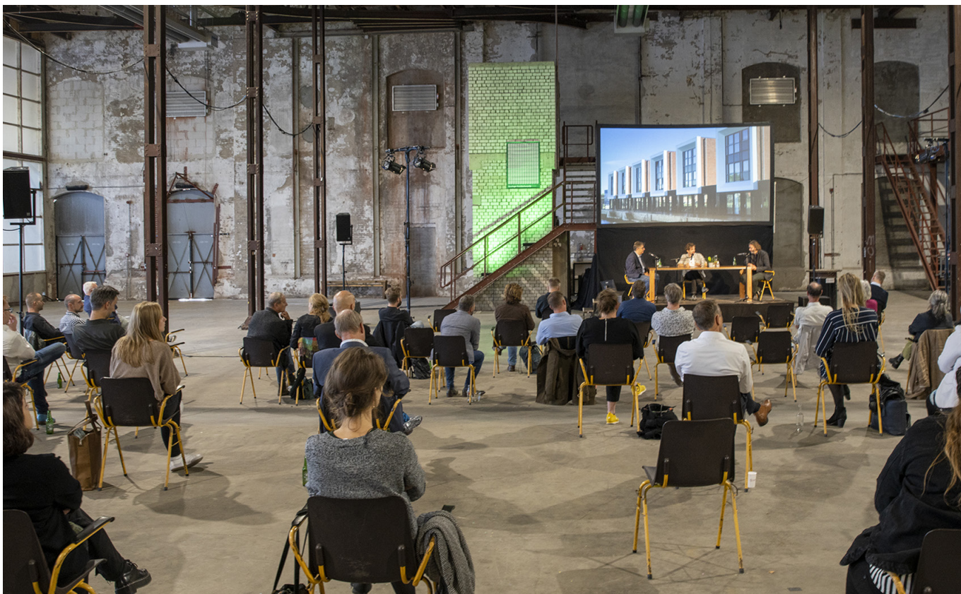
KICK-OFF GRONINGER ARCHITECTUURMAAND 2020

proefkeuken voor initiatieven die gezamenlijk uitgedacht en op smaak gebracht worden: cross-sectoraal. Zo moet GRASMEST de plek worden waar de opvolgers van projecten als het Groninger Woongenootschap en Van Woonwijk naar Leefwijk het levenslicht zien. Bovendien is het de plek voor het gesprek met bestuur, politiek en opdrachtgevers. Doel is om de bouwcultuur in Groningen te stimuleren, plannen beter te maken en te profiteren van elkaars kennis en kunde.