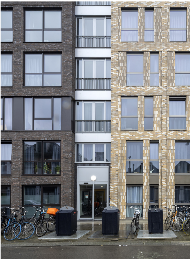
STAD = KASSA: STUDENTENSTUDIO'S OOSTERSINGEL

Vaak wordt wat laatskend gedaan over de architectuur uit de periode 1965 – 1990. En ja, misschien waren het niet de hoogtijdagen van de Nederlandse bouwkunst. Laat onverlet dat er zeker ook parels tussen de zogenoemde Post 65 architectuur zitten. Met dit essay vragen we aandacht voor de Groninger Post 65. Welke parels verdienen aandacht en bescherming? Het essay doet bovendien een oproep tot een inhaalslag wat betreft het (vroeg) naoorlogs erfgoed: 'pre-65'. Daar is het nodige al beschermd, maar nog (lang) niet alles dat van waarde is. Zo gaat de markante Noordwand van de Grote Markt – vol schoonheden uit de vroege jaren vijftig – nog altijd nagenoeg onbeschermd door het leven. En vooral buiten de stad staat veel erfgoed dat nog geen enkele bescherming geniet. Met dit essay reageren we onder meer op doelstellingen van het recente Bestemmingsplan voor gebouwd erfgoed waarmee de gemeente Groningen al een goede stap zet richting een steviger bescherming. Ook haken we aan op het groeiende besef dat erfgoedwaarden ook in het buitengebied beter beschermd moeten worden. We stellen de ambities scherper, maken het concreter en brengen de boodschap ook over aan het Ommeland.