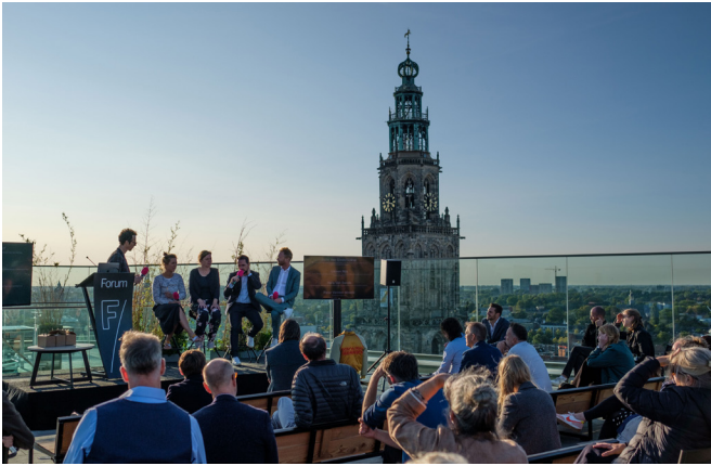
UITREIKING GRONINGER ARCHITECTUURPRIJS

Boumasymposium op wellicht hét bindende thema van dit jaarprogramma: bouwcultuur. Met de enorme ruimtelijke opgaven die op ons afkomen ligt er een al even grote kans om een nieuwe betekenisvolle laag toe te voegen aan de gebouwde omgeving. Al die opgaven – van klimaat tot woningbouw – verdienen een liefdevolle benadering. Ze verdienen het om niet sectoraal maar integraal bekeken te worden. En juist dát is het werk van ontwerpers. Het symposium wordt een oproep om een forse impuls te geven aan de (Groninger) bouwcultuur. Meer focus op waarde, verbeelding, goede plannen en (ver) voorbij de sectorale aanpak.