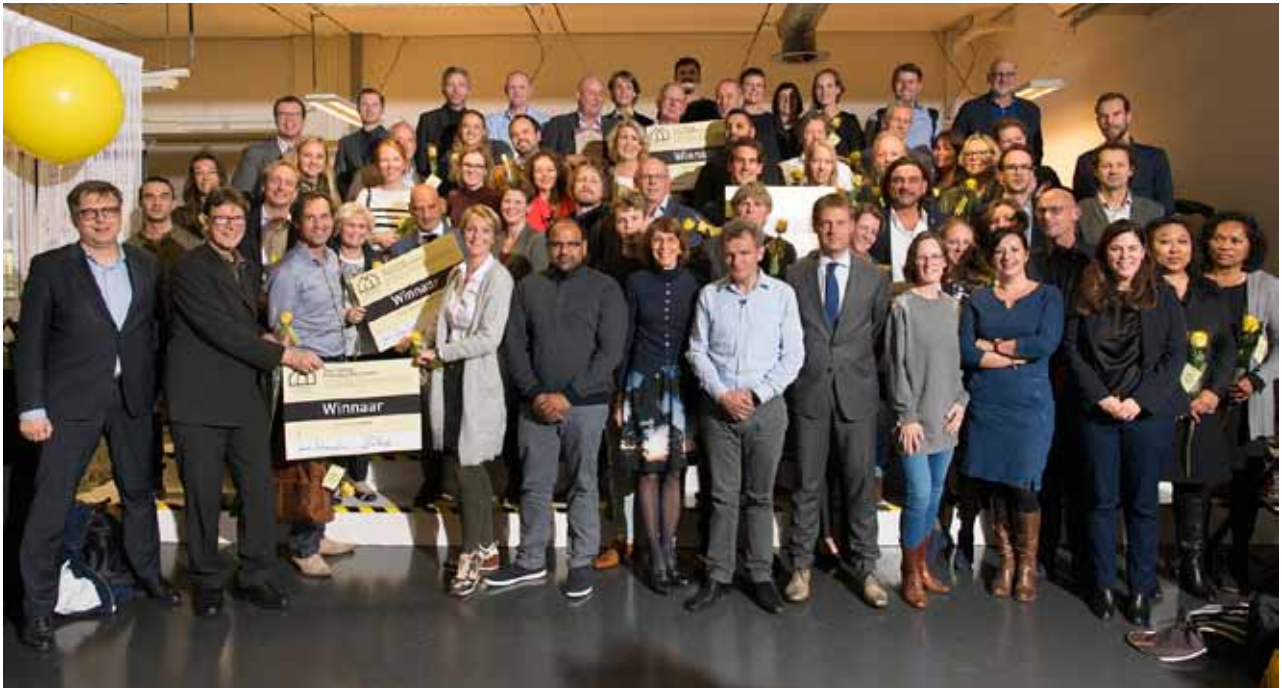
Prijswinnaars Who Cares