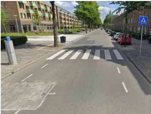
Wielewaalplein richting Zaagmuldersweg