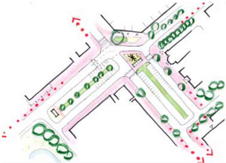
Positie Wielewaalplein Michi-Noeki Variant 1