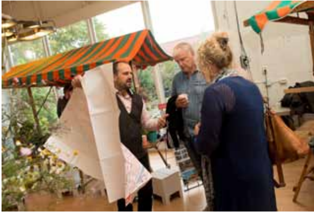
Infomarkt met bewoners, 2017