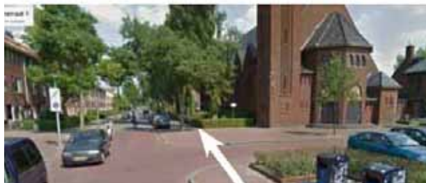
Fragment route-analyse Vinkenstraat