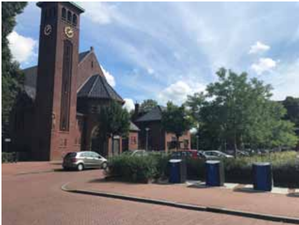
Wielewaalplein richting Sint Franciscuskerk