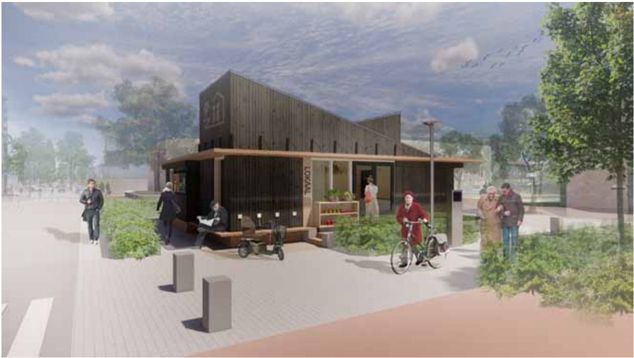
Impressie Michi-Noeki vanaf Zaagmulderwseg, door dNArchitectuur