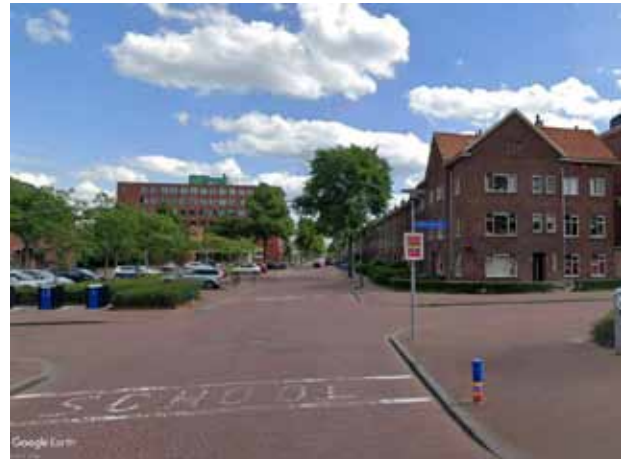
Wielewaalplein richting Zaagmulderweg