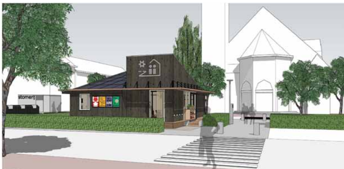
Impressie Michi-Noeki richting Sint Franciscuskerk