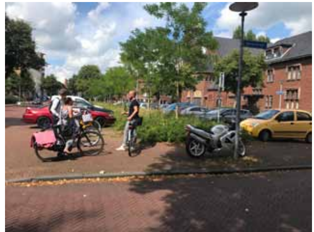
Wielewaalplein vanaf Oosterparkheem