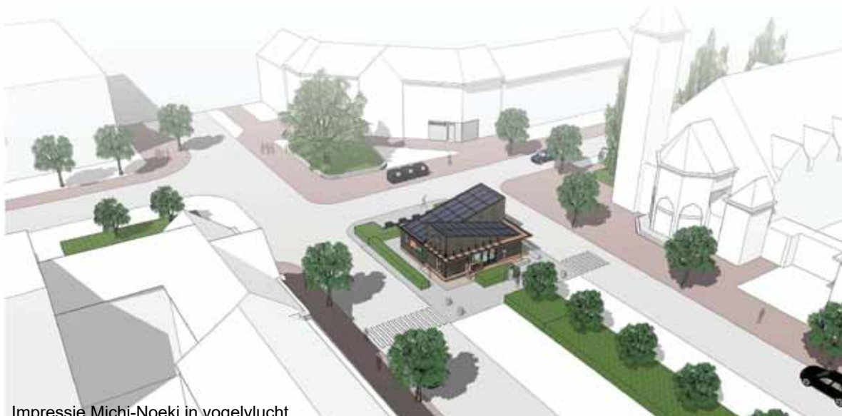
Impressie Michi-Noeki in vogelvlucht