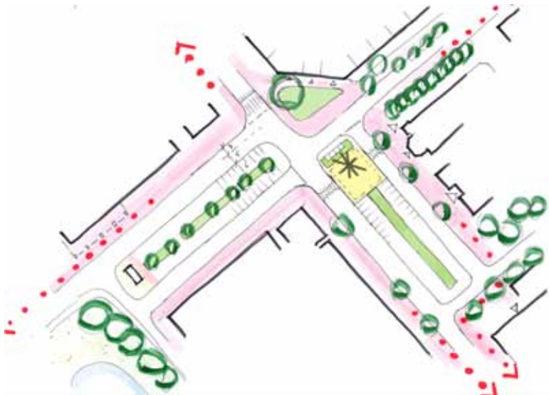
Positie Wielewaalplein Michi-Noeki Variant 2

Voor de positie van de Michi-Noeki halteplek zijn twee voorstellen gedaan. Bij Variant 1 is het paviljoen meer naar voren geschoven en beter in het zicht. Variant 2 heeft echter de voorkeur gekregen, met name vanuit verkeerskundig oogpunt. Dit houdt verband met de geplande busbaan die via de Vinkenstraat loopt en richting af zal zwaaien.