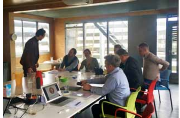
Werkbezoek Rijksbouwmeester in Groningen. 2019