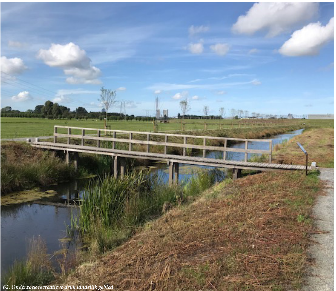
62. Onderzoek recreatieve druk landelijk gebied

Vooral in het zuidelijk deel van de gemeente horen we geluiden dat de natuur te leiden heeft onder recreatieve druk. Dat wordt genoemd voor de Onlanden, het Zuidlaardermeer-gebied en delen van de Hondsrug. We onderzoeken dit samen met onze partners, gemeente Tynaarlo, Overlegorgaan Nationaal Park Drentsche Aa, bewoners en gebruikers en nemen indien nodig maatregelen.