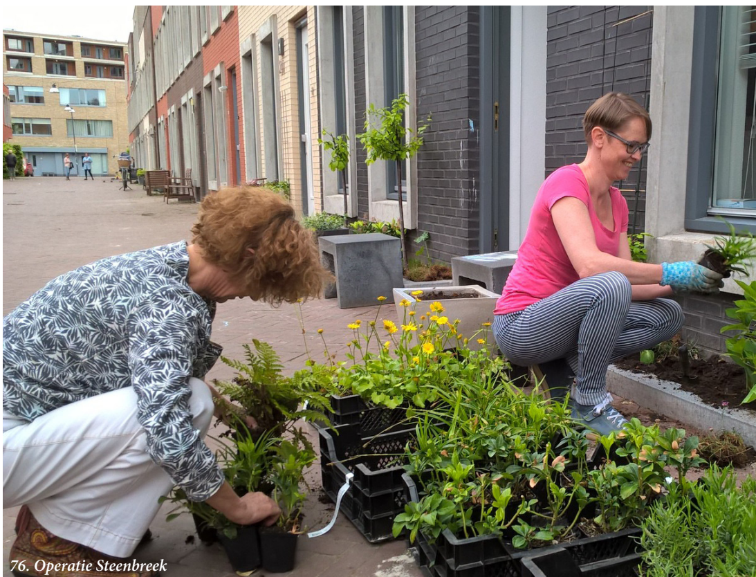
76. Operatie Steenbreek

Een ongunstige, landelijke trend van de afgelopen decennia is het verharden van tuinen. Verharden of verstenen leidt tot minder infiltratie in de bodem en meer afvoer naar de riolering. Precies het omgekeerde dus van wat we met groene daken beogen. Om deze trend om te buigen, werken we samen met de werkgroep Operatie Steenbreek en de Natuur- en Milieufederatie Groningen. Het blijkt dat kleine, lokale maatregelen heel effectief zijn. Zo kunnen inwoners bijvoorbeeld een geveltuin aanleggen, een boomtuin adopteren of de directe omgeving van de straat of speeltuin vergroenen onder de noemer “Tegel eruit, plant erin”. Ze verhogen bovendien de bewustwording dat klimaatadaptatie en het versterken van de biodiversiteit noodzakelijk zijn. Operatie Steenbreek wordt vanuit het Groninger Water en Rioleringsplan gefinancierd.