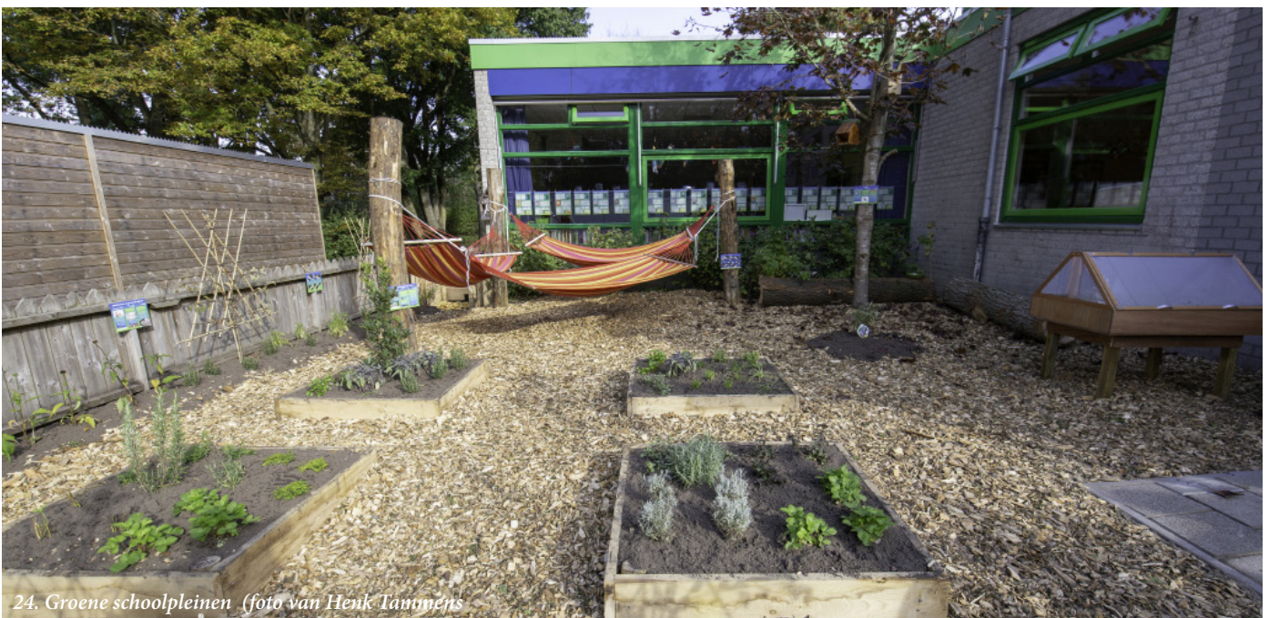
24. Groene schoolpleinen

De pleinen in de binnenstad, die tevens dienen als evenemententerreinen zijn aangewezen als urgente locaties. Dit heeft met name te maken met de directe gezondheidseffecten die kunnen optreden bij grotere samenkomsten en hitte. Het gaat om de Grote Markt, de Vismarkt, de Ossenmarkt en het Damsterplein. Met uitzondering van de Vismarkt zijn de pleinen al in andere programma's benoemd en is de vergroeningsopgave benoemd. Voor het Damsterplein en Ossenmarkt geldt dat ze zijn benoemd in het Compensatiepakket Duurzaam en Groen Eelde. De herinrichting van de Grote Markt maakt onderdeel uit van de 050 Binnenstad – Ruimte voor jou. Voor de Vismarkt zullen we een aparte projectopdracht formuleren. Voor alle pleinen geldt een integrale benadering waarin sowieso groene klimaat adaptieve, bereikbaarheid en programma aan bod komen. Alle relevante projecten zijn terug te vinden in paragraaf 3.3.5 Binnenstad.