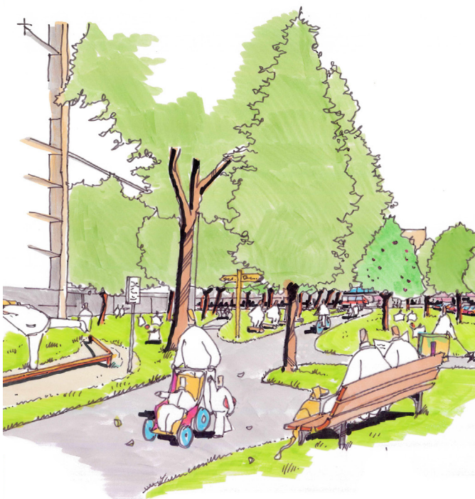
27. Caspomor, Inspiratiebeeld Verbinden

Daarmee wordt ca. 2.500 m 2 verharding vervangen door groen. Met deze vergroening ontstaat een aantrekkelijke verbinding tussen winkelcentrum en wijkpark Selwerd. De basis onderdelen voor het CASPOMOR Park zijn het vervangen van van 2.500 m 2 verharding door groenen vergroenen van twee doodlopende asfaltwegen en het integreren met en opengooien van het bestaande groen tot een openbaar park. De exacte invulling van CASPOMOR park vindt plaats via co-creatie met bewoners op de thema's "verbinden", "vergroenen" en "verblijven". Het park wordt mede mogelijk gemaakt met middelen uit de Regiodeal Groningen-Noord.