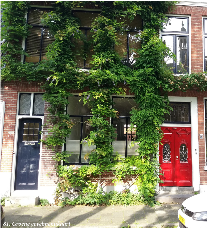
81. Groene gevelmenukaart

Na de pilot bepalen we of hier een regeling voor wordt opgesteld.