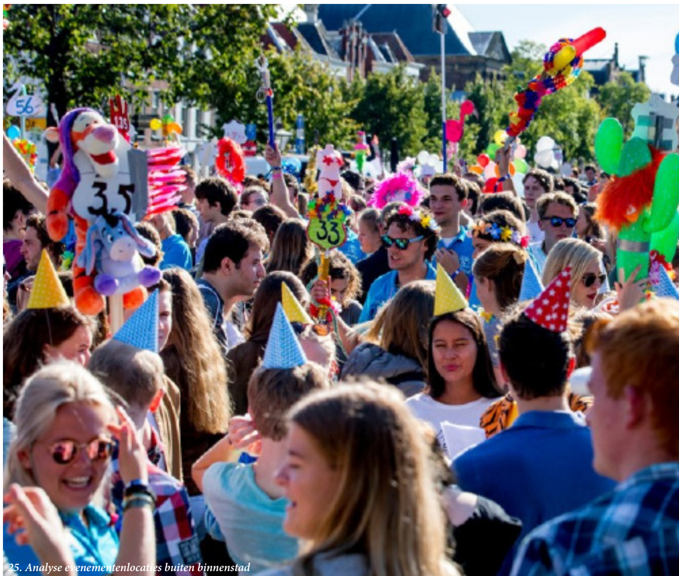
25. Analyse evenementenlocaties buiten binnenstad