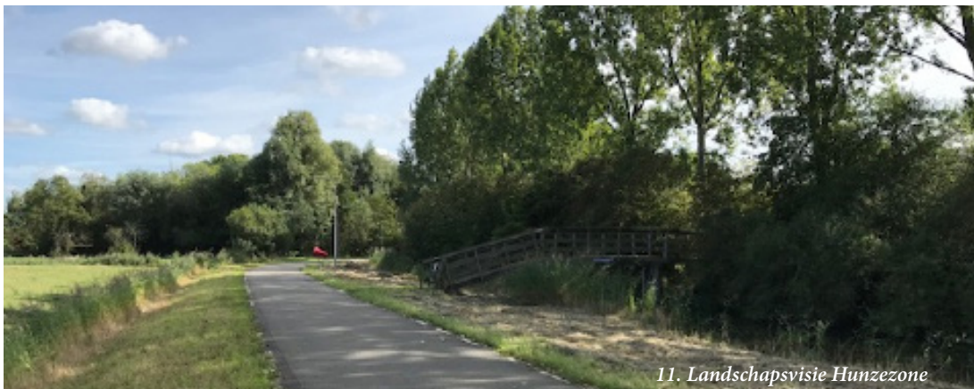
11. Landschapsvisie Hunzezone

De Hunze is een belangrijke landschappelijke drager in de stad en verbindt de stad met het landelijk gebied. Samen met stakeholders maken we een landschapsvisie voor de Hunze waarin landschapsherstel en biodiversiteit belangrijke onderdelen zijn. Daarnaast kan de Hunze een belangrijke bijdrage leveren aan het bevorderen van bewegen en ontmoeten, het koelen van de stad en een (tijdelijke) buffer zijn voor overtollig water.