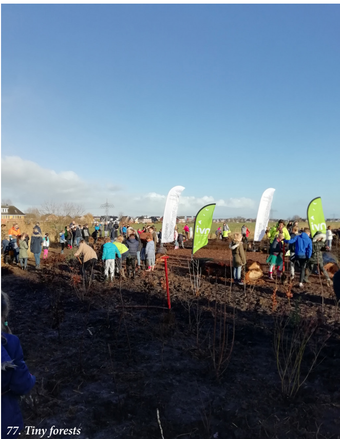
77. Tiny forests

Een groene woonomgeving draagt bij de leefbaarheid, het vergroten van de biodiversiteit en het tegengaan van hittestress en wateroverlast. Het is daarom belangrijk om niet alleen de openbare ruimte te vergroenen, maar ook de tuinen van bewoners en terreinen van bedrijven. Met deze nieuwe groene stimuleringsregeling stellen we elk jaar 365 bomen beschikbaar om privéterreinen te vergroenen.