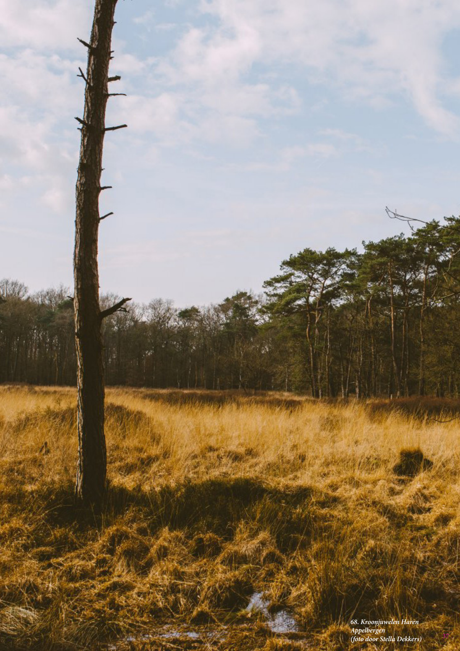
68. Kroonjuwelen Haren Appelbergen