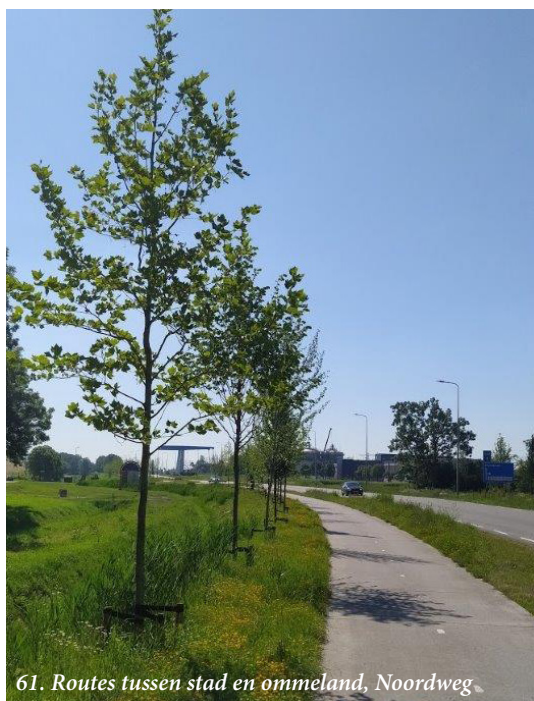
61. Routes tussen stad en ommeland, Noordweg

In het Groenplan zijn routes benoemd die een belangrijke verbinding maken tussen stad en ommeland. We ontwikkelen meer groene aantrekkelijke fietsen wandelverbindingen langs cultuurhistorisch waardevolle lijnen om dorp, stad en landelijk gebied met elkaar te verbinden. Langs die verbindingen planten we – waar passend- bomen aan en kiezen voor kruidenrijke vegetaties passend bij het landschapstype. De routes naar het landelijk gebied worden zo niet alleen aantrekkelijker, maar creëren ook een koelnetwerk dat frisse lucht de stad in brengt. Voor elke route onderzoeken we hoe de aantrekkelijkheid in gebruik, landschappelijke inpassing en biodiversiteit is te vergroten. Voor elke route maken we ontwerp, beschrijven we de maatregelen die nodig zijn en maken een kostenraming. Stadsweg - Groningen en Ten Boer heeft prioriteit vanuit ons openingsbod 2020.