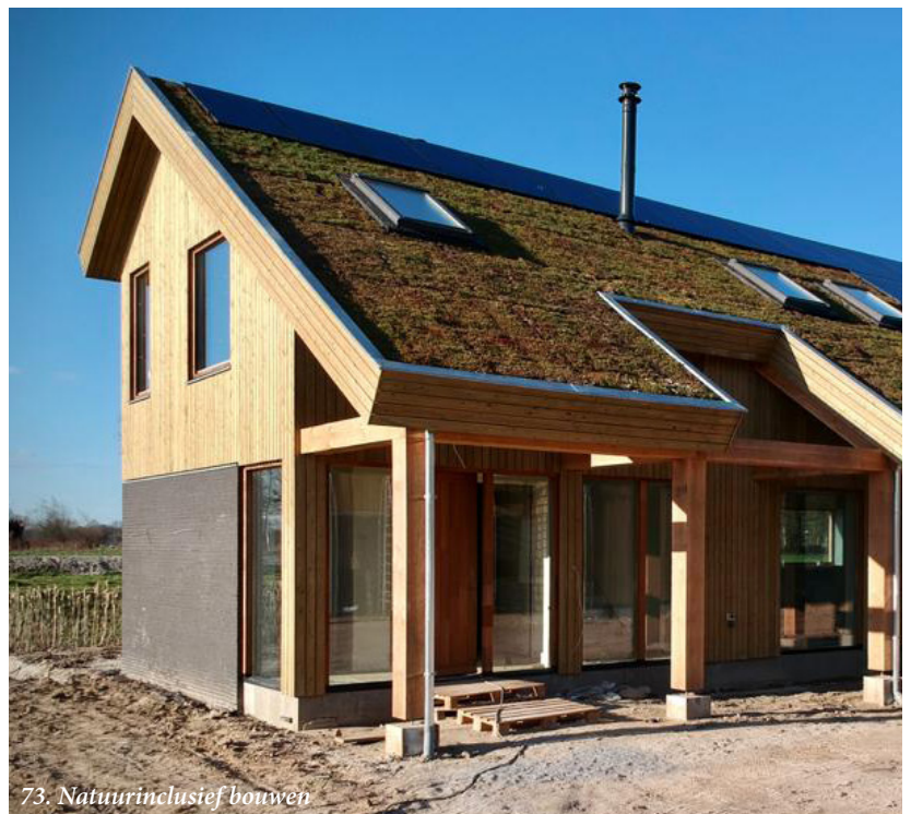
73. Natuurinclusief bouwen

We werken een voorstel uit voor hoe we natuurinclusief bouwen kunnen bevorderen. Natuurinclusief bouwen levert een bijdrage aan de instandhouding van beschermde (en overige) soorten en levert tegelijkertijd een bijdrage aan een prettige leefomgeving, aan de mogelijkheden voor natuurbeleving in de stad en daarmee samenhangend een bijdrage aan het welzijn en de gezondheid van mensen. Het gaat bij natuurinclusief bouwen om het toepassen van maatregelen in, op of nabij gebouwen die een bijdrage leveren aan de biodiversiteit. In het voorstel is ruimte voor maatwerk; toe te passen maatregelen in de middeleeuwse binnenstad zijn anders dan in een naoorlogse wijk en in het landelijk gebied zijn verschillend. In het voorstel is ook aandacht voor de borging.