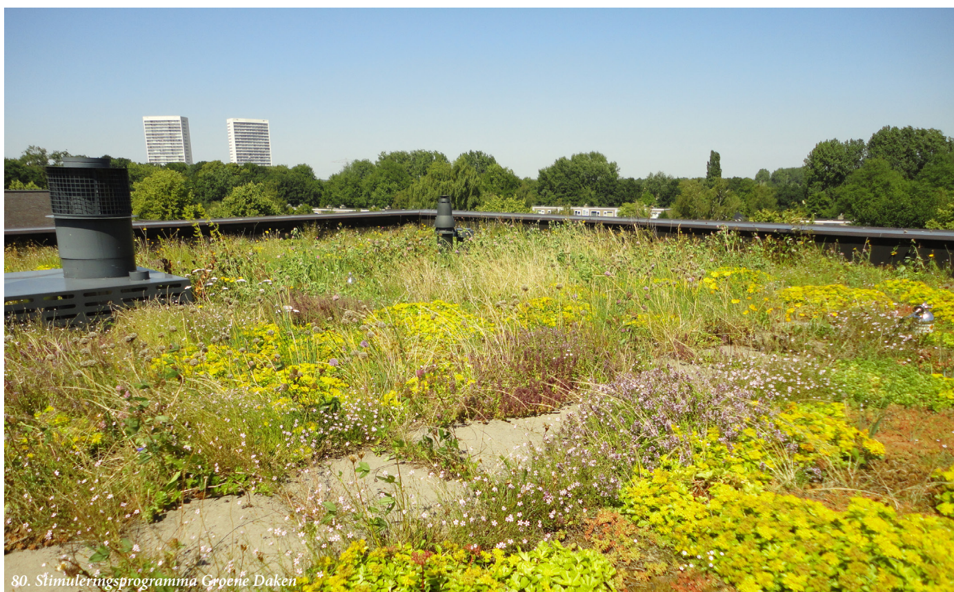
80. Stimuleringsprogramma Groene Daken