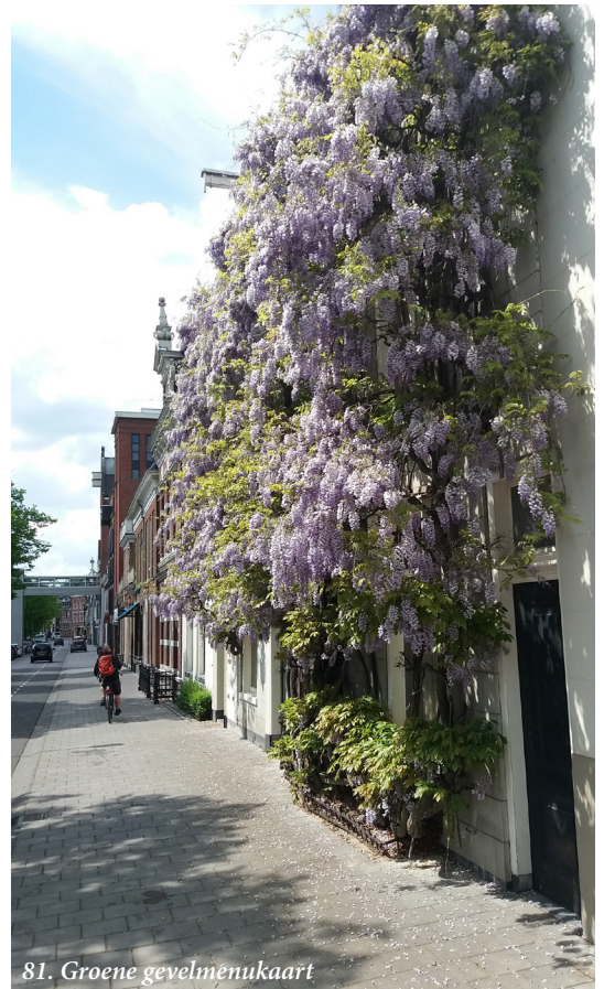
81. Groene gevelmenukaart