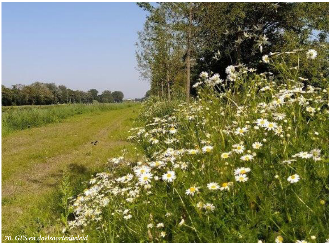
70. GES en doelsoortenbeleid

We breiden de Stedelijke Ecologische Structuur naar een Gemeentelijke Ecologische Structuur (GES). Daarmee nemen we het grondgebied van Meerstad en de oude gemeenten Haren en Ten Boer op kaart op en wordt de ecologische structuur gemeente dekkend. We ontwikkelen parallel hieraan ook een doelsoortenbeleid voor deze gebieden zodat we op basis daarvan kunnen aangeven welke fysieke maatregelen genomen moeten worden voor een robuuste en obstakelvrije structuur. We willen de gemeentelijke ecologische structuur ook beter planologisch gaan beschermen via de Omgevingswet. We ontwikkelen daarvoor een systematiek.