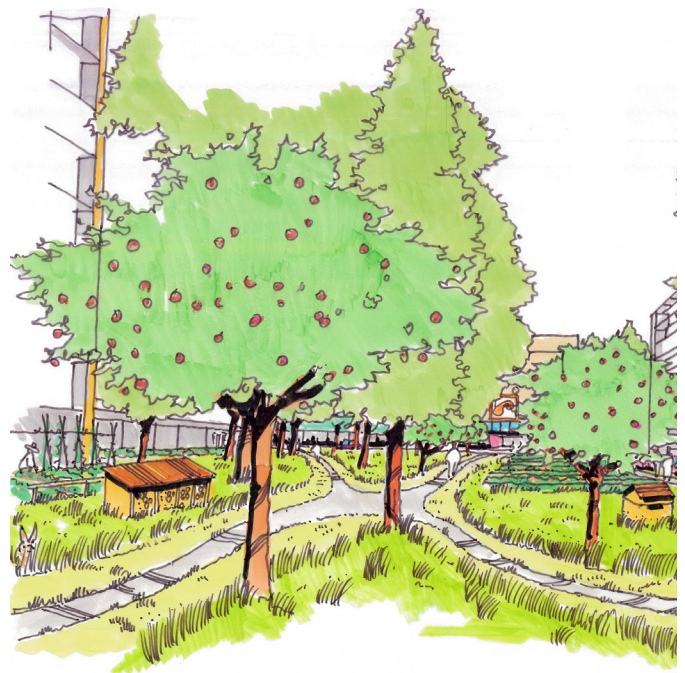
27. Caspomor, Inspiratiebeeld Vergroenen