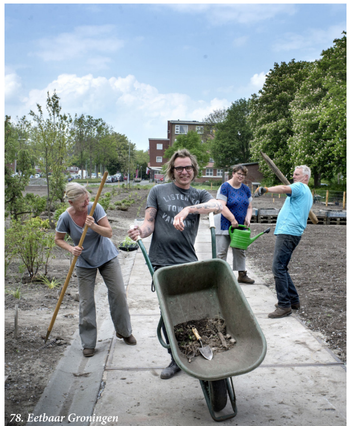
78. Eetbaar Groningen