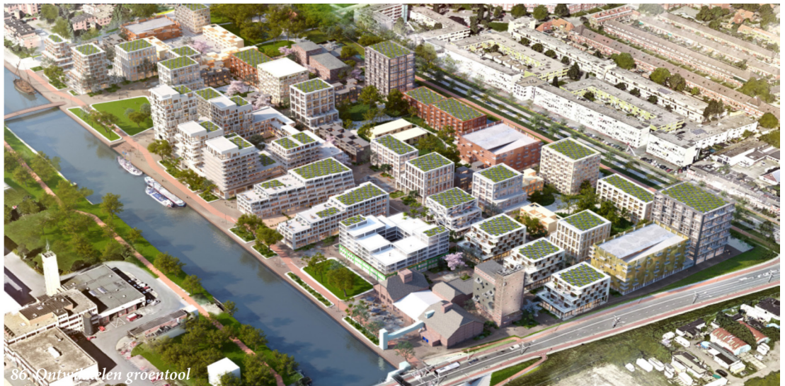
86. Ontwikkelen groentool

Het Rijk ondersteunt onderzoek, innovatie ontwikkeling van de zogenaamde Topsectoren: sectoren zijn gebieden waar het Nederlandse bedrijfsleven en onderzoekscentra wereldwijd in uitblinken. Het bedrijfsleven, Wageningen University & Research (WUR), onderzoekscentra en de overheid werken samen aan kennis en innovatie om deze positie nog sterker te maken. Het doel is om stedelijke professionals van de juiste kennis te voorzien om de integratie van groen in de stadsontwikkelingsprocessen te verbeteren. Met de ontwikkelde kennis zal groen effectiever kunnen worden geïntegreerd in de processen van stadsvernieuwing en –uitbreiding waardoor de vraag naar meer en effectiever stadsgroen toeneemt, en wordt de klimaatbestendigheid en algehele verduurzaming van genoemde verstedelijking naar een hoger plan getild. Het onderzoek zoekt naar de succes- en faalfactoren bij de integratie van groen in stedelijke planvormingsprocessen. Dit is in Nederland niet eerder systematisch gebeurd, en daarmee ontbreekt vooralsnog ook een effectieve aanpak om de rol van groen in de planvorming te verbeteren. Binnen het project maken wij de koppeling met de grotere gebiedsontwikkelingen als Eemskanaalzone en Suikerzijde.