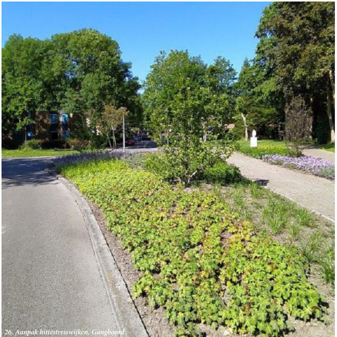
26. Aanpak hittestresswijken, Gangboord

We realiseren de gewenste boomstructuren zoals is aangegeven in Sterke Stammen of het Bomenbeleidsplan Haren. We maken een integraal plan waarbij zowel openbaar als private terreinen een bijdrage leveren aan het klimaatbestendig maken van het gebied. We focussen ons op winkelcentra, basisscholen, kinderopvanglocaties en verzorgingstehuizen, woningcorporaties en inwoners. Per gebied reserveren 20.000 voor het maken van inrichtingsvoorstellen.