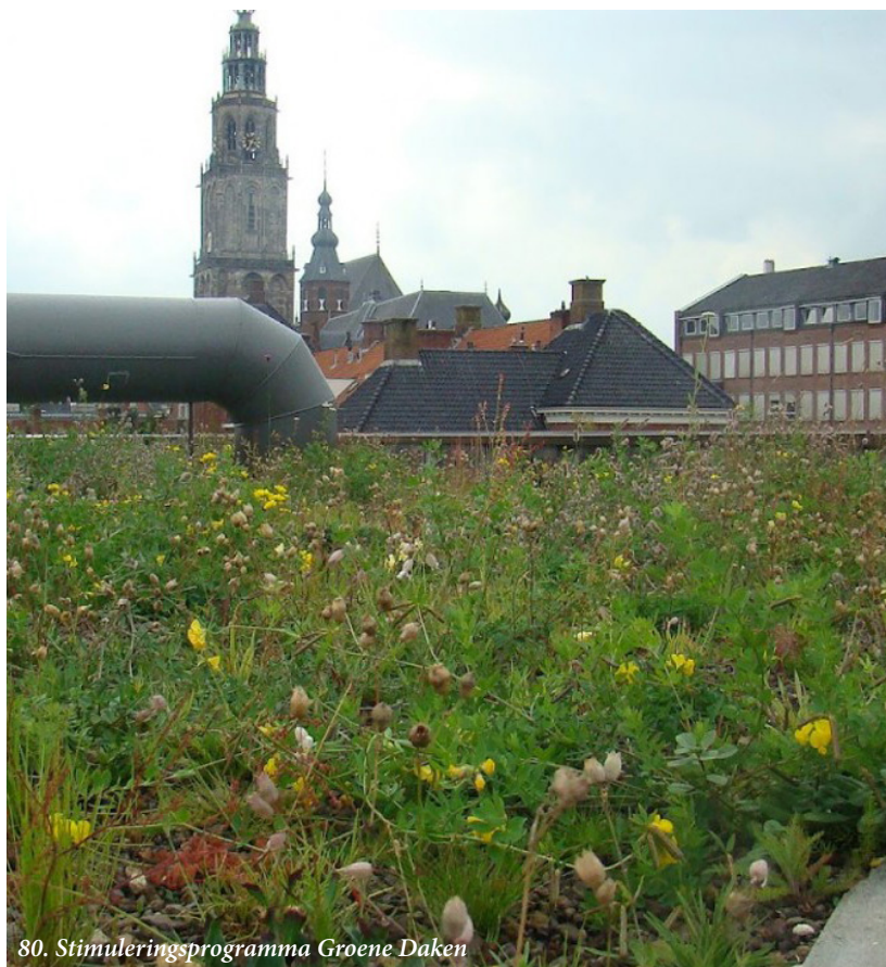
80. Stimuleringsprogramma Groene Daken

Groene daken leveren een nuttige bijdrage aan het klimaat in het stedelijk gebied. Ze houden water vast, dempen de opwarming, produceren zuurstof en zorgen voor een verrijking van de biodiversiteit. We hebben daarom al een aantal jaren een financiële regeling die het aanleggen van groene daken stimuleert. De regeling voorziet duidelijk in een behoefte en draagt bij aan een groeiend aantal groene daken in Groningen. De regeling wordt gefinancierd vanuit het Groninger Water en Rioleringsplan.