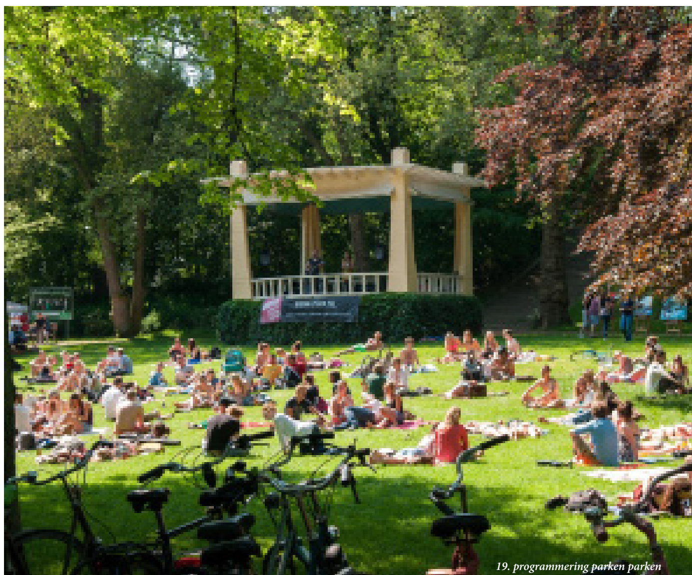
19. programmering parken parken

Het zuidelijke deel heeft vanaf 2023 een nieuw groot park: het Zuiderplantsoen. Het gebied takt aan op bestaande groengebieden als het Engels Park en het Sterrebos. Het is van belang dat het Zuiderplantsoen goed verbonden wordt met de wijken De Wijert, Coendersborg, Europapark en de Rivierenbuurt. We doen dit door groene verbindingen te maken.