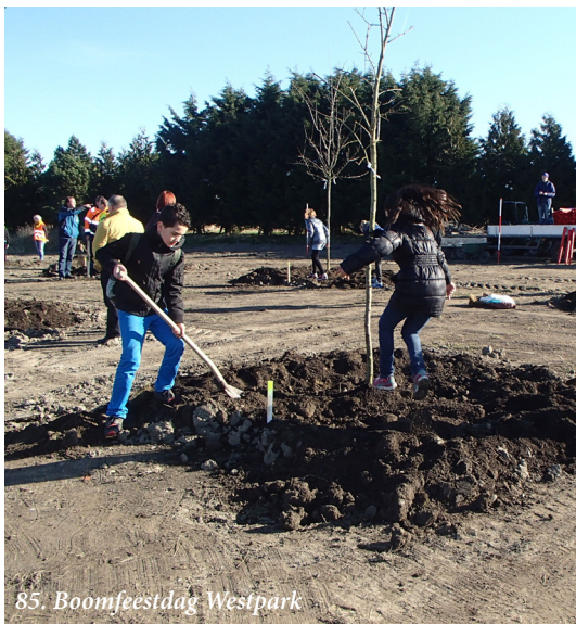
85. Boomfeestdag Westpark

Ter ondersteuning van het herwinnen van de openbare ruimte ontwikkelen we naar analogie van de aanpak van de Binnenstad een Leidraad Openbare Ruimte. Hierin verbeelden we de principes van stimulering van ontmoeting, toegankelijkheid, ruimte voor voetgangers en fietsers, vergroening en het fors terugdringen van geparkeerde auto's. Daarbij willen we in de wijken en dorpen het gebruik van de auto ontmoedigen, juist vanwege het beslag dat er op de ruimte wordt gelegd en willen we kritisch kijken naar het verdere gebruik dat vooral openbaar moet zijn.