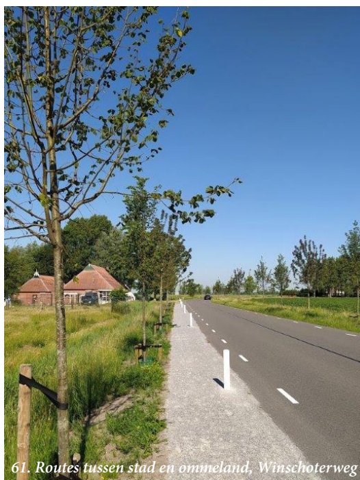
61. Routes tussen stad en ommeland, Winschoterweg