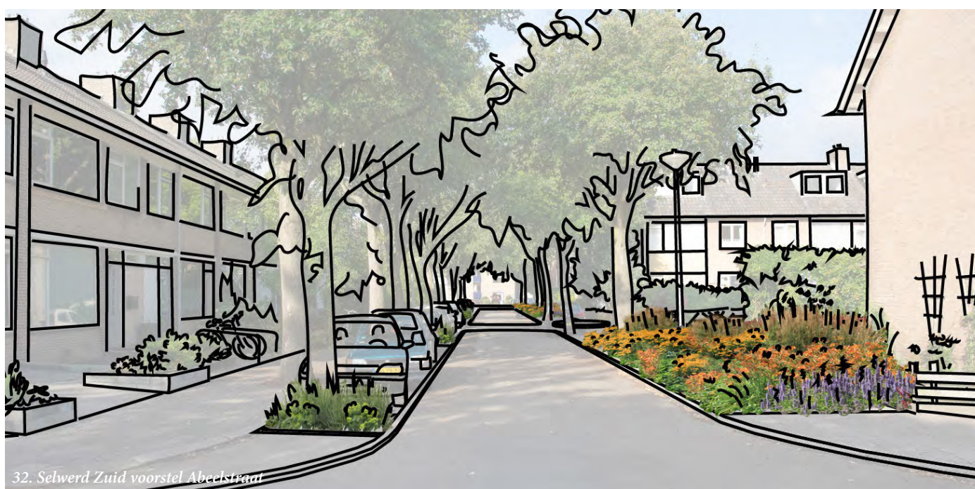
32. Selwerd Zuid voorstel Abeelstraat

Via verschillende programma's wordt al gewerkt aan een groenere binnenstad.