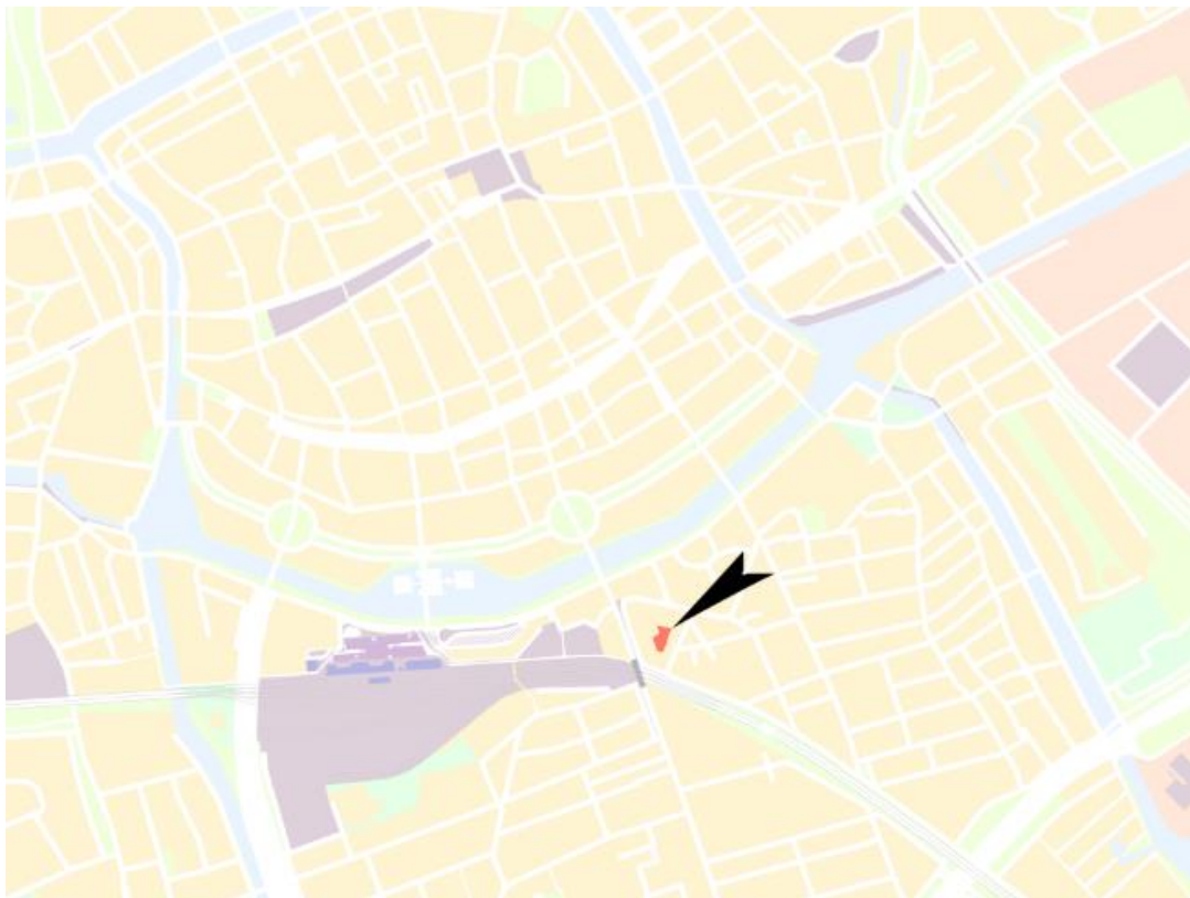
Figuur 1 : ligging plangebied op stadsniveau

Dit bestemmingsplan vervangt een klein deel van het bestemmingsplan Oosterpoort. Onderstaande figuur laat het gebied zien waarvoor dit bestemmingsplan van toepassing is. Het plangebied betreft een binnenterrein, geheel omsloten door bestaande bebouwing.