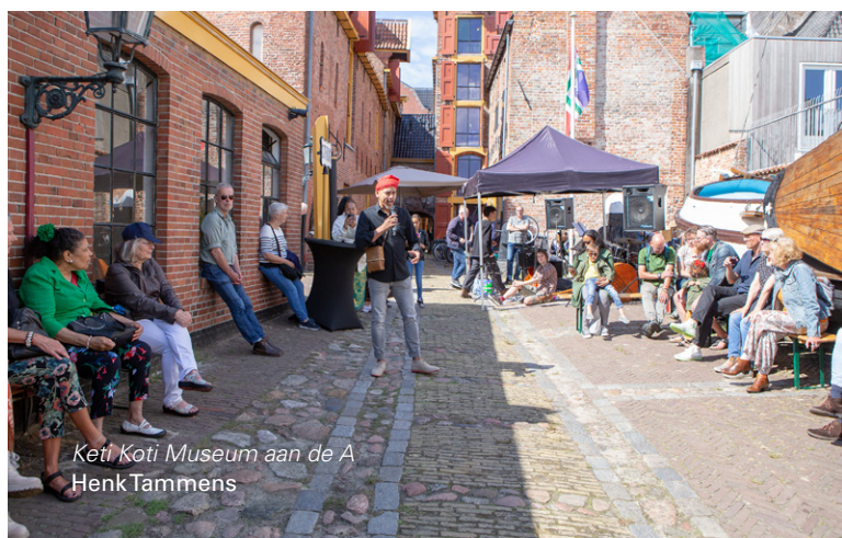
Keti Koti Museum aan de A Henk Tammens