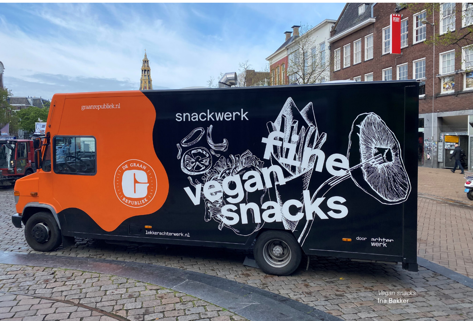
Vegan snacks Ina Bakker

https://gemeenteraad.groningen.nl/Documenten/Bijlage-Voedselagenda-2021-2023.pdf