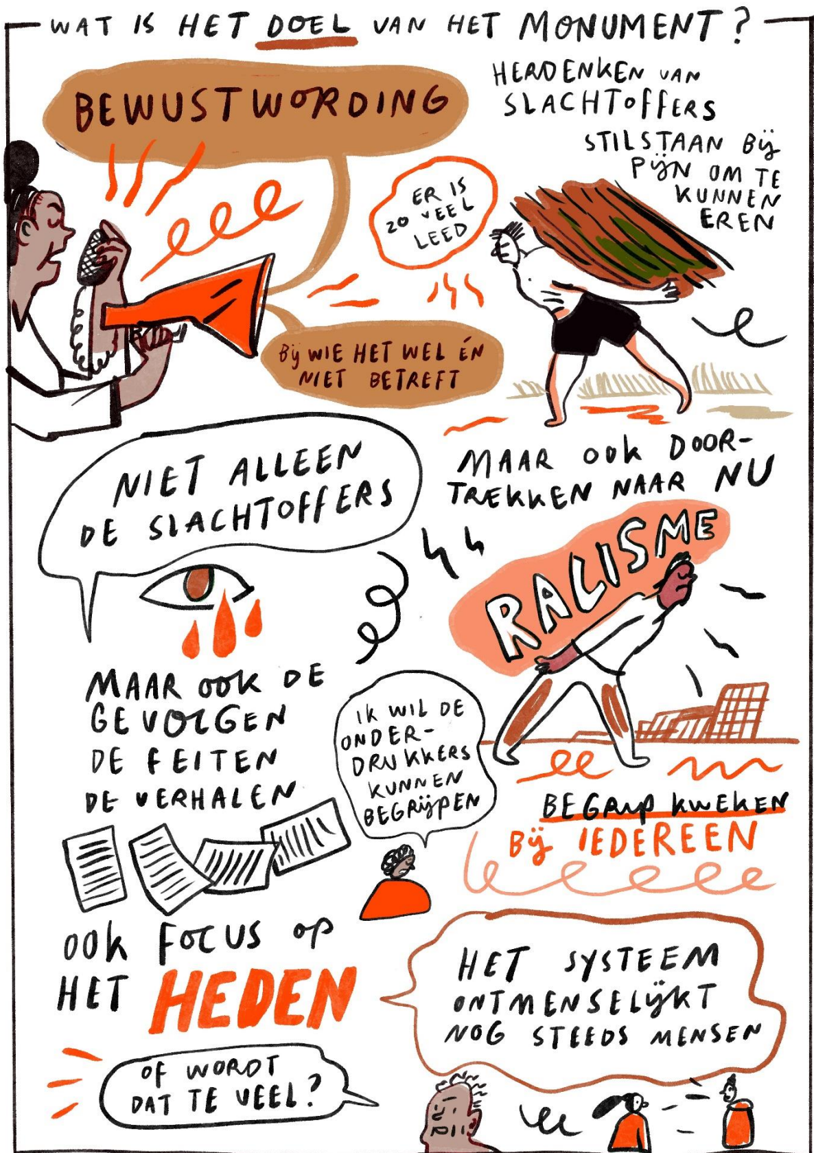
Bijlage 4: Een indruk van de visuele verslaglegging van de inspiratiebijeenkomsten door Anne Stalinski. De volledige beeldverslagen zijn bij Kunstpunt op te vragen.