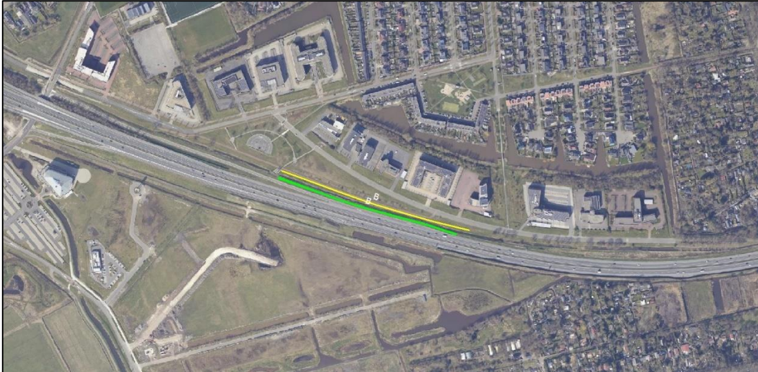
Figuur 6: Schermdeel B

Schermddeel B is gepland langs de busbaan. Deze begint bij de afslag vanaf de snelweg en loopt tot aan het kunstwerk.