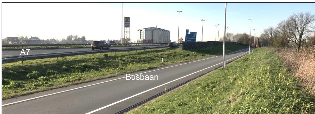
Figuur 5: Begin van het tijdelijke scherm

Daarnaast zal bij verplaatsing het scherm op een grotere afstand van de weg komen te staan. Hierdoor is de effectiviteit lager en dat moet tevens gecompenseerd worden met een hogere schermuitvoering.