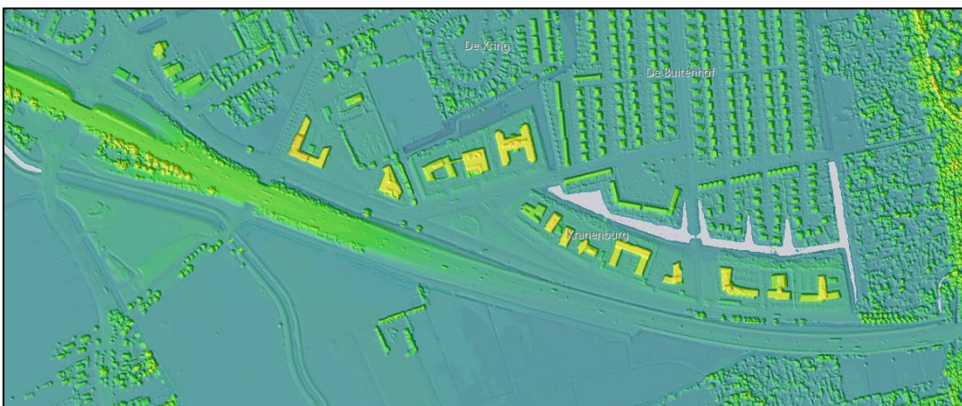
Figuur 3: Hoogtekaart

Als het schermen verder van de weg worden geplaatst kan geen gebruik worden gemaakt van de weghoogte en dat zal moeten worden gecompenseerd door het scherm zelf.