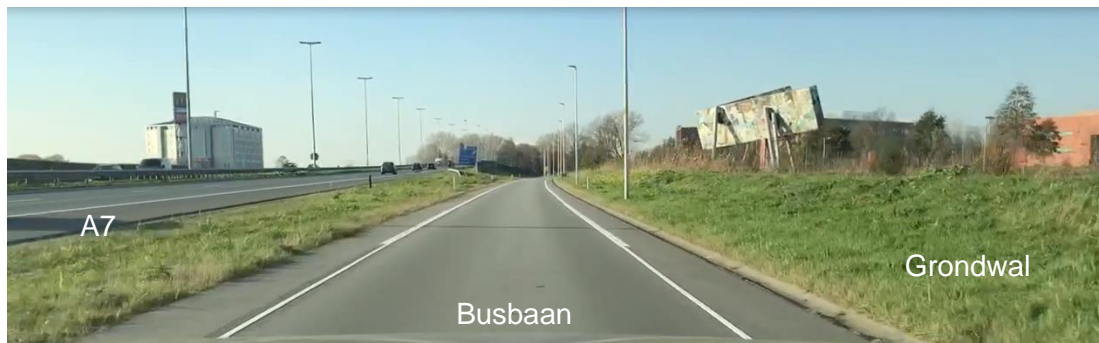
Figuur 8: Busbaan

Tevens kan er dan geen gebruik worden gemaakt van de bestaande aarden wal langs de busbaan die zorgt voor de eerste 60 cm verhoging.