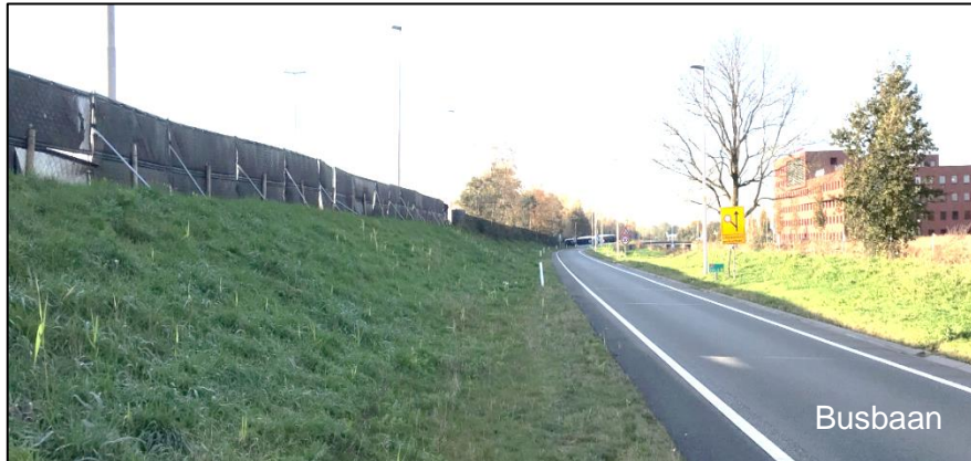
Figuur 4: Scherm op het verhoogde wegdeel