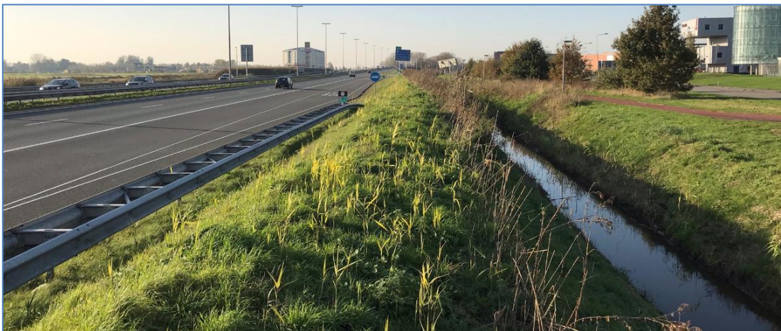
Figuur 7: Het deel waar de afslag voor de busbaan is aangelegd

Bij verplaatsing naar gemeenteground komt het scherm langs het fietspad te liggen.