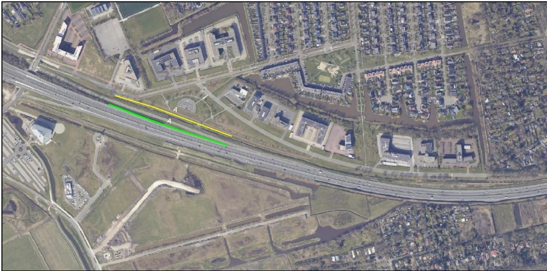
Figuur 2: Schermdeel A

Schermddeel A staat op het verhoogde deel van de weg vanwege het viaduct over de busbaan. Daar zijn de tijdelijke “soundshields” geplaatst.