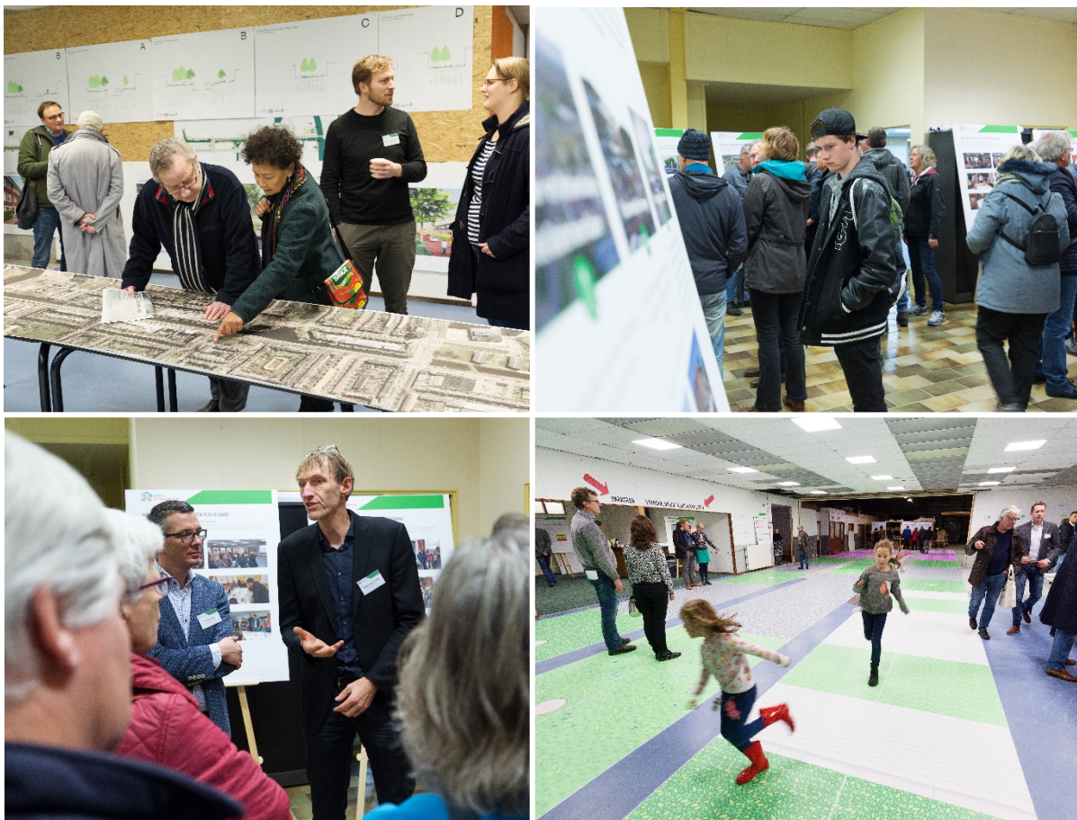
Sfeerimpressies van de bewonersbijeenkomst op donderdag 23 november 2017.

Bezoekers leverden ruim 50 ingevulde reactieformulieren in. Het reactierapport is op de website gepubliceerd. De uitnodiging voor de inloopbijeenkomsten is bij circa 9.000 huishoudens in de brievenbus gevallen.