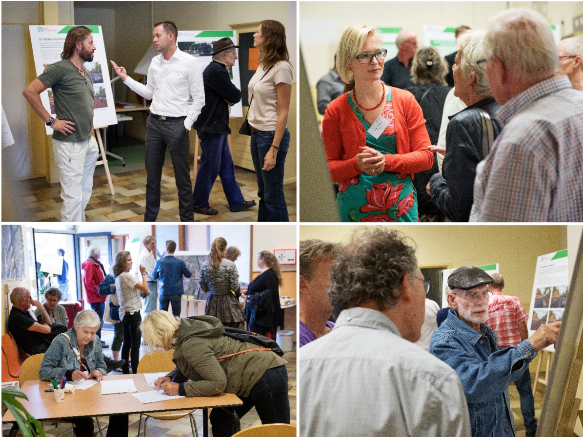
Sfeerimpressies van de bewonersbijeenkomsten op 11 en 13 juli 2017.

De uitnodiging voor de inloophbijeenkomsten is, samen met een algemene folder over het project, bij circa 9.000 huishoudens in de brievenbus gevallen.