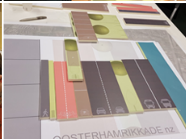
Sfeerimpressies van de ontwerpessies voor het Oosterhamriktracé.