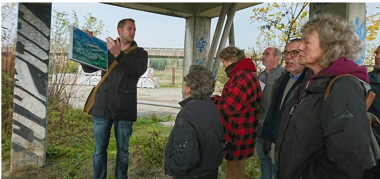
Sfeerimpressies van de wijkwandeling op zaterdag 4 november 2017.