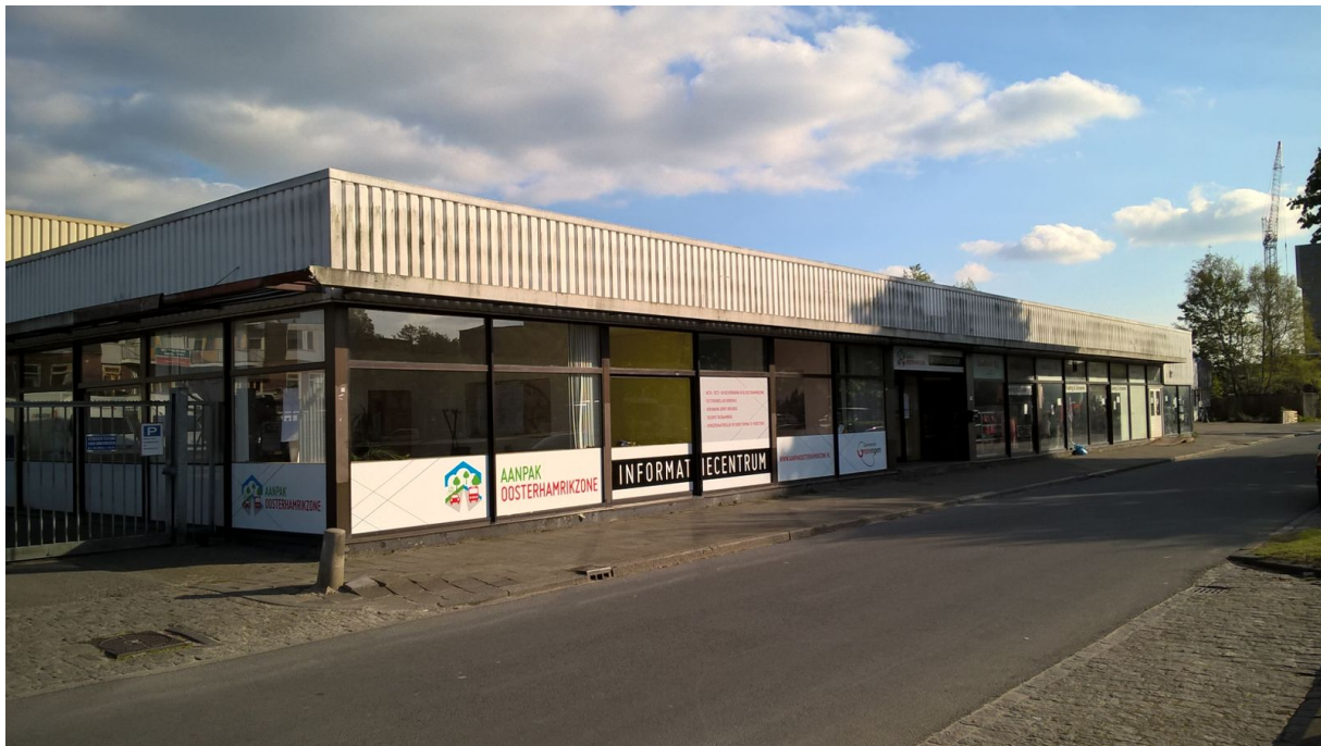
Het informatiecentrum aan de Oosterhamrikkade zuidzijde 119.

Het informatiecentrum is naar aanleiding van een vraag vanuit de omgeving geschikt gemaakt voor mindervaliden.