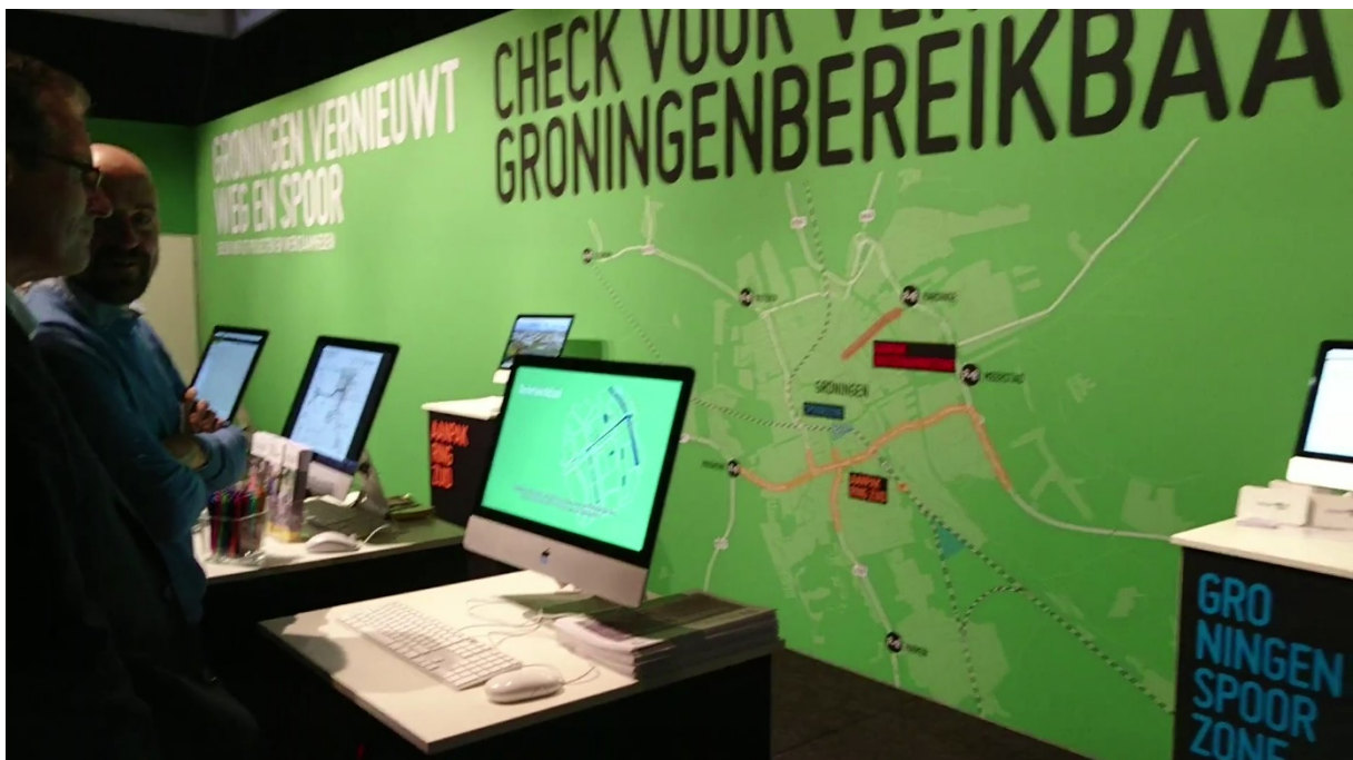
Sfeerimpressie van de Groningen Bereikbaar-stand waar Aanpak Oosterhamrikzone twee dagen stond.

Op dinsdag 7 en woensdag 8 november 2017 waren vertegenwoordigers van Aanpak Oosterhamrikzone aanwezig bij de promotiedagen Noord-Nederland. Het project had een desk in de stand van Groningen Bereikbaar. In deze stand waren ook de andere grote bereikbaarheidsprojecten zoals Aanpak Ring Zuid en Groningen Spoorzone aanwezig.