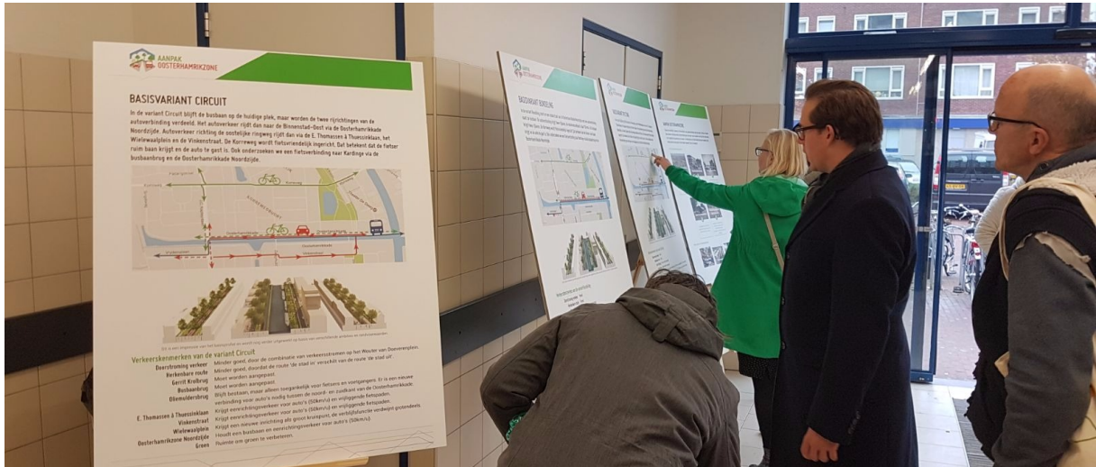
Sfeerimpressie van de supermarktsessie in de Lidl aan het Wielewaalplein.