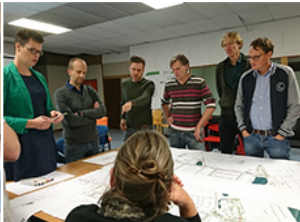
Sfeerimpressies van de ontwerpessies voor de fietsvriendelijke Korreweg