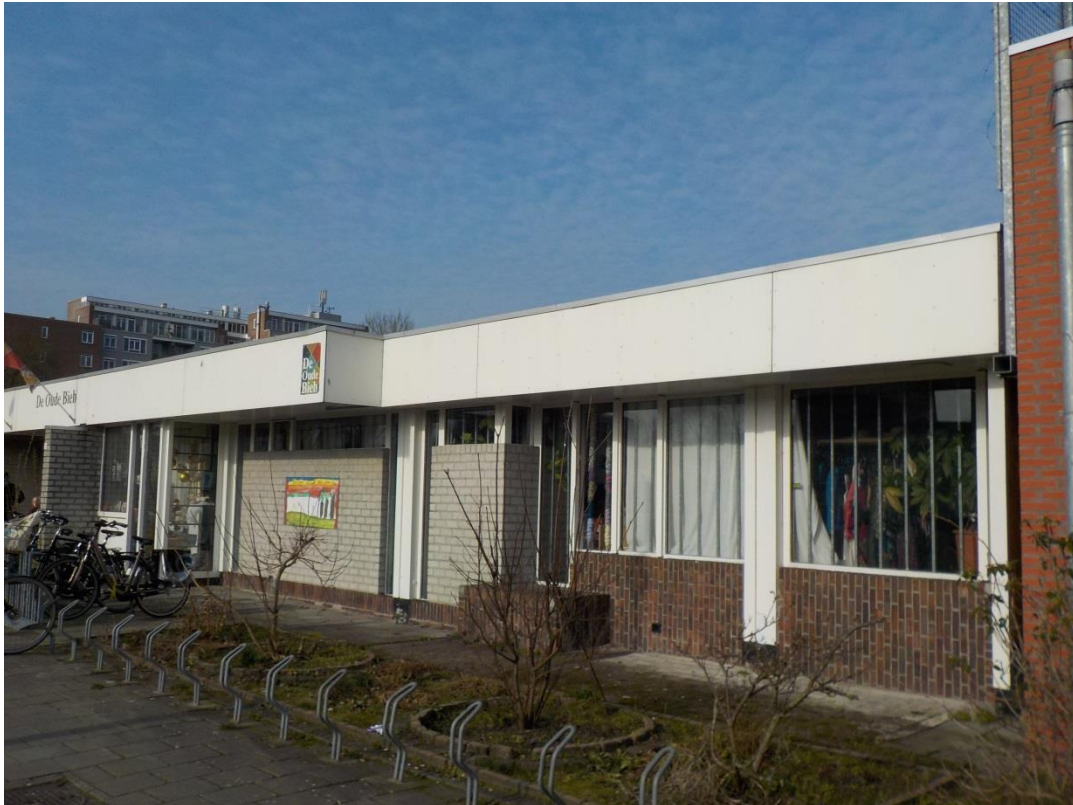
Foto 1 Impressie van het onderzochte gebouw.