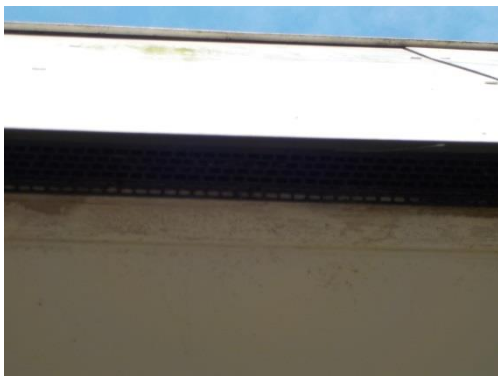
Foto 2 De kieren tussen de muur en de boeidelen zijn afgewerkt met roostertjes en daardoor ontoegankelijk voor vleermuizen.

De aanwezigheid van verblijfplaatsen van vleermuizen kan op basis van de quickscan worden uitgesloten. Het gebouw is ongeschikt voor vleermuizen om er een verblijfplaats te hebben. Het gebouw heeft weliswaar een spouw, maar deze is niet toegankelijk voor vleermuizen. Ook de ruimte achter de boeidelen zijn ontoegankelijk, doordat openingen zijn afgewerkt met roostertjes (zie foto 2).