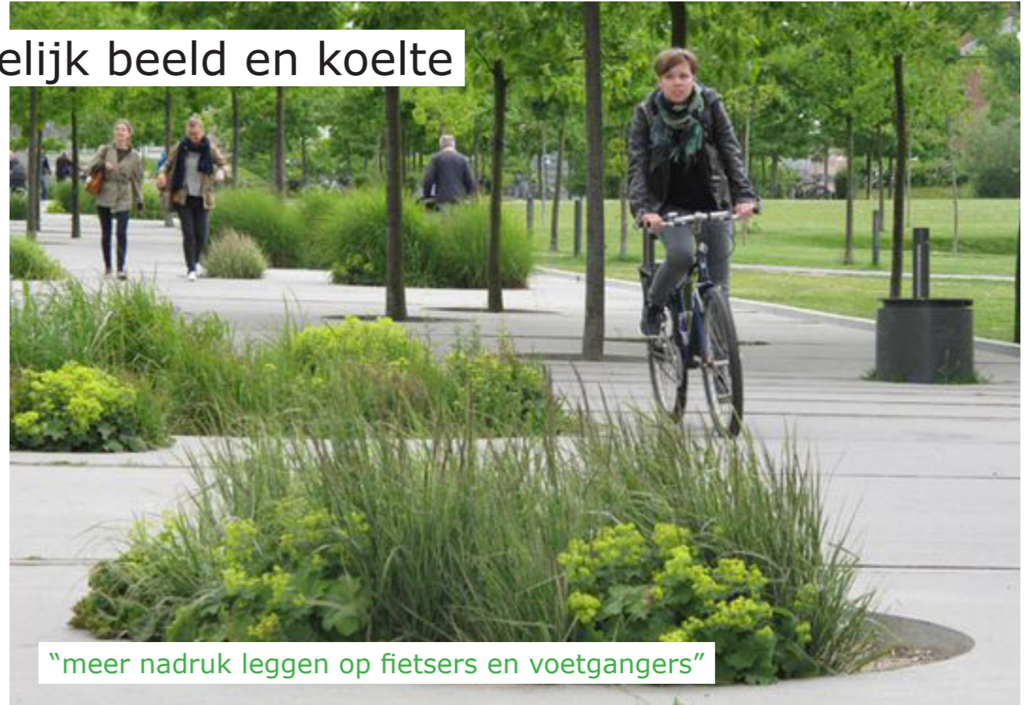
“meer nadruk leggen op fietsers en voetgangers”