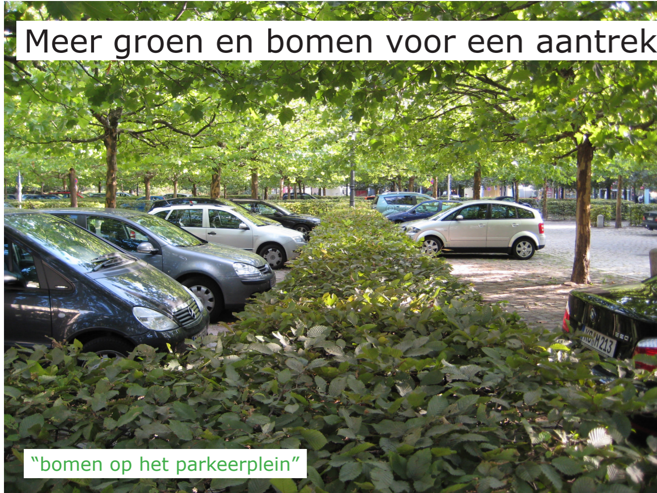
“bomen op het parkeerplein”