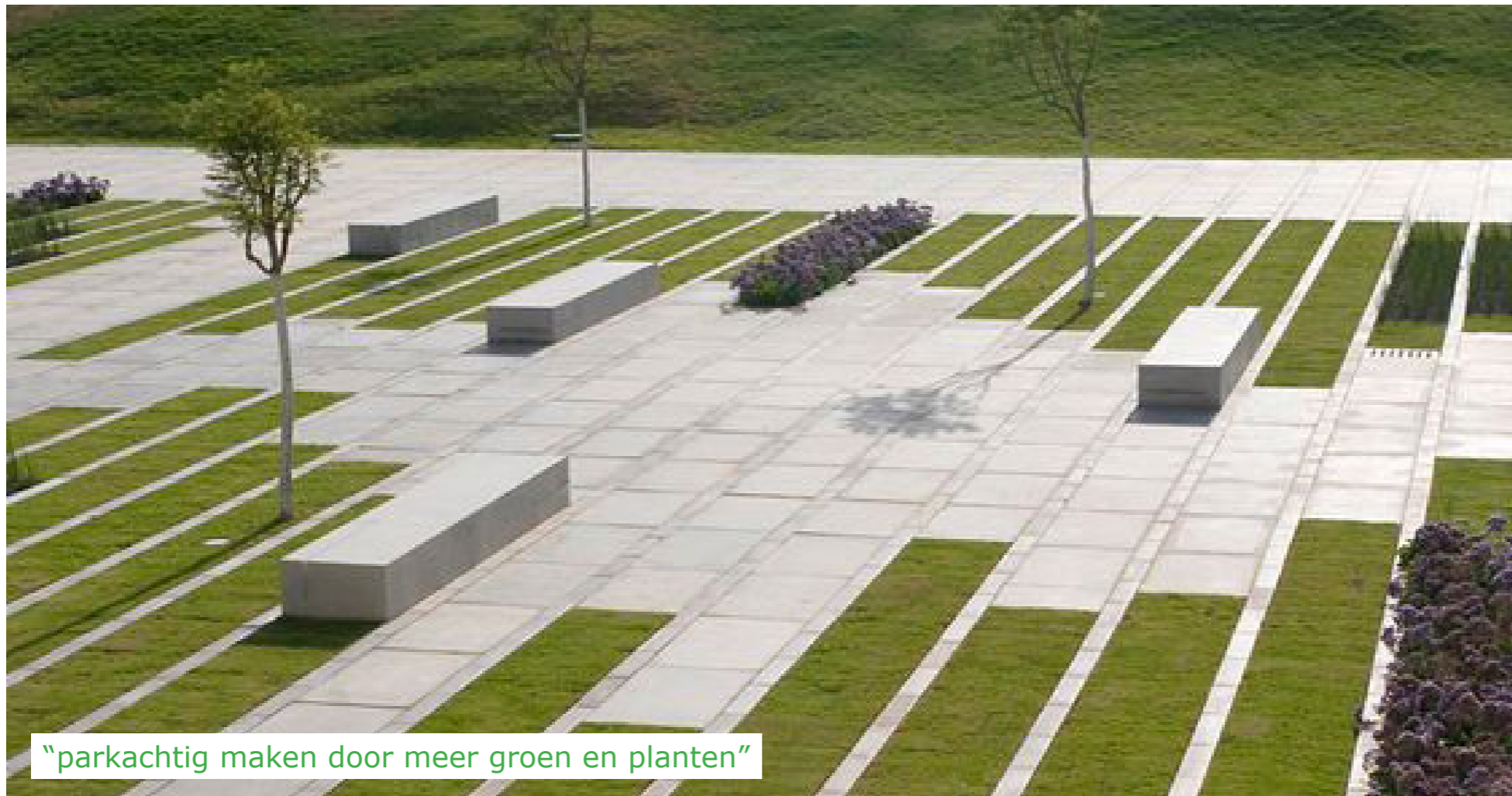
“parkachtig maken door meer groen en planten”