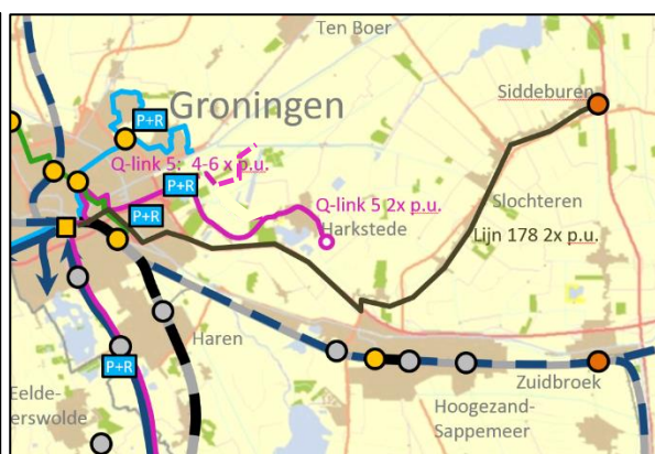
Figuur 2: voorgestelde OV-ontsluiting (gestippeld mogelijk toekomstige route via Meerstad)

De doortrek van Q-link 5 naar Harkstede/Scharmer en Ter Sluis zijn opgenomen in de dienstregelingsvoorstellen 2018. Per september 2017 wordt Q-link 5 dus nog niet doorgetrokken naar Harkstede/Scharmer en Ter Sluis.