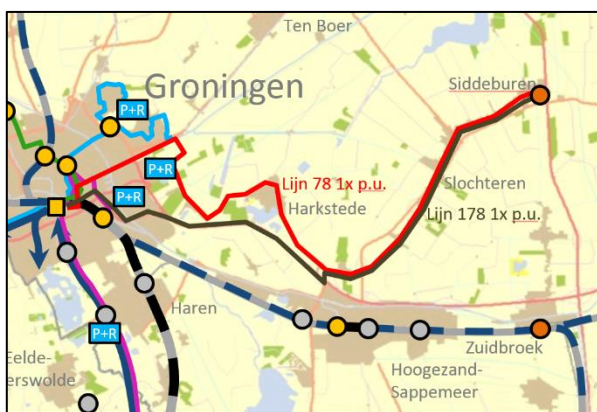
Figuur 1: huidige OV-ontsluiting

Een deel van de ritten vanaf P+R Meerstad verlengen naar Ter Sluis is ook onderdeel van deze gedachte. Dit nieuwe gedeelte van Meerstad zal de komende jaren ontwikkeld worden. Door hier vanaf het begin een busverbinding te bieden zorgen we ervoor dat het openbaar vervoer vanaf het moment dat de eerste bewoners zich vestigen een vanzelfsprekendheid is in deze wijk.