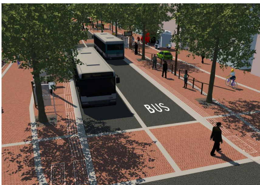
Nieuwe centrumhalte Westerhaven

Lijn 8 gaat niet via het Gedempte Zuiderdiep rijden. Vanuit het busgebruik en de in opdracht van de gemeente Groningen uitgevoerde enquête is naar voren gekomen dat het merendeel van de reizigers gebaat is bij een route van lijn 8 vanaf de Westerhaven rechtstreeks naar het Hoofdstation en vice versa. Reizigers voor het centrum kunnen gebruikmaken van de halte Westerhaven en vanaf daar eventueel gebruik maken van alternatief vervoer. De gemeente Groningen introduceert namelijk tegelijkertijd met het verleggen van de busroute het alternatief vervoer naar de omgeving A-kerk.