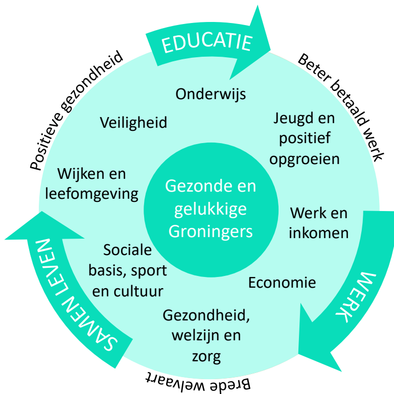
Figuur 1: Integrale aanpak voor een leefbaar Groningen na de coronapandemie

De reeds ingezette lijn gericht op integrale wijkvernieuwing, om de kloof in leefbaarheid en levensgeluk bij inwoners in de verschillende wijken binnen de gemeente te verkleinen, wordt ook gehanteerd om de negatieve effecten van corona te dempen en het herstel in te zetten. Door de coronapandemie en de lockdowns zijn deze verschillen namelijk alleen maar groter geworden. 2 Deze neerwaartse spiraal kan onderbroken worden door te investeren in onderwijs, werk en een leefbare samenleving (zie figuur 1). Vanuit het Nationaal Programma Onderwijs wordt druk gewerkt aan plannen om het Groningse onderwijs te versterken. Ook is er inmiddels 'Groningen Vooruit' gepresenteerd, de economische herstelagenda voor een bruisende gemeente na corona. Het perspectiefplan na corona is complementair aan deze plannen die vanuit onderwijs en economie/werk zijn ingezet.