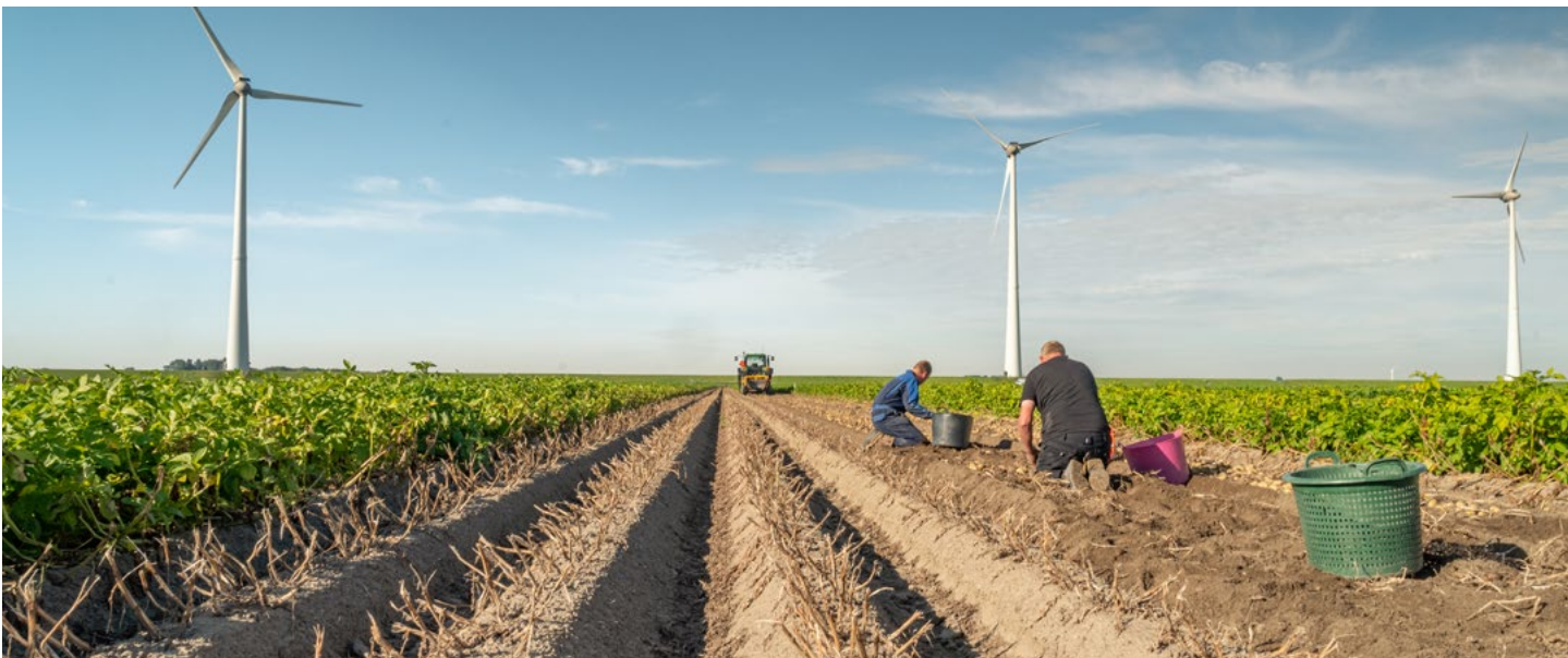
Landbouw en duurzame energie bij de Eemshaven.

economie, digitalisering, en natuurinclusieve landbouw. Terreinen waar het Noorden een goede positie heeft maar die bestedinging behoeft. In de agrarische sector maken we de transitie naar natuurinclusieve landbouw in samenhang met uitdagingen op het gebied van klimaat. De energie-