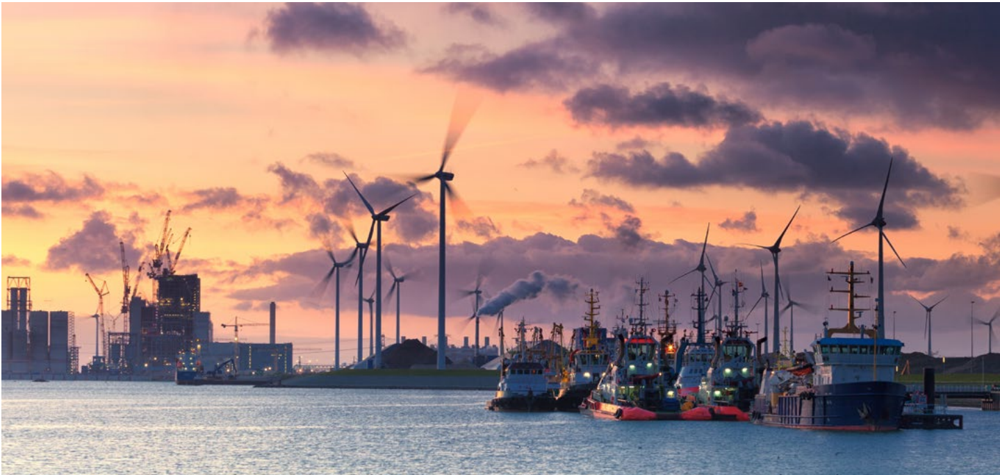
Sterke sectoren in Delfzijl: chemie en duurzame energie.

economische sterke sectoren van de regio. Rijk en regio gaan een langjarig partnerschap aan om deze ambitie te realiseren en de regionale economie te versterken. Daarbij investeert het Rijk, vanuit Europese fondsen, circa 500 mln in groene economische groei en digitale innovaties om de ambities van Groningen te realiseren.