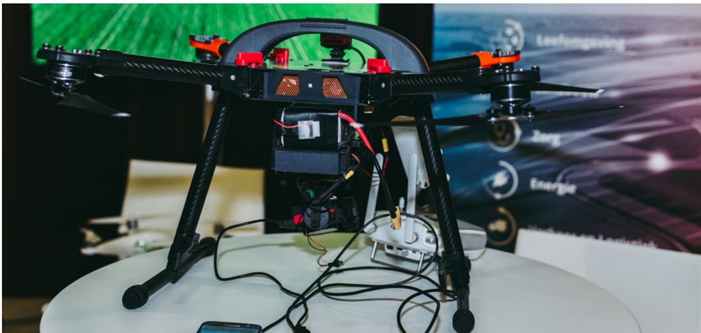
Digitalisering brengt de sterke sectoren energie en healthy ageing op een hoger plan.

Met dit pakket aan afspraken zetten Rijk en regio zich in voor een toekomstbestendige regionale economie die waar mogelijk bijdraagt aan (inter) nationale opgaven en doelstellingen. Innovatieve technieken staan nog in hun kinderschoenen, waardoor investeringen gepaard gaan langjarige samenwerkingstrajecten. Transitie gaat gepaard met een lange adem aan persistente inzet en afstemming tussen overheid, bedrijfsleven en bewoners. Het is daarom van belang dat we integraal en langjarig samenwerken. Naast deze toekomstagenda borgen we de versterking van de regionale economie ook in samenwerking binnen het NPG, de NOVI, de uitwerking van het Just Transition Plan en het MKB- en agroprogramma.