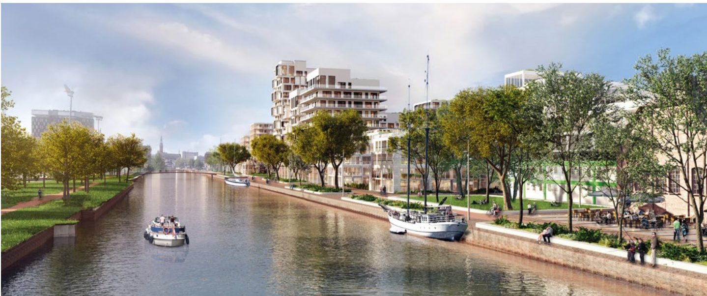
Toekomstige woningbouw in de stad Groningen: de nieuwe wijk Stadshavens, aan het Eemskanaal. Impressie: Gemeente Groningen

In zowel stad als regio zijn kwetsbare gebieden, in steden en dorpen. In die gebieden is sprake van een kwalitatief laagwaardige en energetisch slechte woningvoorraad en sleetse openbare ruimte. In de wijk- en dorpsvernieuwing worden deze opgaven reeds geadresseerd, waar mogelijk