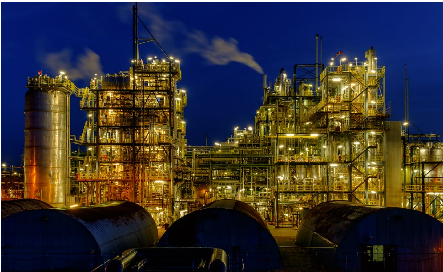
De haven van Delfzijl loopt voorop in de verduurzaming van de industrie.

Dit maakt Noord-Nederland zeer kansrijk voor het realiseren van een systeemtransitie. Hiermee kan een belangrijke bijdrage worden geleverd aan het halen van de klimaatdoelen voor Nederland als geheel, competitief voordeel in Europa (tijdens het opstarten Nederland/Groningen als gids; op lange termijn in een importsysteem als kennis en innovatiehub). Bovendien biedt het een groen groeiperspectief voor de regio.