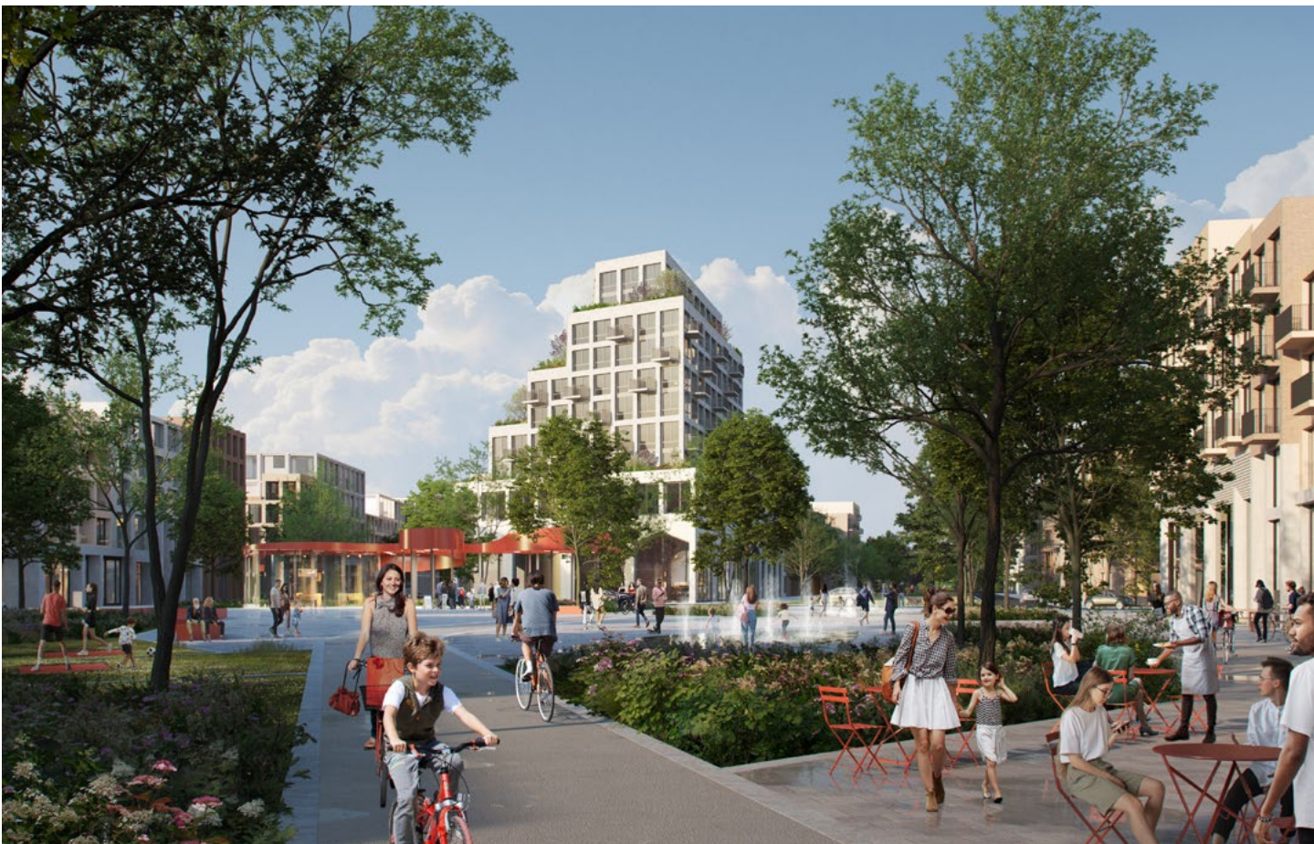
Aan de westkant van de stad Groningen, op het terrein van de vroegere suikerfabriek, verrijst de nieuwe wijk De Suikerzijde. Impressie: Gemeente Groningen.

De plek van je wieg mag niet je kansen in het leven bepalen, maar doet het al te vaak. Met wijk- en dorpsvernieuwing probeert de regio deze complexe en langdurige problematiek integraal aan te pakken, dicht bij de mensen met gerichte interventies. Echter, deze complexe opgave gaat de (financiële) capaciteit en sturingsmogelijkheden van de gemeenten te boven. Tegelijkertijd is er in Groningen een krachtige preventiecoalitie van kennisinstellingen, maatschappelijke organisaties en uitvoeringpartners om de transformatie innovatief door te zetten. Rijk en regio gaan in gesprek waar er belemmeringen zijn om daarop innovatieve werkwijzen toe te passen.