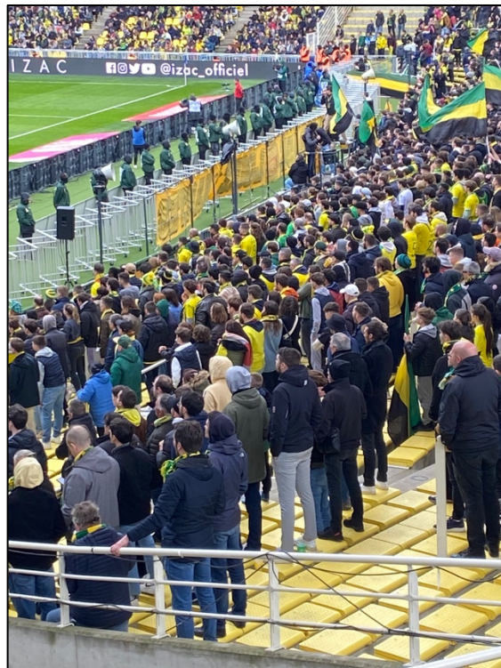
Inzet van zogenaamde “scharhekken” tussen tribune en veld (AS Nancy, Frankrijk)