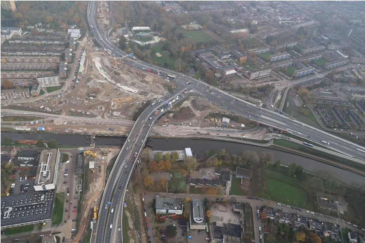
De eerste boog vol beton wordt al duidelijk zichtbaar op het Julianaplein; dit is de bocht die het meest diep ligt en loopt van Hoogezand richting Assen.

In diezelfde hoek zijn de bewoners van de Rivierenbuurt meerdere keren uitgenodigd voor presentaties over veranderingen in hun omgeving: een inloopbijeenkomst voor de herinrichting van het verkeersplein Brailleweg/Hoornsediep werd door circa 40 inwoners bezocht. Een meer feestelijke bijeenkomst om de buurt te bedanken werd bezocht door circa 80 mensen. Deze bijeenkomst was tevens bedoeld om de geplande kunst in de Papiermolentunnel te presenteren. Tot slot: het Julianaplein als centraal punt in de werkzaamheden is rond de kerst gebruikt om alle inwoners van Groningen en de regio te bedanken voor hun medewerking en welwillendheid (om om te rijden) door het plaatsen van een reuzenrad. Dat rad is mogelijk gemaakt door onderaannemers en relaties van CHP, Gastvrij Groningen en Groningen Bereikbaar.