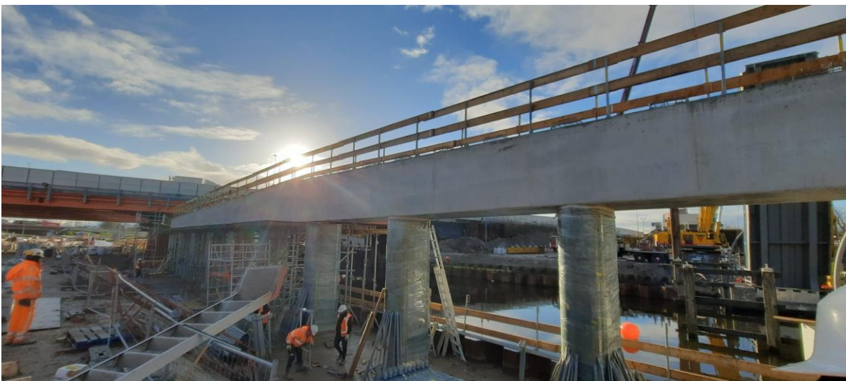
Tussensteunpunt nieuwe Julianabrug.