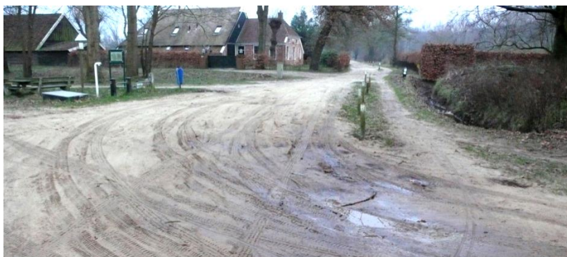
Zandwegen en een goede leefomgeving gaan prima samen in Haren. Lutsborgsweg hoek Boerlaan.