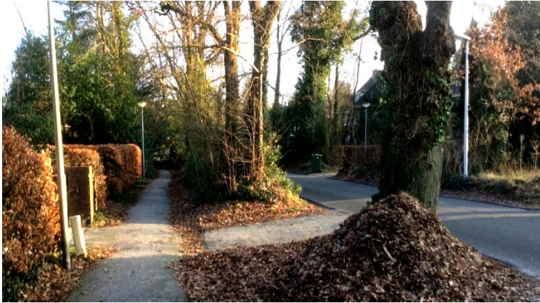
In Haren-dorp verwijzen oude houtwallen langs stegen en lanen naar de vroegere kampenstructuur.