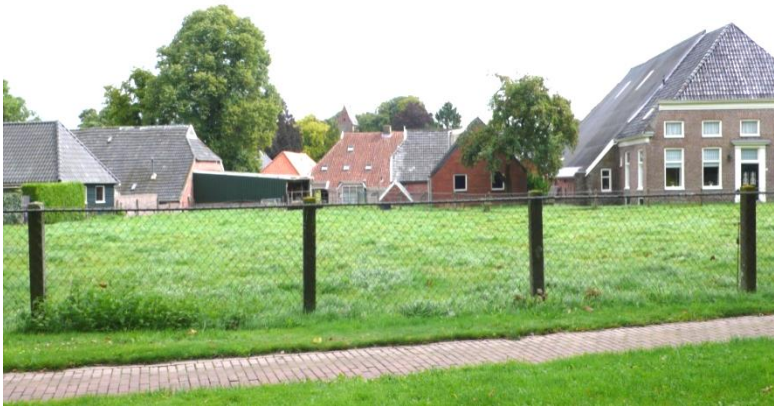
Noordlaren vertoont nog een sterk agrarisch karakter met boerderijen en kalverkampen.