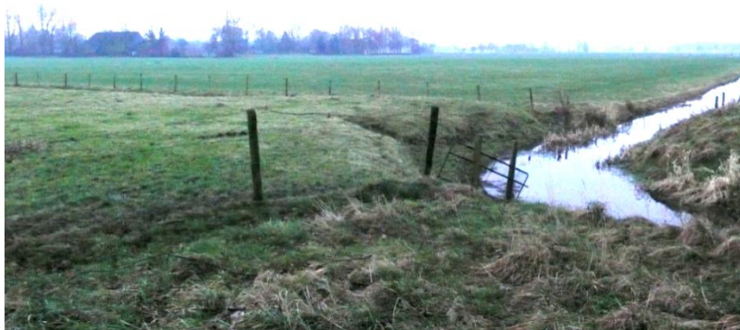
De westelijke Hondsrugflank in Haren: Open agrarisch gebied met vitale boerenbedrijven. Op de voorgrond het Helper Maar.