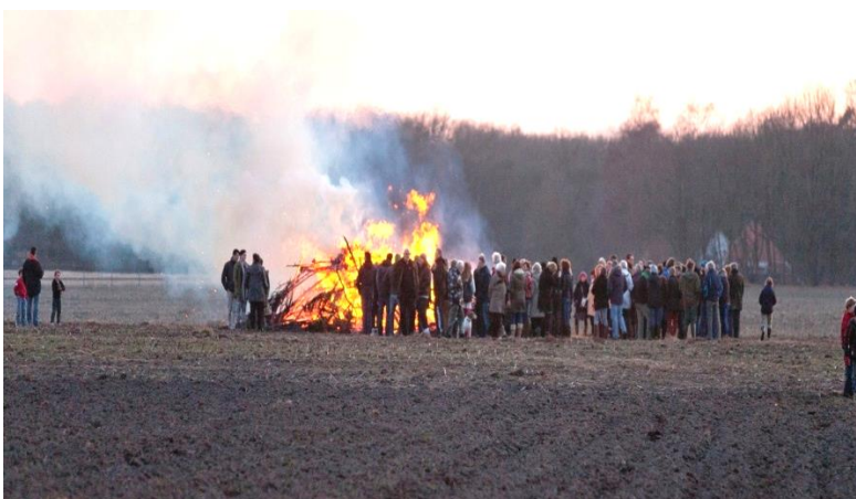
De gemeenschapszin in de buitendorpen is groot. Jaarlijkse paasvuur in Onnen en Noordlaren.