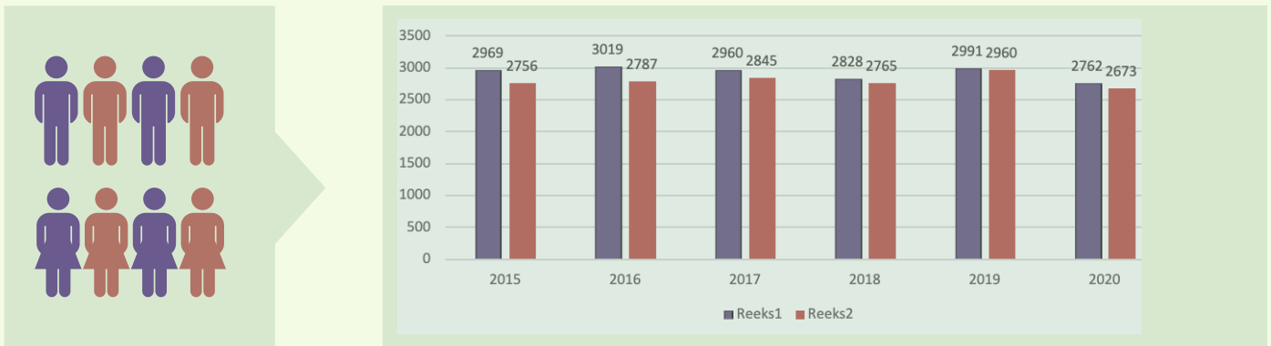
Figuur 1: De formatie en bezetting worden weergegeven in fte's over de laatste vijf en half jaar, peildatum 31-07-2020