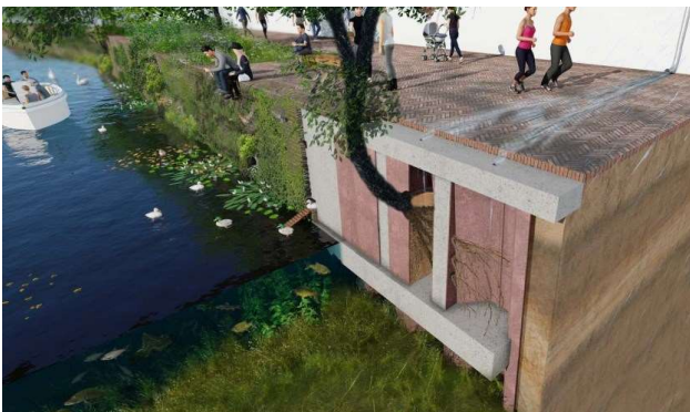
Groene kademuren in Breda en Den Haag