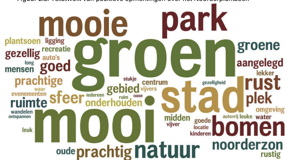
Figuur 2.3: Tekstwolk van positieve opmerkingen over het Noorderplantsoen

Een andere wens die door meerdere respondenten wordt genoemd is een verbetering van het toezicht in het plantsoen. Veel respondenten zien graag de politie en stadstoezicht meer zichtbaar aanwezig in het Noorderplantsoen. Men wenst met name meer toezicht op het opruimen van afval, het opruimen van hondenpoep en het los laten lopen van honden op plaatsen waar dat niet mag. Een aantal respondenten spreekt zelfs de wens uit voor stevige boetes voor de overtreders van deze regels.