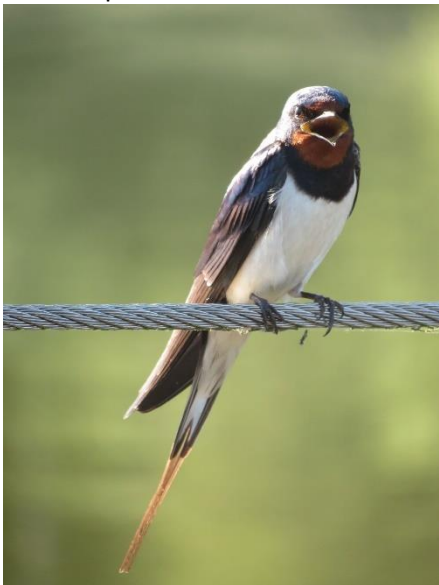
Boerenzwaluw bij Hoornseplas

Op Instagram worden diverse tags gebruikt in ons gebied. Bij de tag Paterswoldsemeer en Hoornsemeer zijn meer dan 10100 berichten gedeeld (verdubbeling t.o.v. 2021) en bij de Hoornseplas meer dan 1000.