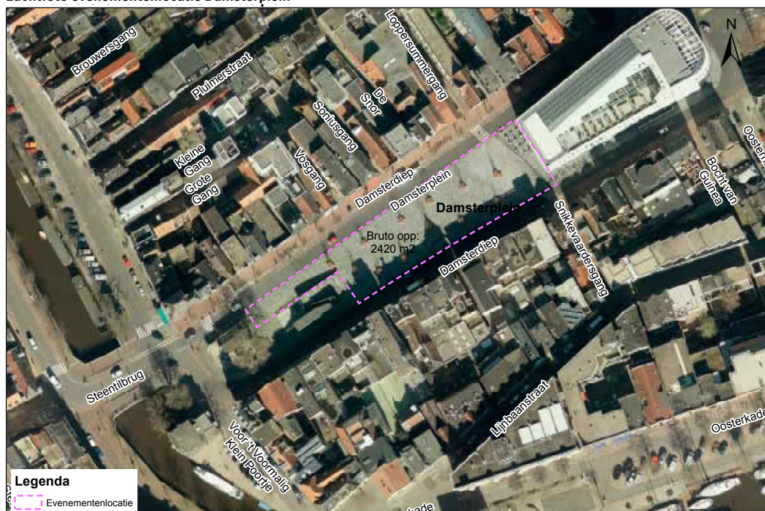
Luchtfoto evenementenlocatie Damsterplein

De oppervlakte van de evenementenlocatie Damsterplein is circa 2420 m 2 bruto. De inzetbare ruimte verschilt per evenement en is onder andere afhankelijk van de gebruikte opstelling op het terrein, het type evenement en de noodzakelijke gezondheids- en veiligheidsmaatregelen.