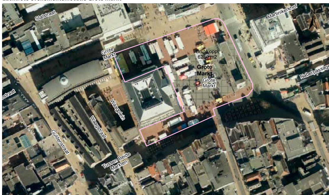
Luchtfoto evenementenlocatie Grote Markt

Met de Grote Markt beschikken wij over circa 6400 m 2 aan bruto evenementenlocatie in het hart van de stad. De inzetbare ruimte verschilt per evenement en is onder andere afhankelijk van de gebruikte opstelling op het terrein, het type evenement en de noodzakelijke gezondheids- en veiligheidsmaatregelen.