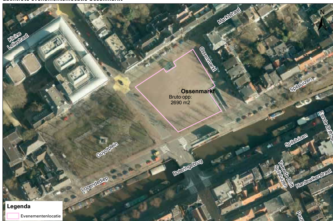
Luchtfoto evenementenlocatie Ossenmarkt

Met de Ossenmarkt beschikken wij over circa 2700 m 2 aan bruto evenementenlocatie net buiten het centrum aan de gracht. De inzetbare ruimte verschilt per evenement en is onder andere afhankelijk van de gebruikte opstelling op het terrein, het type evenement en de noodzakelijke gezondheids- en veiligheidsmaatregelen.