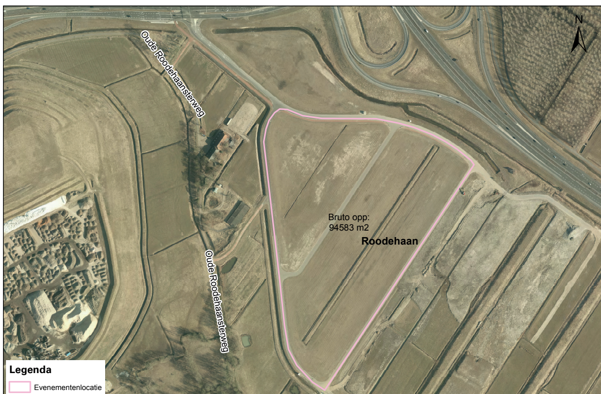
Luchtfoto evenementenlocatie Roodehaan

De oppervlakte van de evenementenlocatie Roodehaan is circa 90.000 m 2 . De werkelijk inzetbare ruimte verschilt per evenement en is onder andere afhankelijk van de gebruikte opstelling op het terrein en het type evenement.