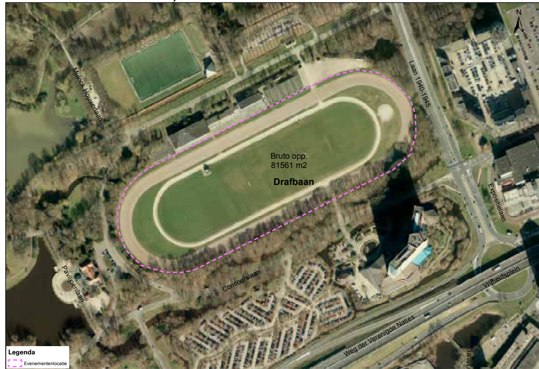
Luchtfoto evenementenlocatie Stadspark Drafbaan

De oppervlakte van de evenementenlocatie drafbaan Stadspark is circa 81.600 m 2 . De werkelijk inzetbare ruimte verschilt per evenement en is onder andere afhankelijk van de gebruikte opstelling op het terrein en het type evenement.