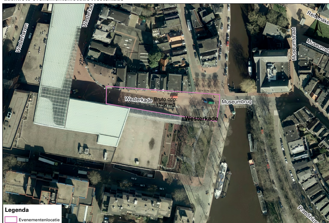
Luchtfoto evenementenlocatie Westerkade

Met de Westerkade beschikken wij over circa 1760 m 2 aan bruto evenementenlocatie aan de rand van het stadscentrum. De inzetbare ruimte verschilt per evenement en is onder andere afhankelijk van de gebruikte opstelling op het terrein, het type evenement en de noodzakelijke gezondheids- en veiligheidsmaatregelen.