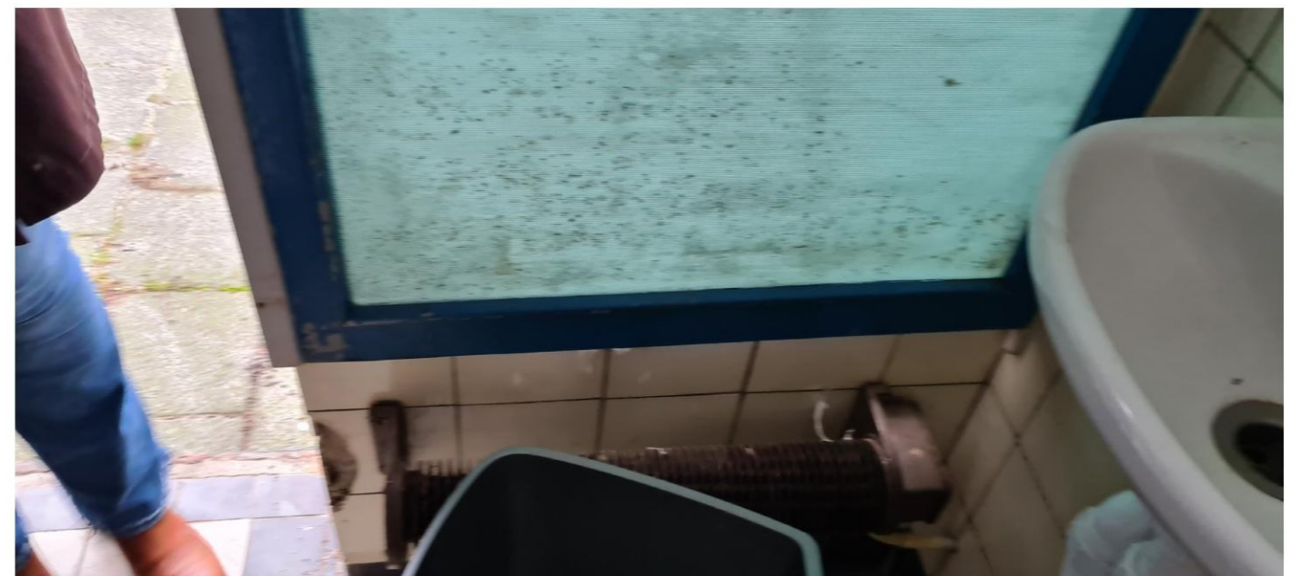
Vitrine in tweede toilet, blauw geverfd. Schade aan tegelwerk.