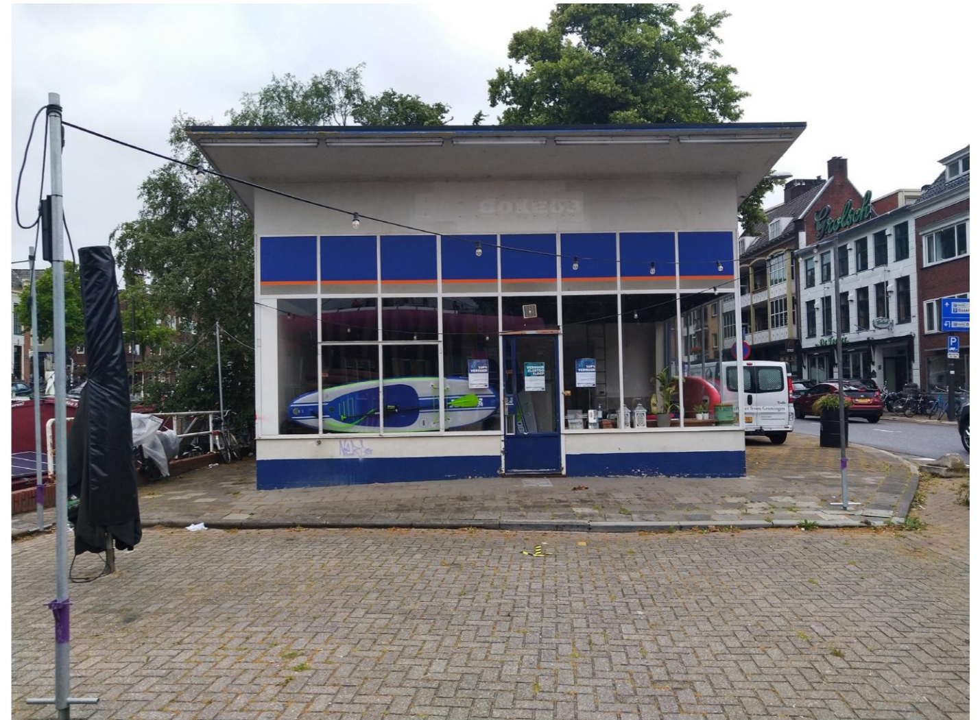
Oostgevel met niet oorspronkelijke deur op niet oorspronkelijke plek