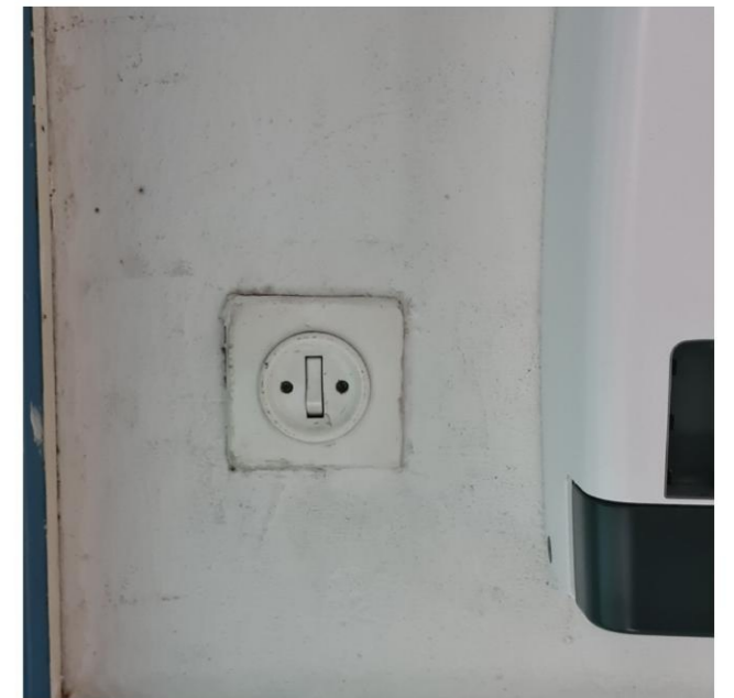
Deels oorspronkelijk schakelmateriaal.