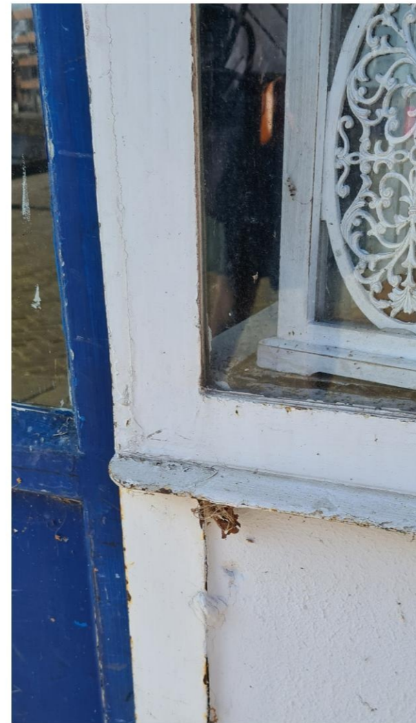
Nieuwe opening met doorlopende lekdorpel