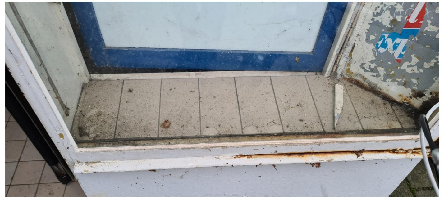
Vensterbank dmv tegels. Elders zijn hier kunststof vensterbanken overheen gezet. Blauw geverfde vitrine.