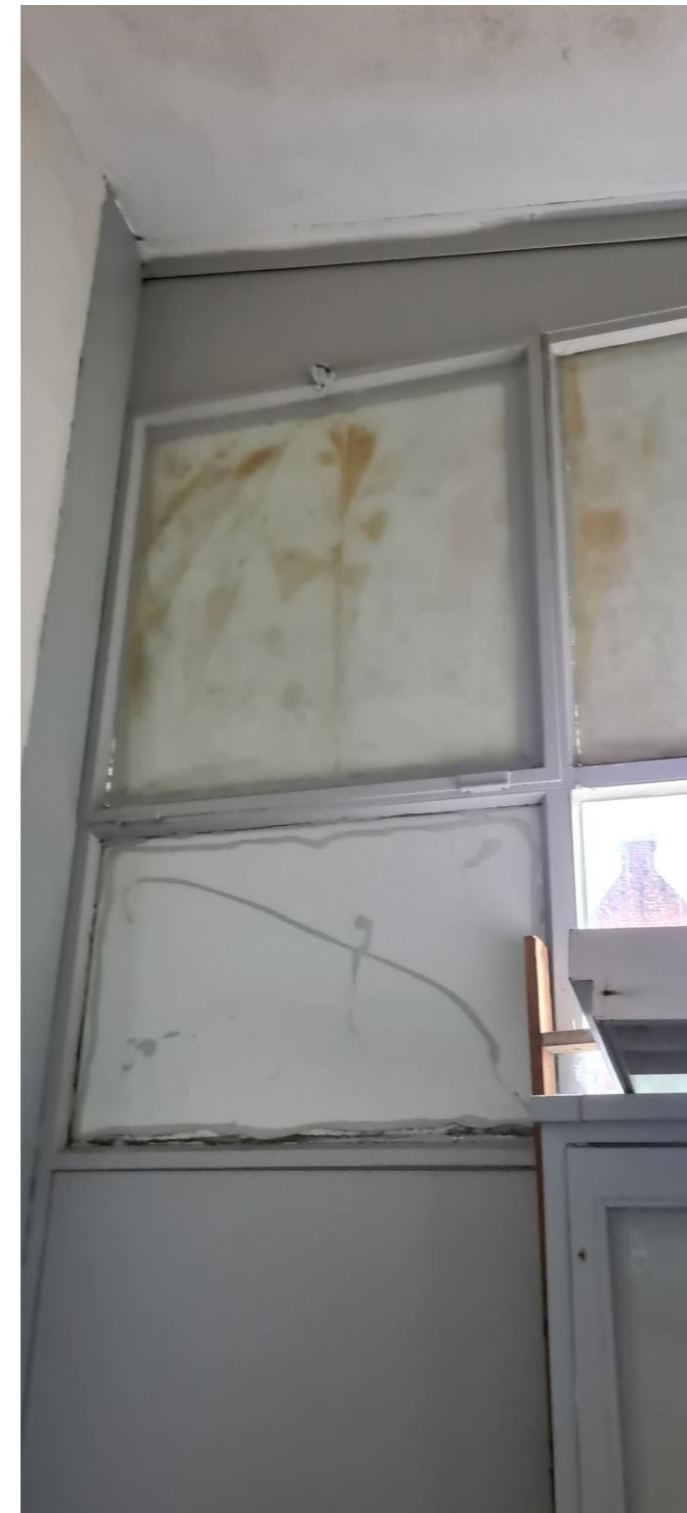
Vitrine voorzien van gewalst glas. Bovenlichten dichtgeplakt. De diepte van de oorspronkelijke kast is afleesbaar aan de positie van het tegelwerk.