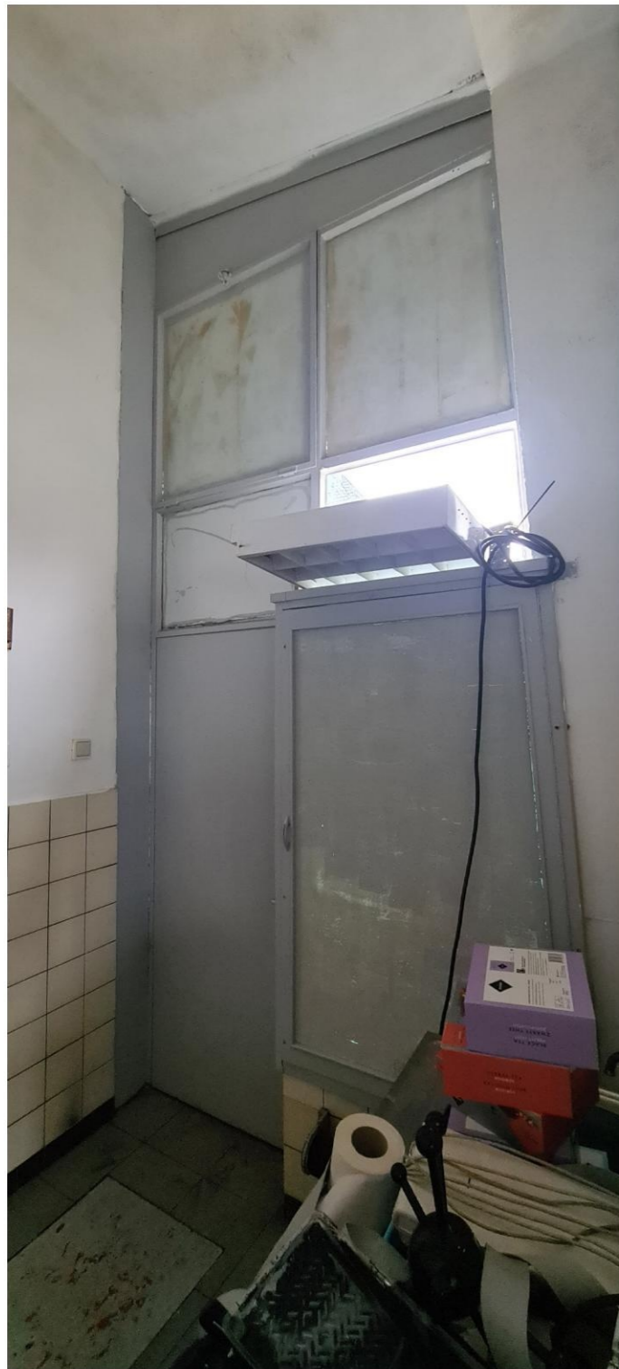
Ook in het toilet zijn nieuwe tegels over de bestaande tegels gelegd. Vitrine voorzien van gewalst glas. Bovenlichten dichtgeplakt. Inpandige HWA. Oorspronkelijke buisradiator.