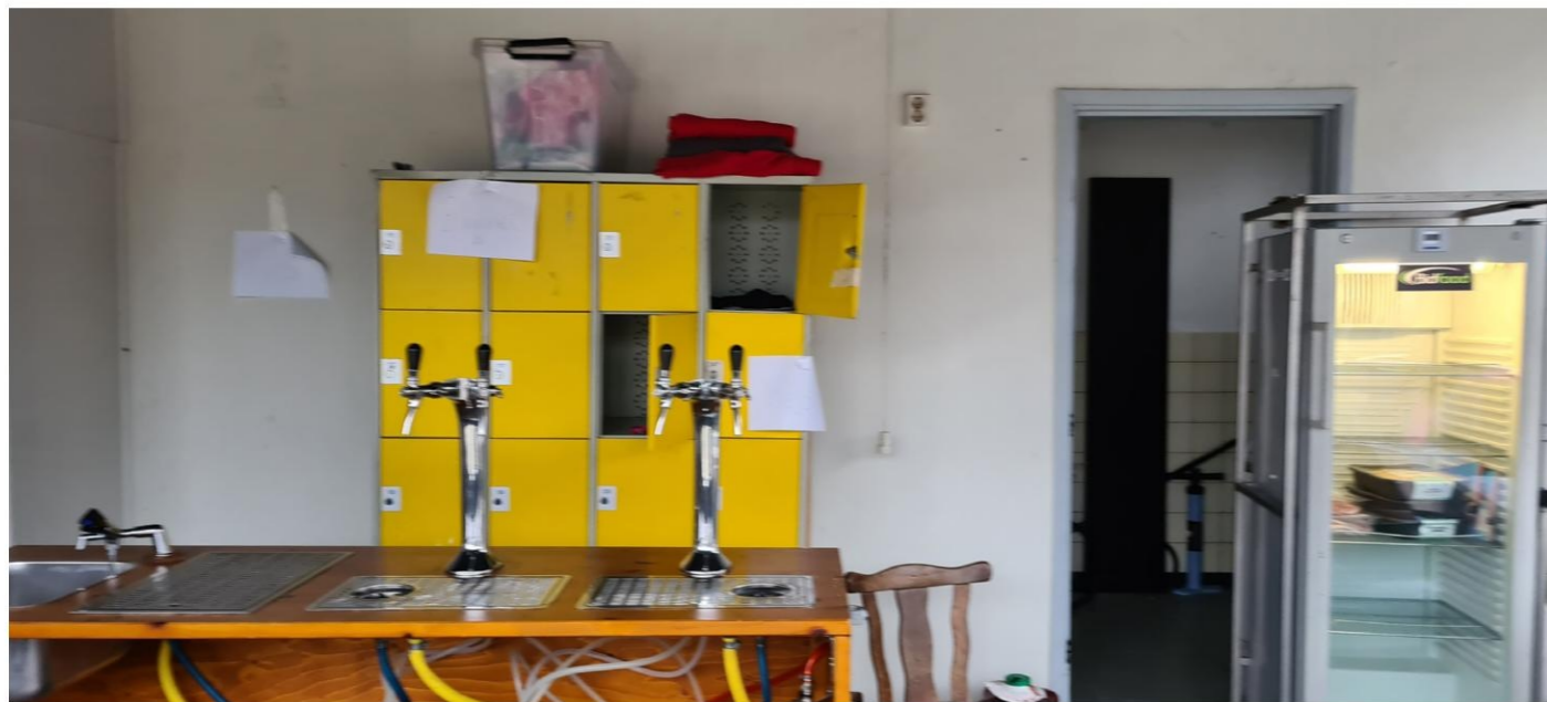
Deuropening naar voormalig toilet. Oorspronkelijk kastdeur.