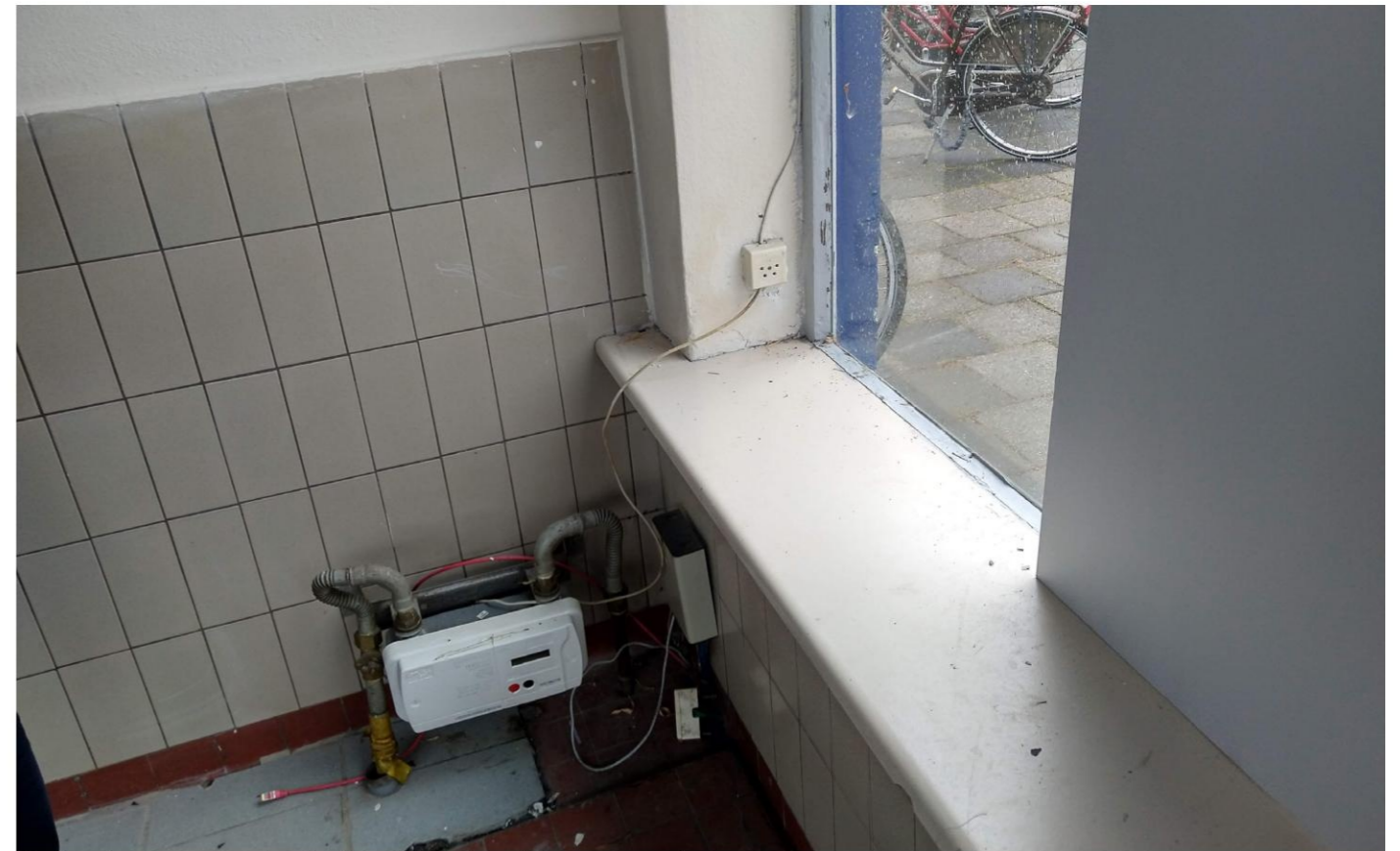
Onder de nieuwe tegels zijn de originele tegels nog aanwezig