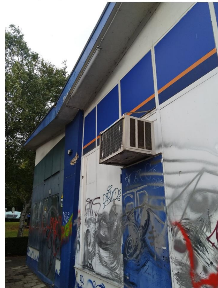
Airco zuidgevel (graffity inmiddels verwijderd)