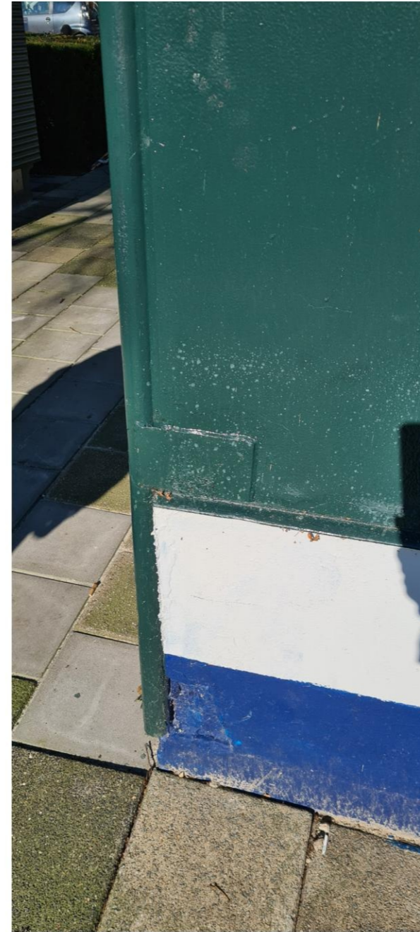
Stalen koker als hoekoplossing, schade aan metselwerk