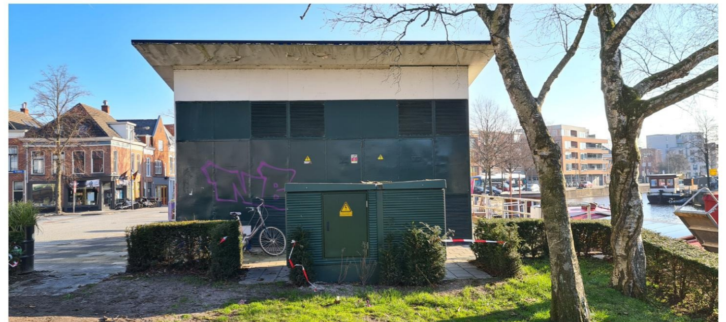
Westgevel met tijdelijk verplaatste transformator.