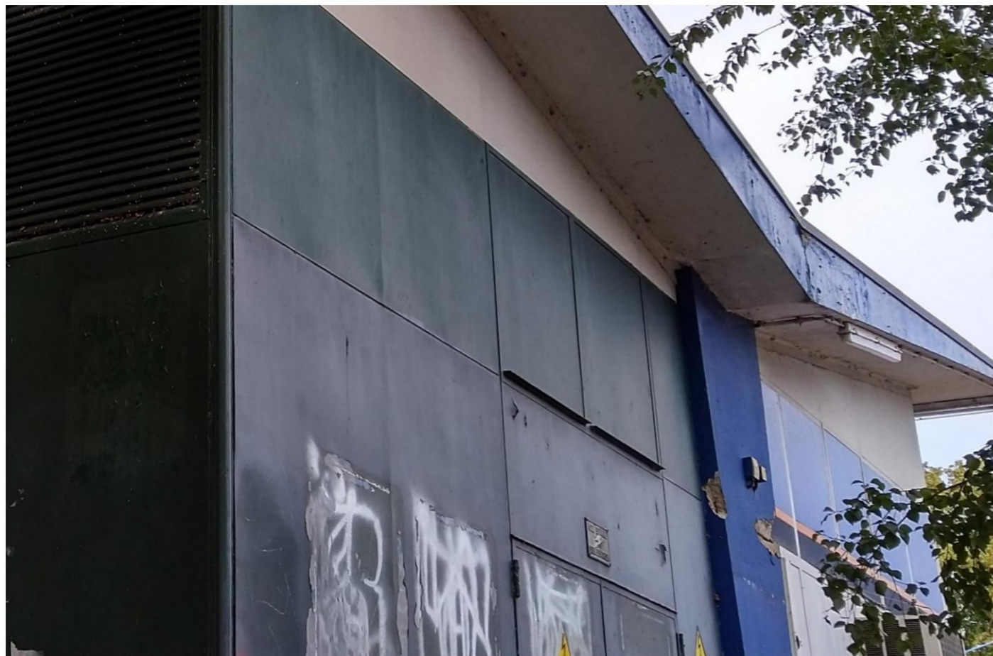
Betonrot betonkolom zuidgevel