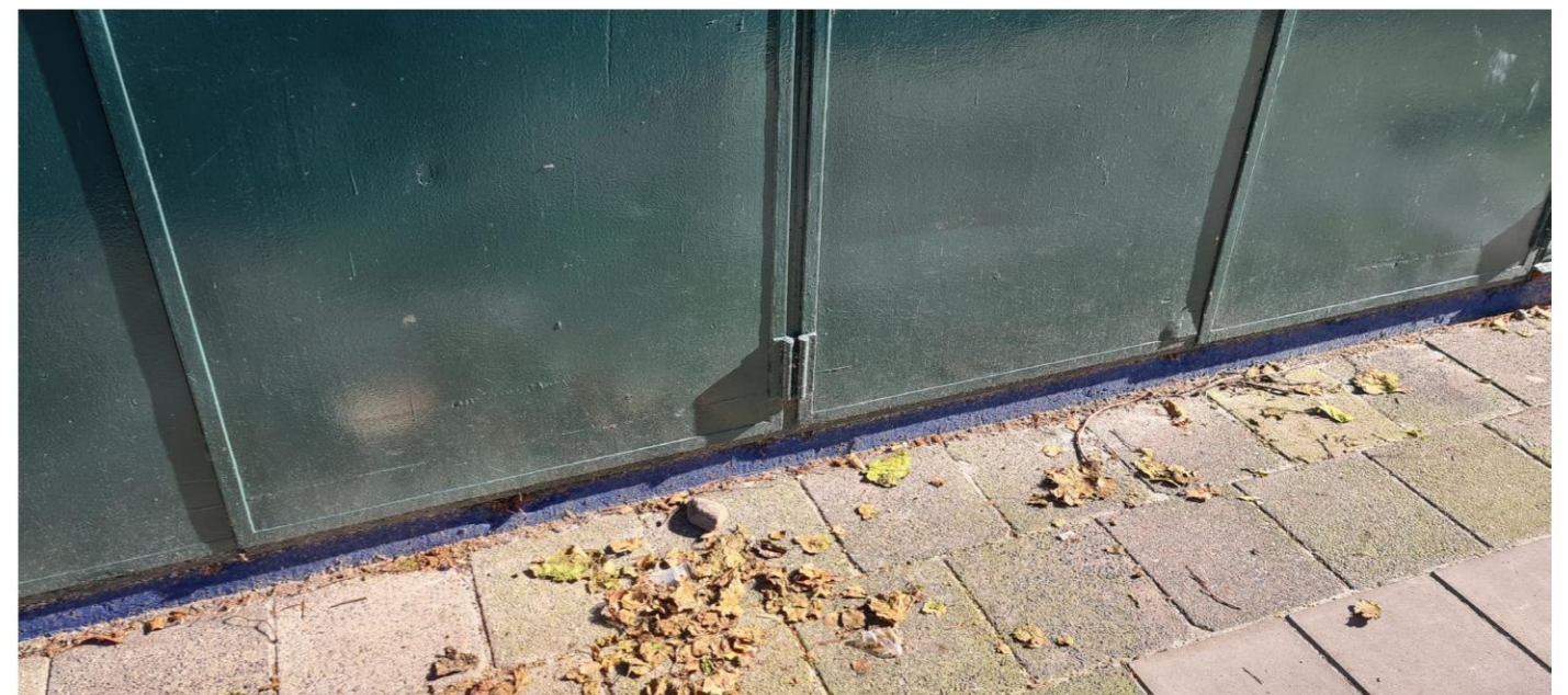
Bestaande deuren tpv netstation