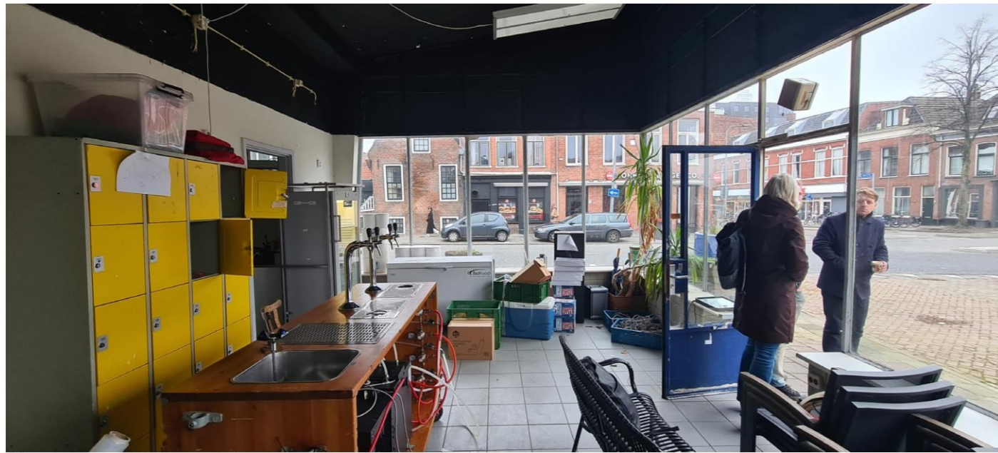
Afgeplakte en dichtgepurde kozijnen. Nieuwe vensterbanken.