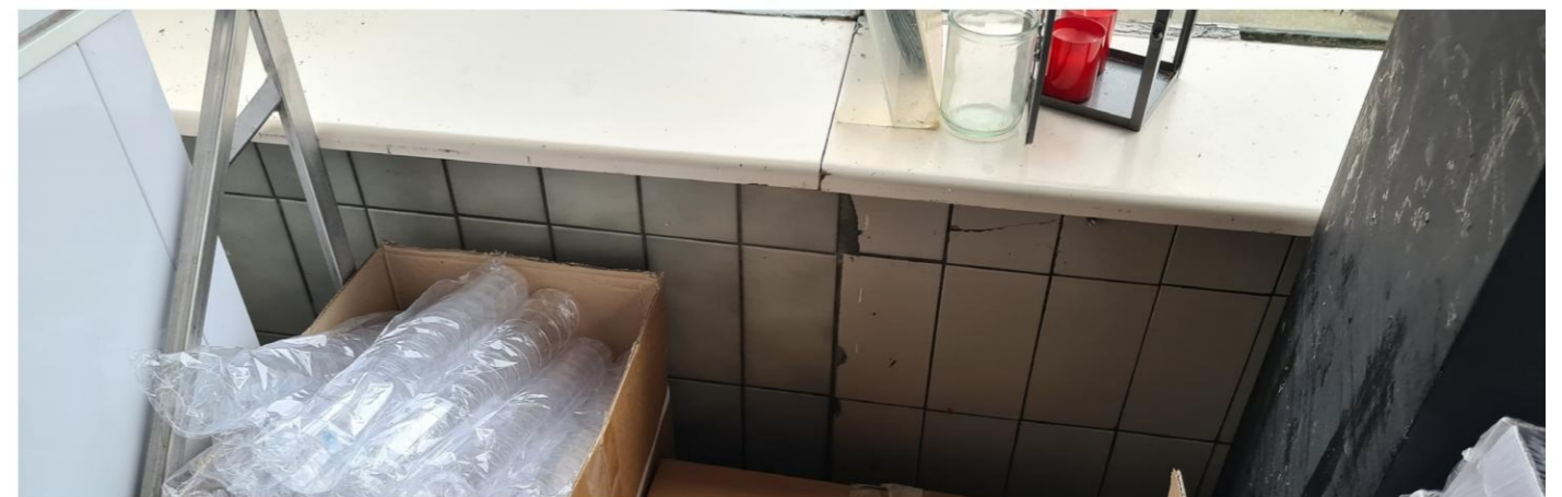
Bij de dichtgezette opening zijn nieuwe tegels gebruikt