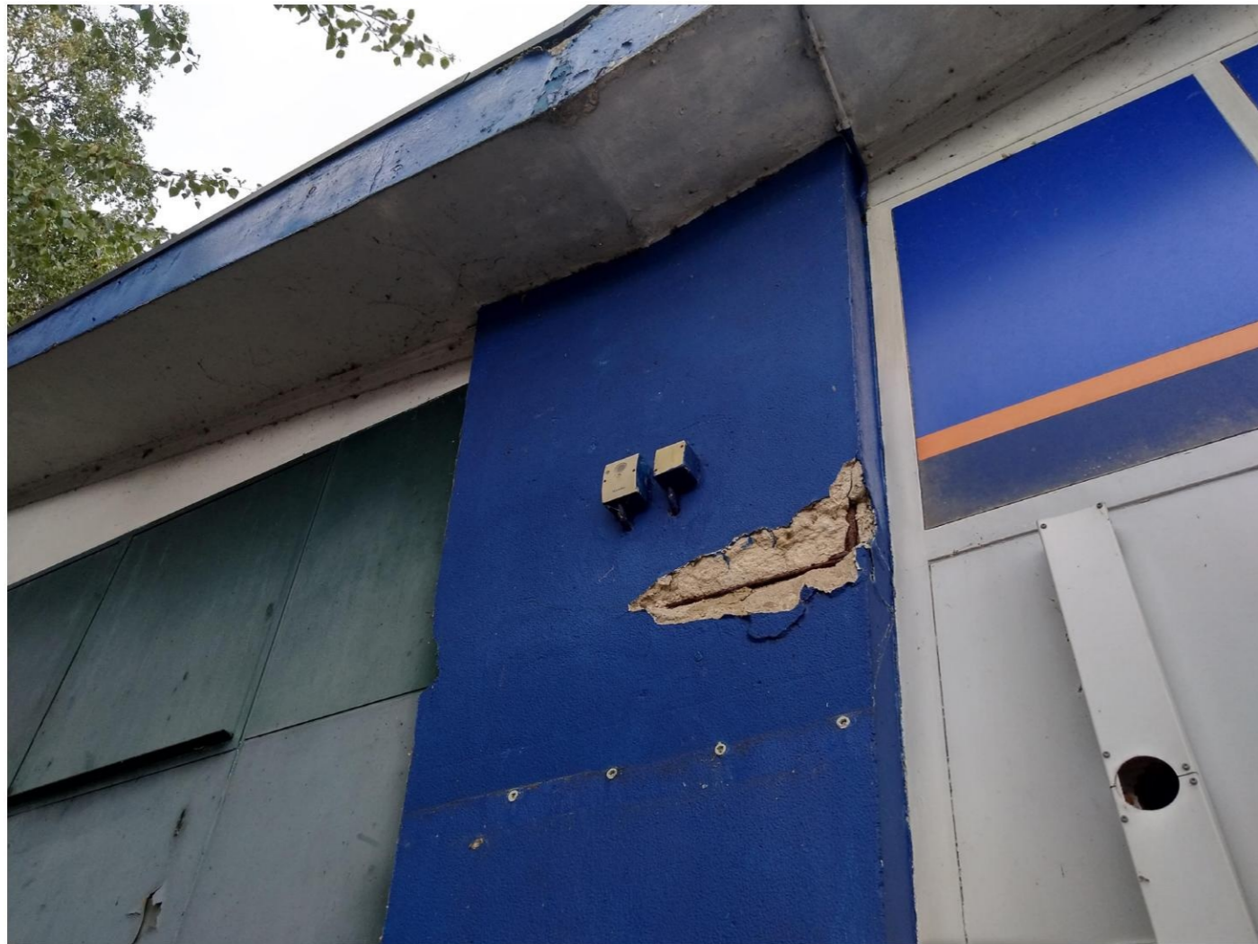
Betonrot betonkolom zuidgevel