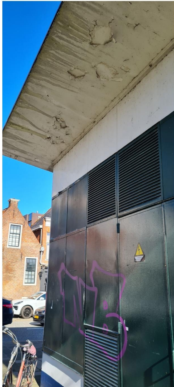
Afbladderend schilderwerk, doorgeroeste beplating