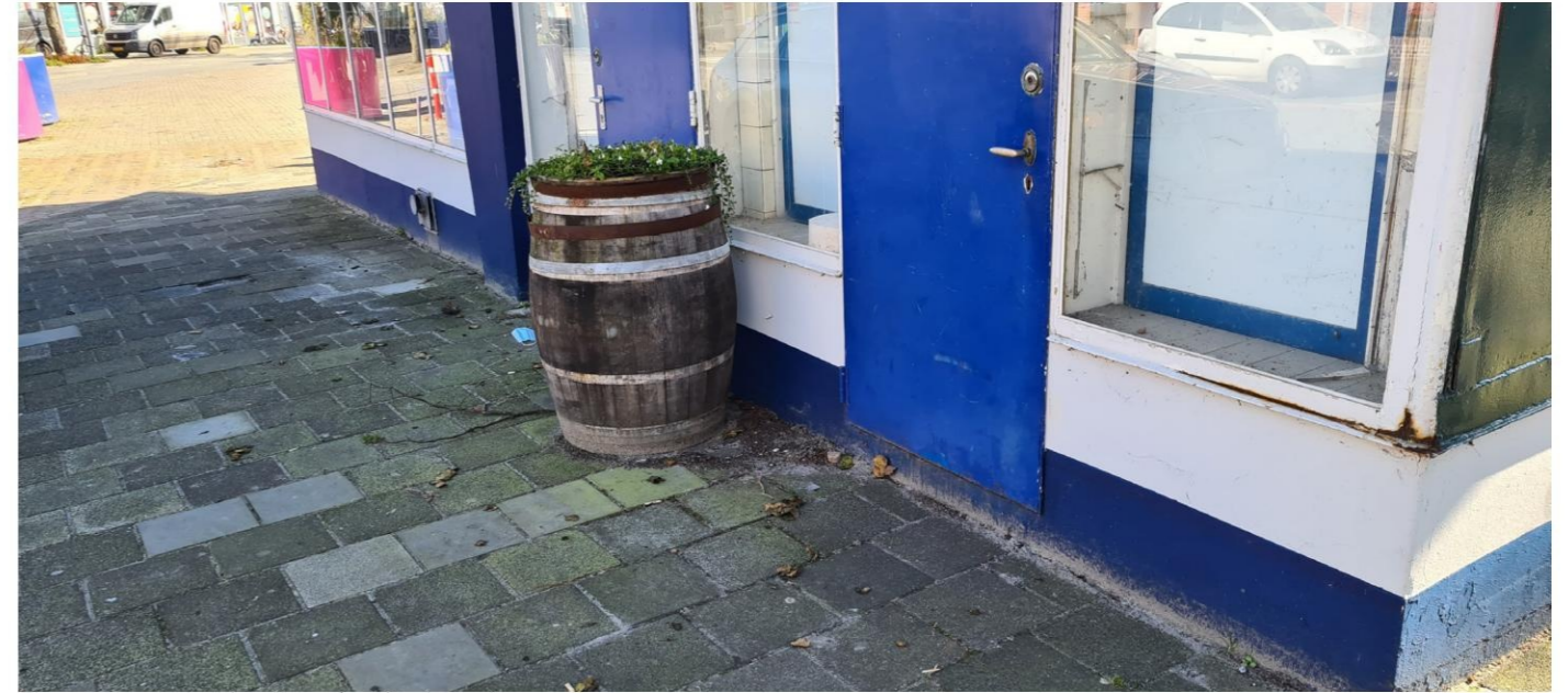
Roest tpv stalen kozijnen/onderdorpel