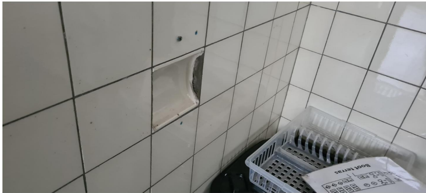
Positie closetroltegel in nieuwe situatie weer te gebruiken.