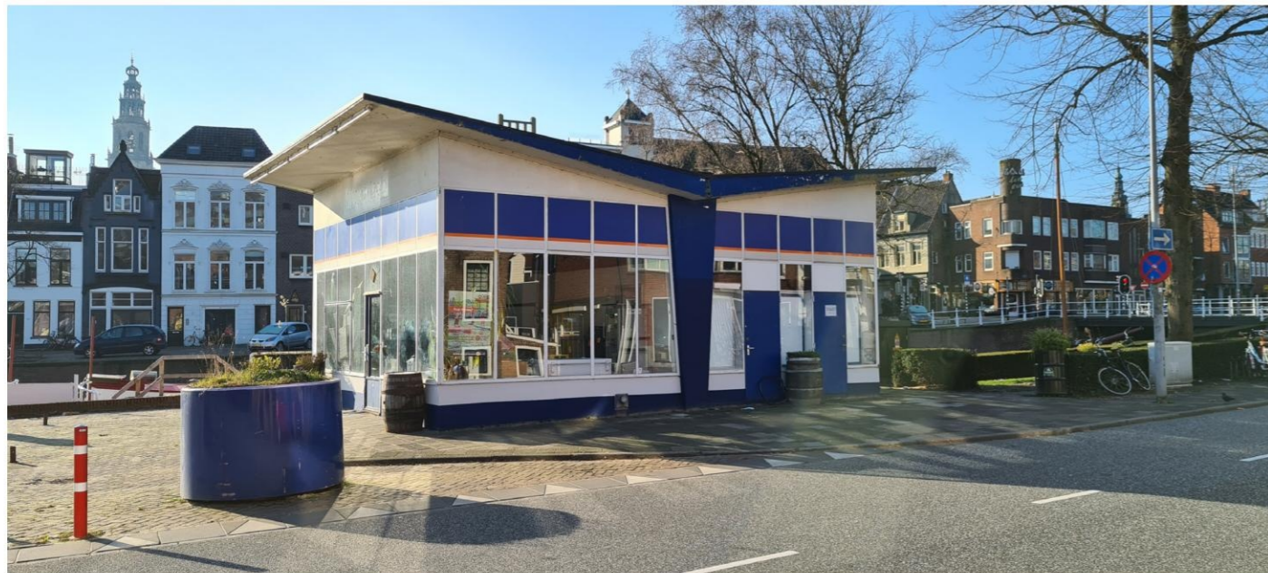
Noord/oostgevel met dichtgezette deuropening.