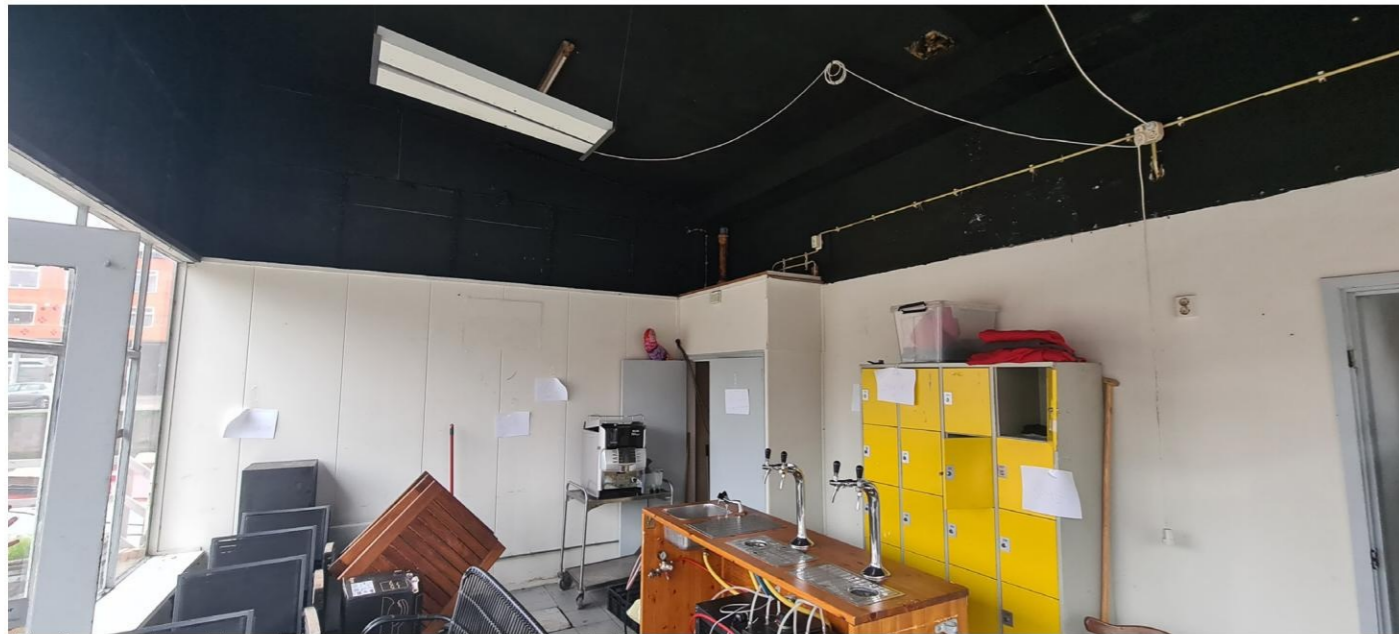
Afgetimmerde zuidgevel, (nieuwe) meterkast, afgeplakte en dichtgepurde kozijnen.