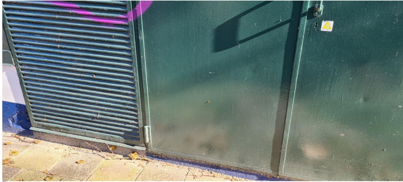
Roosters tpv netstation, schade aan metselwerk