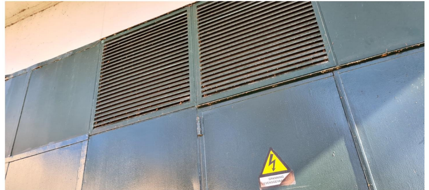
Roosters tpv netstation