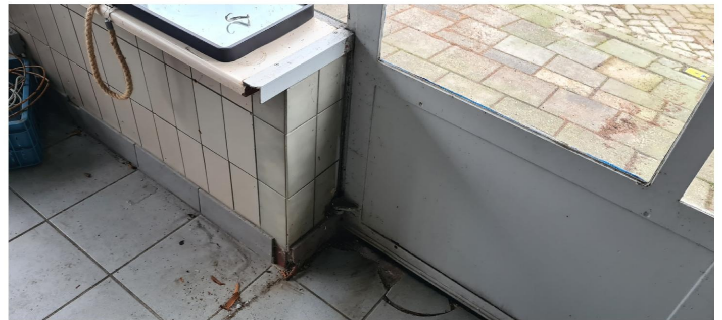
Bij de nieuwe opening zijn nieuwe tegels gebruikt