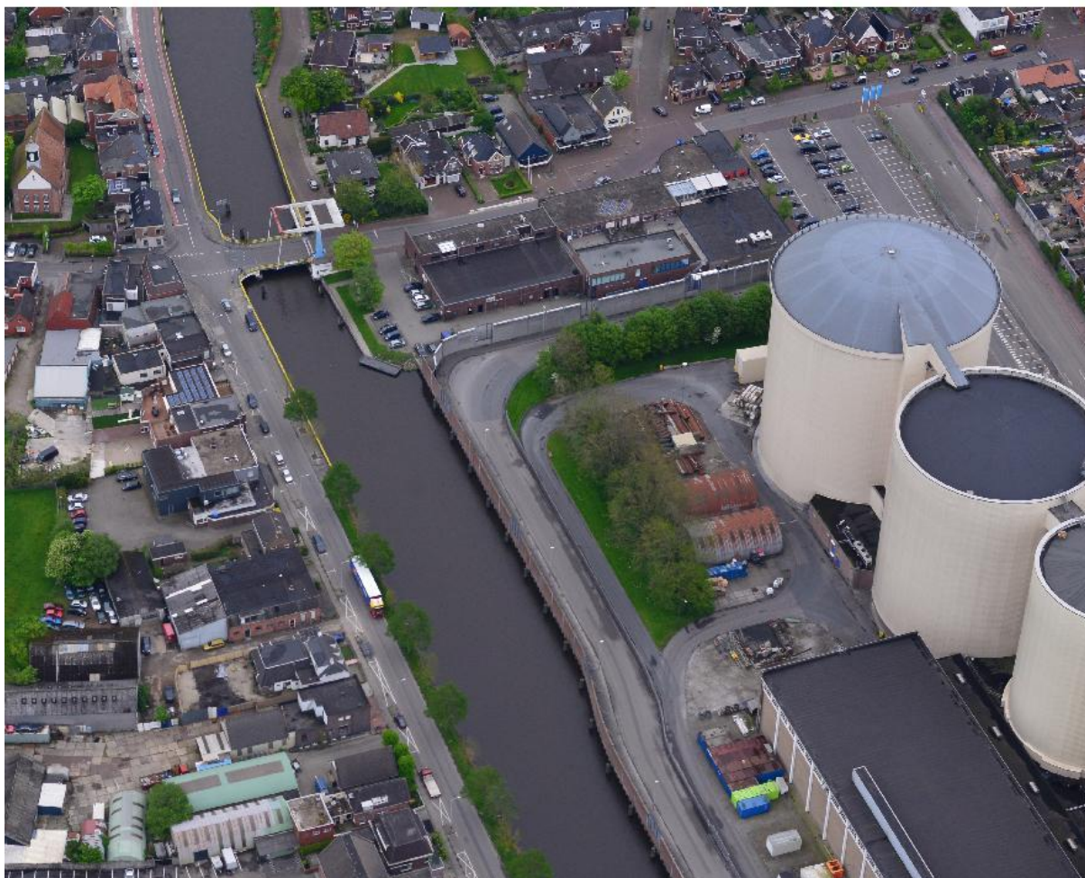
Terrein Suiker Unie vanuit de lucht met toekomstige locatie vijfde suikersilo

Voor deze silo is bij besluit van burgemeester en wethouders van 28 september 2011, onder nummer 200803743, een - inmiddels onherroepelijke - bouwvergunning verleend. De voorgenomen bouw van de zesde silo (in het vergunningdossier silo 5 genoemd) gaat niet meer door. Deze silo zou op de plaats komen van het entrepotgebouw, dat daarvoor zou worden gesloopt. Nu van de nieuwbouw wordt afgezien, wordt het entrepotgebouw gehandhaafd.