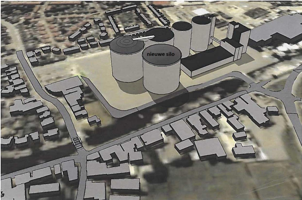
Impressie van het Suiker Unie-terrein met nieuwe silo