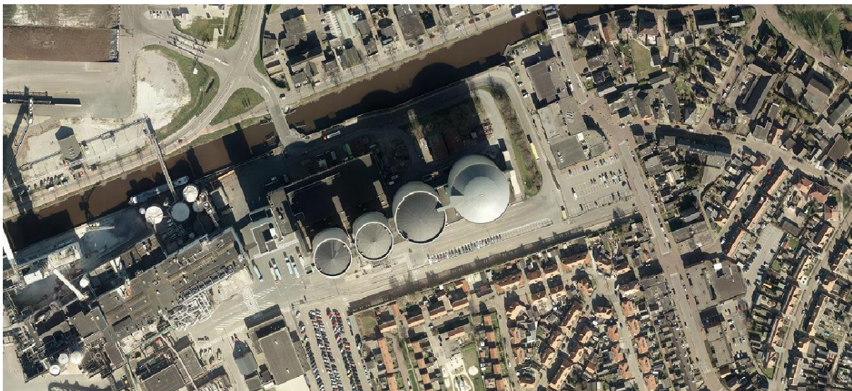
Luchtfoto van het plangebied, met daarop de bestaande suikersilo's

De bestaande suikersilo's hebben een hoogte van 49 meter variërend tot circa 55 meter + N.A.P.