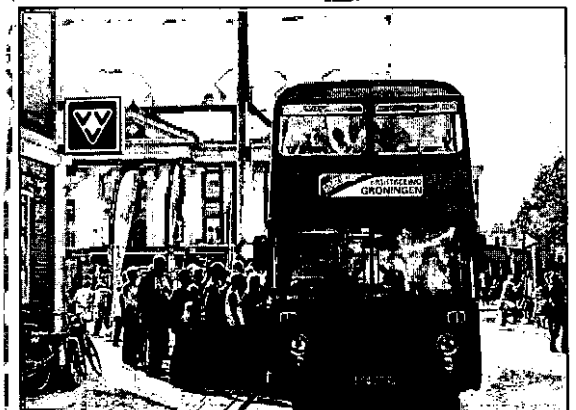
Figuur 1: grote belangstelling voor Engelse Dubbeldekker

Ook het gebruik van de Engelse Dubbeldekkers was een groot succes. Het gebruik van de bussen kon de vraag bijna niet beantwoorden. De grote verspreiding van huis-aan-huis folders hebben in onze ogen zeker aan de bekendheid bijgedragen.