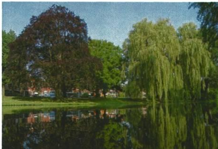
Monumentale bomen Noorderplantsoen, wandelroute

monumentale bomen voor de stad benadrukt en zijn de eigenaren geïnformeerd over subsidiemogelijkheden.