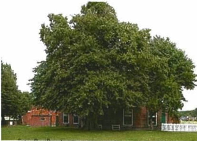
Oudste boom (linde) van Groningen, Noorddijkerweg

Monumentale bomen staan vooral in het centrum langs de singels, langs de oude hoofdradialen zoals de (Verlengde) Hereweg, in de Villabuurt en bij historische bebouwing (hofjes, kerken en bij oude boerderijen in de stedelijke randzone). De Oranjewijk, Universiteitscomplex, Paddepoel Zuid en het Stadspark springen eruit als wijken met de meeste gemeentelijke monumentale bomen. Voor de particuliere bomen zijn dat Binnenstad-Zuid, Villabuurt en Ruischerbrug.