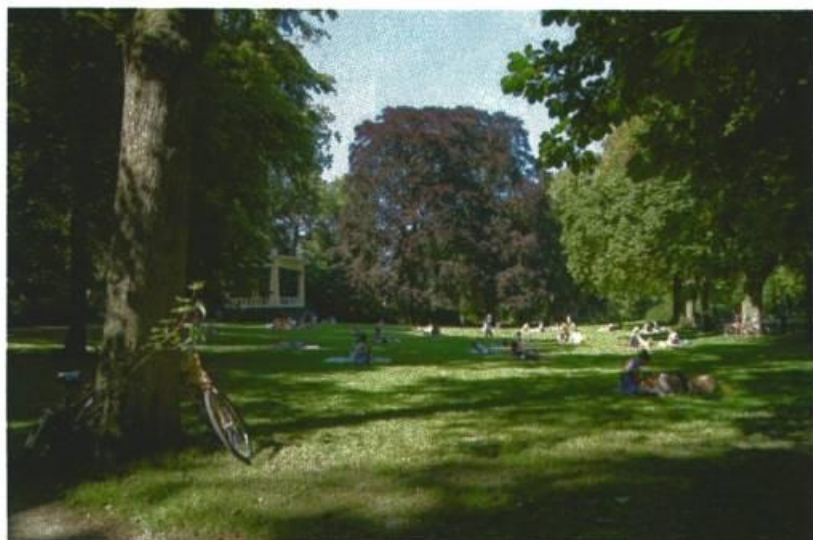
Monumentale bomen in het Noorderplantsoen

We hebben in de tweede helft van 2013 zowel de gemeentelijke als particuliere monumentale bomen geïnspecteerd. Doel van de inventarisatie is het in kaart brengen van het meest waardevolle deel van ons bomenbestand en het leggen van een extra basis voor zorg en bescherming van dit waardevolle groen. Bij de inventarisatie is een redelijke conditie en een levensverwachting van meer dan tien jaar een voorwaarde