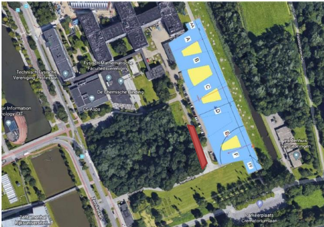
Afbeelding: nieuwbouw Feringa Building, met het Paddenbosje aan de westzijde. In rood indicatie van te kappen gedeelte.

Bij de bouw is naast de benodigde werkruimte eveneens een logistieke aan- en afvoerroute nodig om het huidige gebouw te kunnen blijven voorzien van de benodigde materialen. Hierbij is een deel van het Paddenbosje een knelpunt aangezien hier te weinig ruimte is voor de aanleg van een bevoorradingsroute, zonder een deel van het bos te kappen. De (bouw)veiligheid komt hiermee sterk in het geding en daarom is het noodzakelijk de bomen te kappen. Het betreft hierbij een tijdelijke logistieke weg die alleen tijdens de realisatie van de Feringa Building in gebruik zal zijn (voor de duur van circa 5 jaar). Alternatieve routes zijn onderzocht en beoordeeld maar niet geschikt gebleken vanwege de huidige los- en laadplaats. Na de bouw zal deze tijdelijke weg verwijderd worden en plaats maken voor een nog nader uit te werken ontwerp voor de openbare ruimte rondom de Feringa Building.