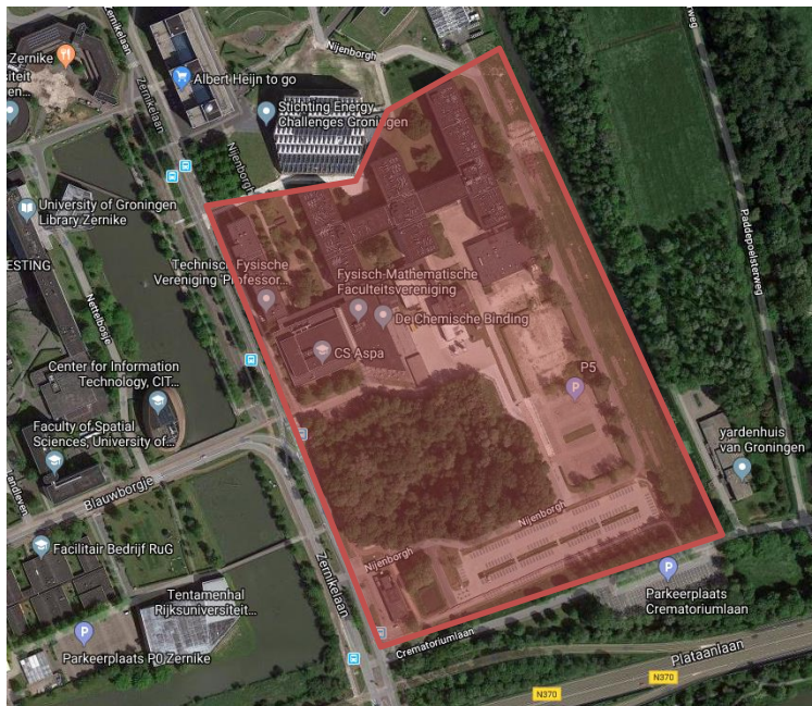
Afbeelding: begrenzing landschapvisie zuidoost Zernike Campus.

Daarom hebben we de afspraak gemaakt dat de compensatie gebaseerd zal worden op deze visie. De compensatie van bomen en houtopstand moet zodanig plaatsvinden dat er een robuuste ecologische structuur ontstaat. Dat betekent dat het niet per se aan moet sluiten op het paddenbosje, maar de compensatie mag ook nabij plaatsvinden zolang er maar sprake is van ecologische gebied. We willen dat er ecologische waarde wordt gecreëerd en niet alleen groencompensatie. Dit kan goed geborgd worden in de nieuwe landschapvisie; bij de totstandkoming zal zowel de gemeentelijk ecoloog als de ecoloog van de RUG actief betrokken worden.