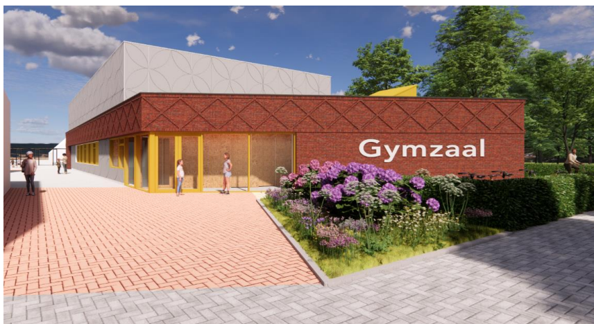
Impressiebeeld gymzaal vanaf entree Korreweg

De afgebrande gymzaal Molukkenstraat wordt herbouwd op de locatie bij OBS Karrepad. Uw raad heeft hiertoe op 24 juni 2021 aanvullend krediet ter beschikking gesteld. De gymzaal kon niet worden herbouwd op de oude plek, omdat de afmeting van een gymzaalvloer tegenwoordig groter is geworden. De afgebrande gymzaal (uit 1950) had een vloeroppervlak van 12m x 21m. De nieuwe gymzaal heeft een vloeroppervlak van 14m x 22m (normen vanuit Koninklijke Vereniging van Lichamelijke Opvoeding). De afgebrande gymzaal stond strak tussen twee schoolgebouwen. Herbouwen op de oude plek zou betekenen dat aan de schoolgebouwen grote bouwkundige verbouwingen zouden moeten plaatsvinden, wat niet wenselijk is. De nieuwe gymzaal wordt nu gerealiseerd naast de bovenbouwschool van OBS Karrepad grenzend aan het Molukkenplantsoen.