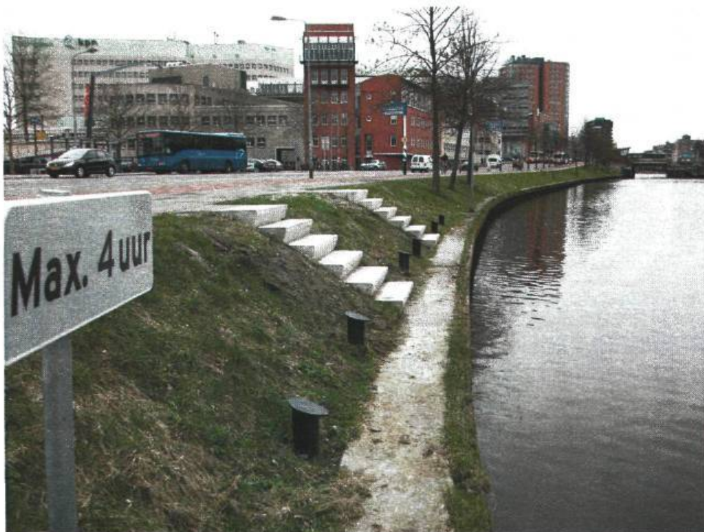
Aanmeerplek bij Station.

In het Verbindingskanaal is ter hoogte van het station een aanmeerplek gerealiseerd waar kleine bootjes gedurende maximaal 4 uur mogen aanleggen.