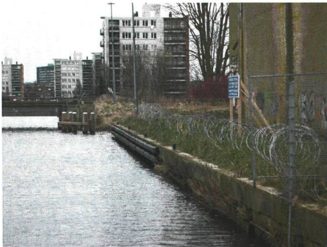
Wachtplek tussen spoorbrug en ACM-fietsbrug.

Tijdens de rondvaart met de waterpartners in september 2009 kwam de uitdrukkelijke de wens naar voren om tussen de spoorbrug en de ACM-fietsbrug een wachtplek aan te leggen. Want schepen die richting binnenstad varen passeren de fietsbrug, die zonder beperkingen kan draaien, maar moeten meestal een poosje wachten totdat de spoorbrug geopend kan worden. De spoorbrug kan immers alleen geopend worden als de dienstregeling van de treinen dit toelaat. Aanvankelijk was het de bedoeling om de wachtplek vanuit het project 'Welkom watertoerisme!' aan te leggen, maar later werd duidelijk dat de wachtplek in het bestek van het fietsbrugproject opgenomen was. De voorziening is in 2011 aangelegd.