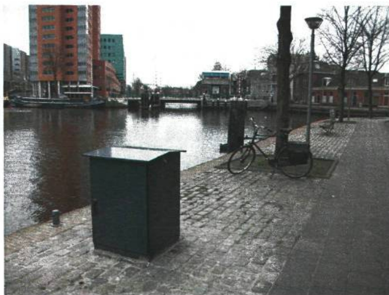
Extra nutskast Zuiderhaven.

De werkelijke uitvoeringskosten waren € 7.800.