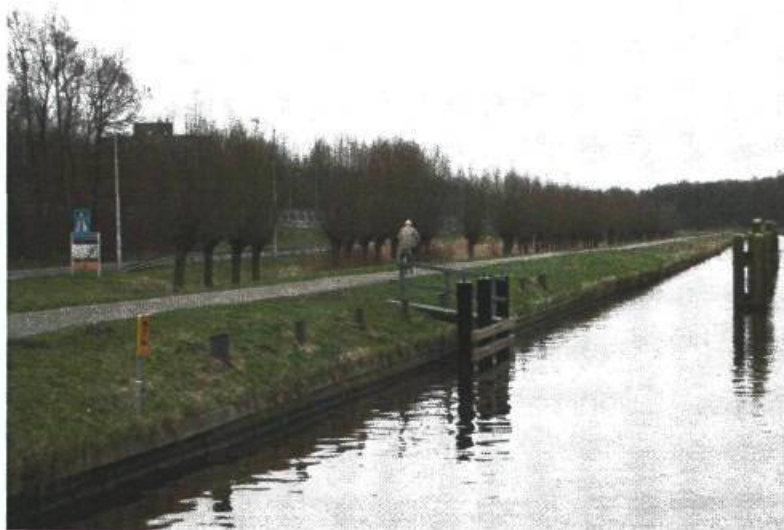
Wachtplek bij de van Ketwich Vershuurbrug.

De werkelijke uitvoeringskosten waren € 21.000.