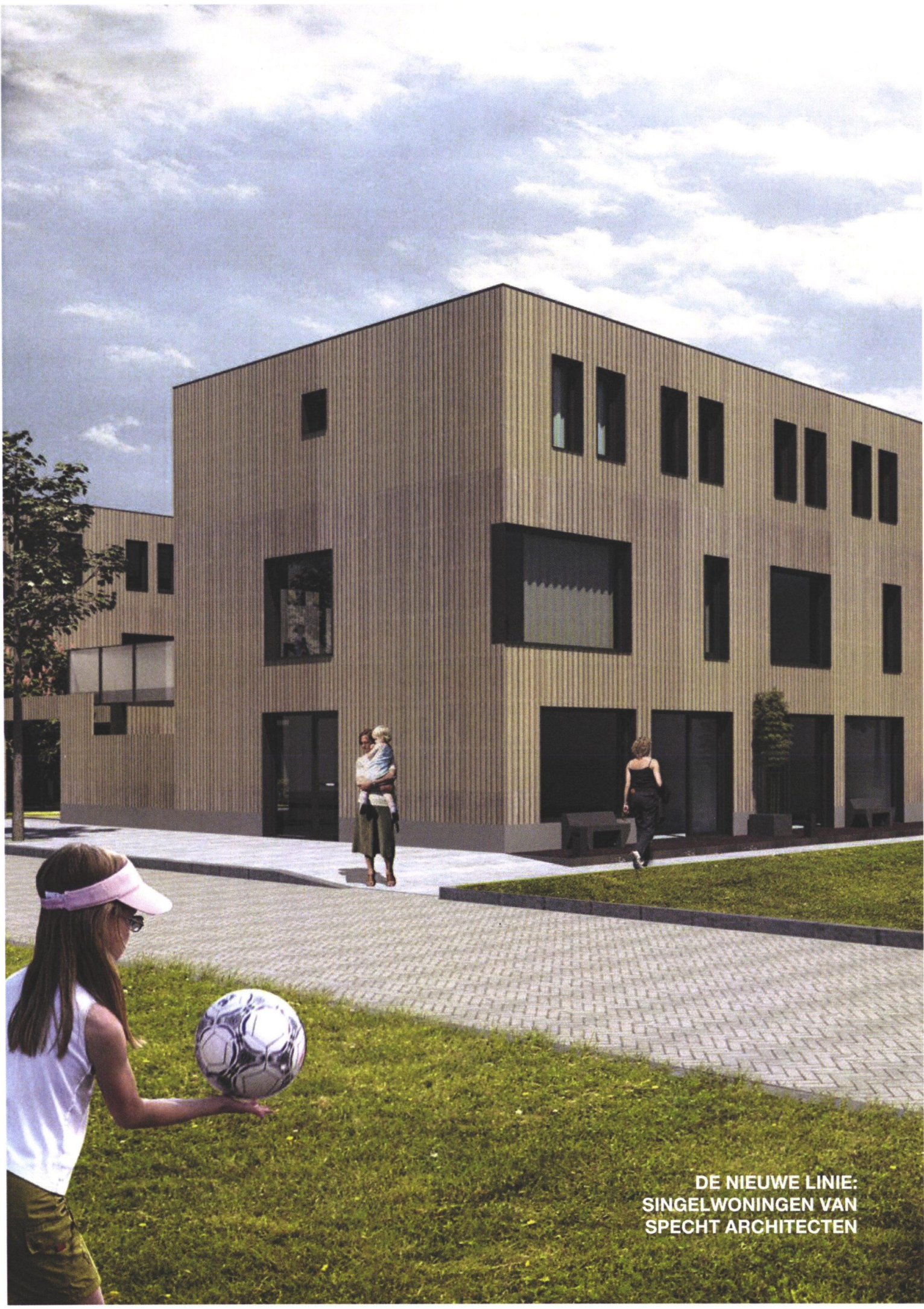
DE NIEUWE LINIE: SINGELWONINGEN VAN SPECHT ARCHITECTEN