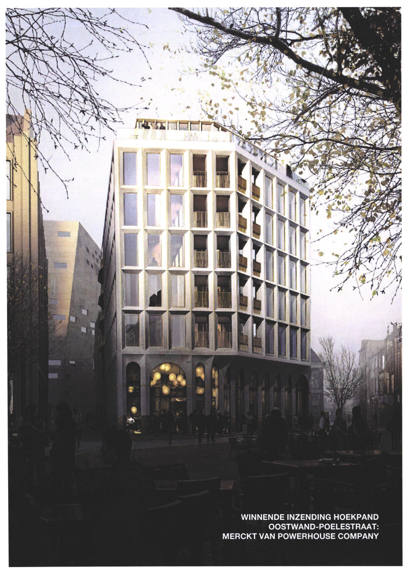
WINNENDE INZENDING HOEKPAND OOSTWAND-POELESTRAAT: MERCKT VAN POWERHOUSE COMPANY