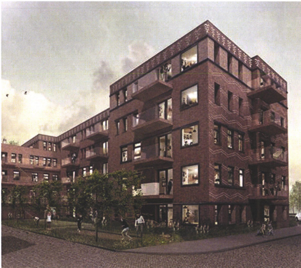
WONINGBOUW MOLUKKENSTRAAT: DE UNIE ARCHITECTEN