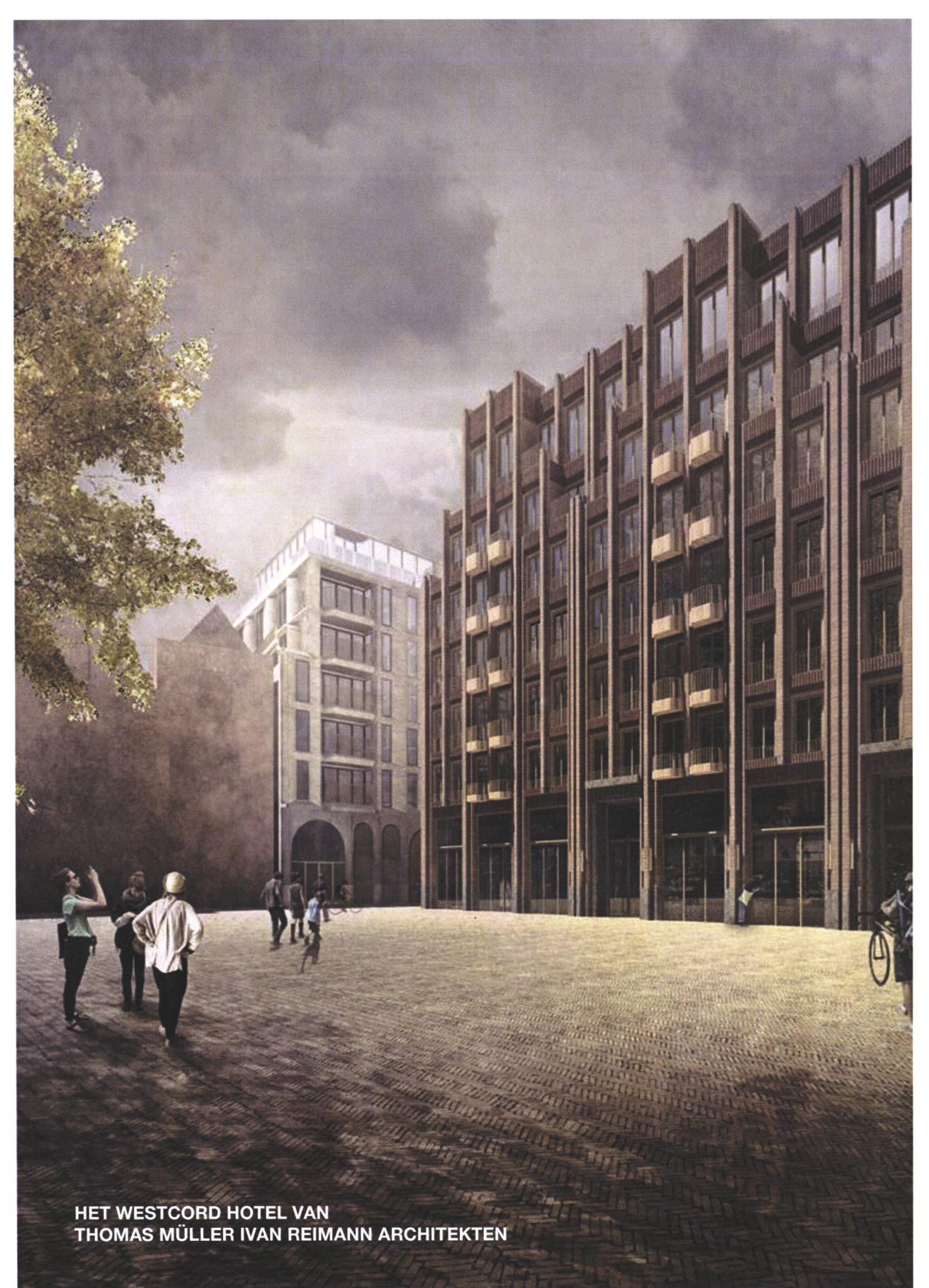
HET WESTCORD HOTEL VAN THOMAS MÜLLER IVAN REIMANN ARCHITEKTEN