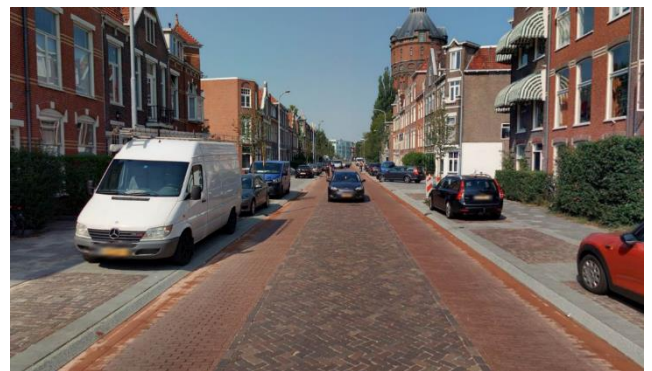
Afbeelding 3: Fietsstraat Herman Colleniusstraat