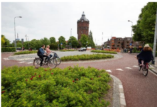
Afbeelding 2: Fietsrotonde Wilhelminakade

Onderstaande afbeeldingen 2 en 3 geven een indruk van de verbeteringen.