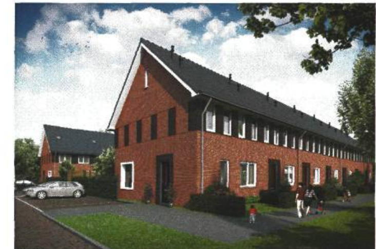
rij-woningen met zadelkap. woonblok D