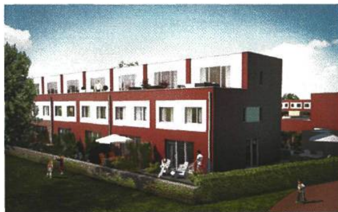
rij-woningen, twee woonlagen en optopping. woonblok E en F

project 'Tuinland' te Groningen verkaveling met impressie diverse woningtypen d.d. 06-10-2011