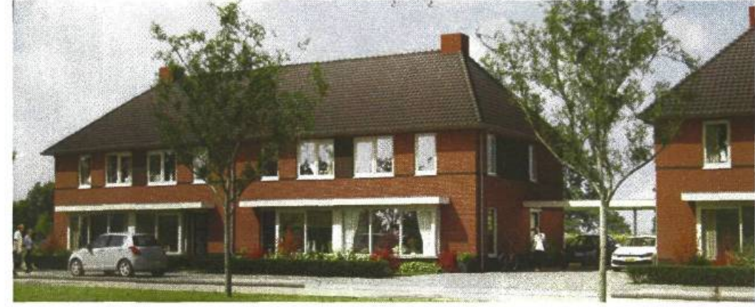
rij-woningen met stolpkap. woonblok A, B en C