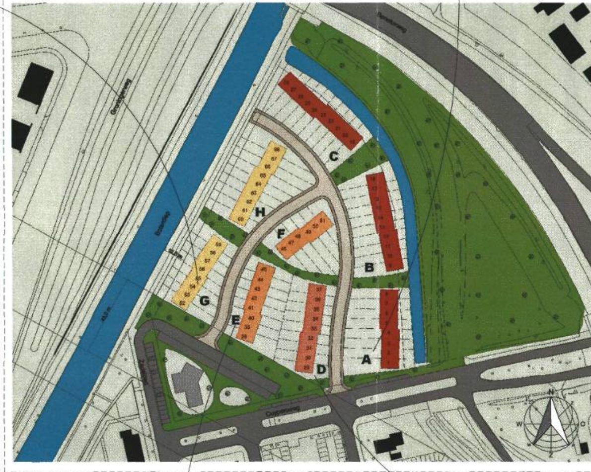
situatie, schaal 1:1000