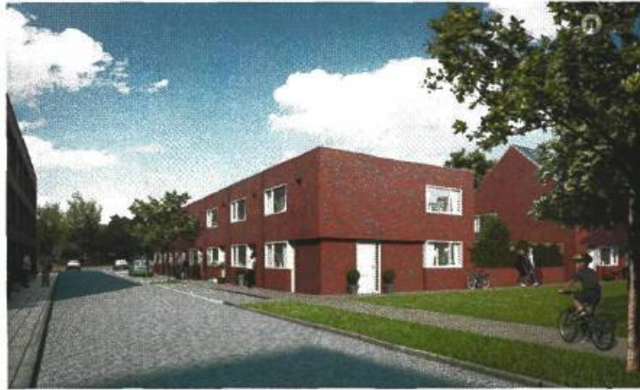
rij-woningen, twee woonlagen met platdak. woonblok G en H