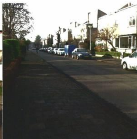
Kometenstraat in richting van Zonnelaan