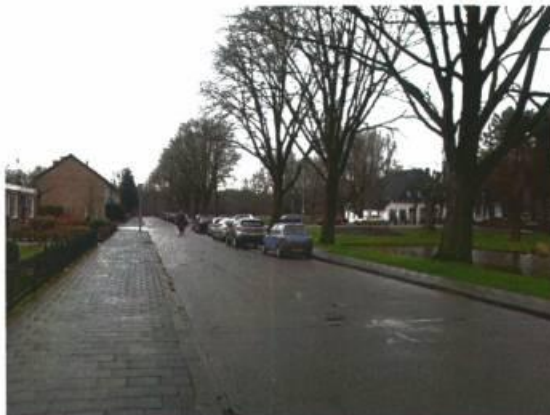
Morgensterlaan in noordelijke richting ten zuiden van entree park