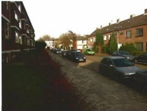
Spirealaan in noordelijke richting