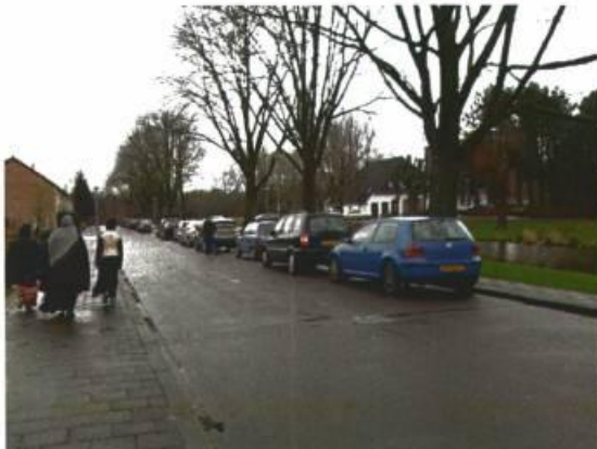
Morgensterlaan in noordelijke richting ten zuiden van entree park