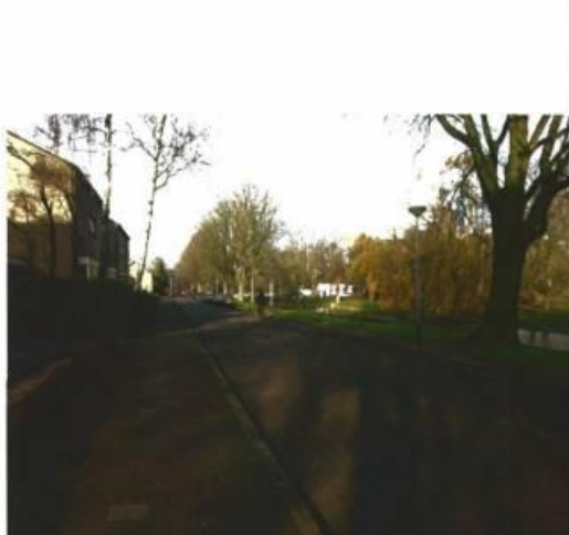
Morgensterlaan in noordelijke richting vanuit Saturnuslaan