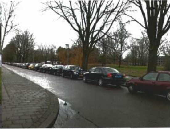
Morgensterlaan in de richting van de moskee