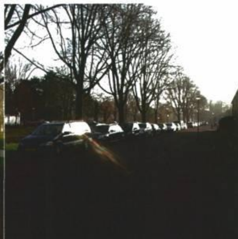
Morgensterlaan in zuidelijke richting ten noorden van het park