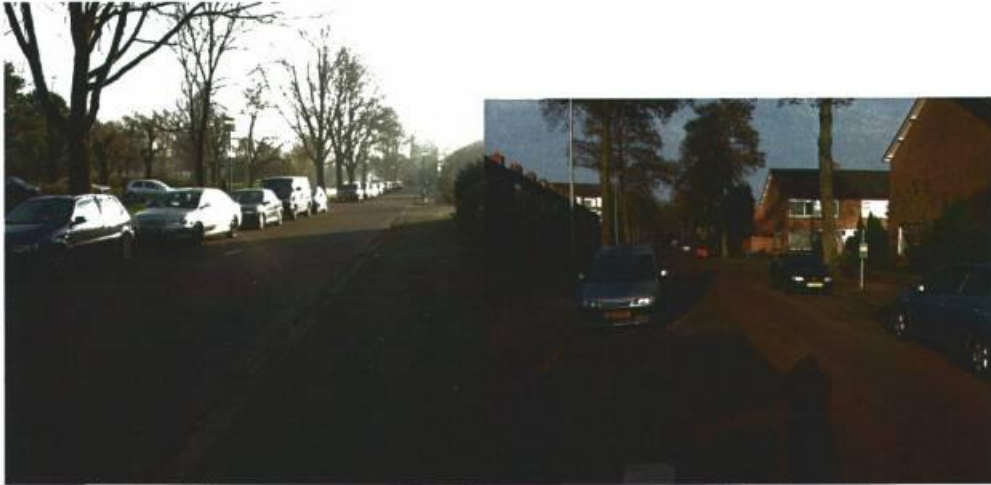
Morgensterlaan in zuidelijke richting ten noorden van entree park Elzenlaan in noordelijke richting