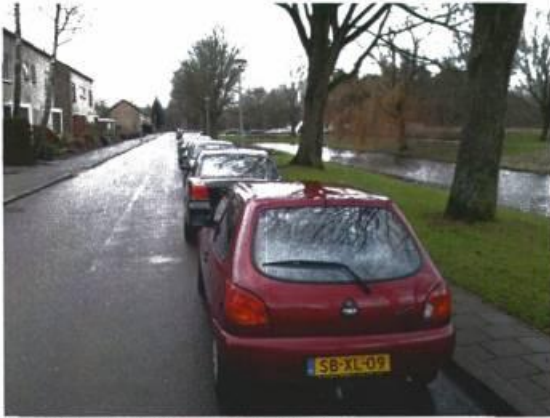
Morgensterlaan in de richting van de moskee