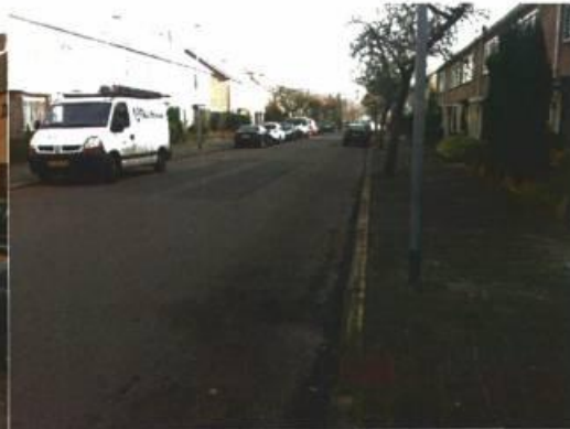
Eizenlaan in zuidelijke richting