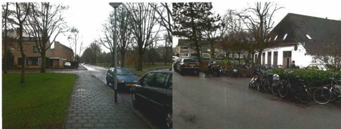
Morgensterlaan in noordelijke richting vanuit Saturnusstraat Fietsparkeren bij moskee