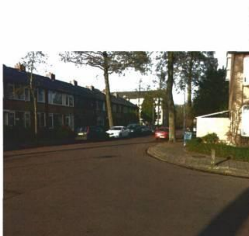
Eizenlaan vanuit Maluslaan in noordelijke richting