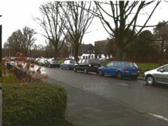
Morgensterlaan in noordelijke richting ten zuiden van entree park