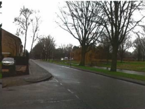
Morgensterlaan in noordelijke richting vanuit Saturnusstraat