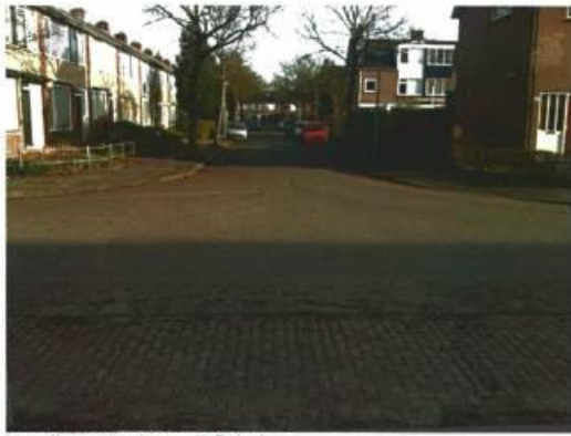
Vogelkersstraat vanuit Spirelaan