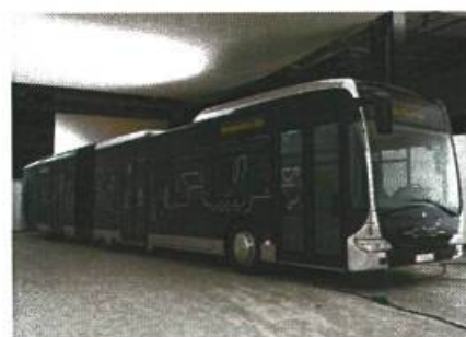
18 meter gelede bussen op de regio HOV-buslijnen (foto is indicatief)

De capaciteit neemt door de inzet van grotere bussen en uitbreiding van de frequentie met 22% toe.