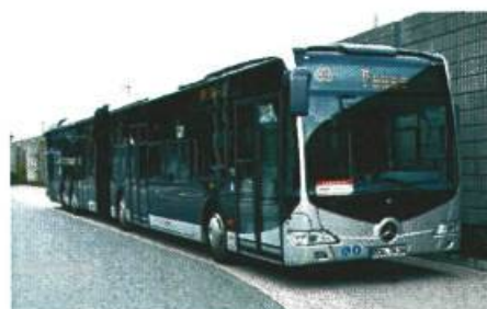
20 meter Mercedes Capacity voor inzet naar Zernike (foto is indicatief)

Capacity van 20 meter lang met een capaciteit van 193 personen per voertuig. Met de inzet van deze bussen wordt een capaciteit gerealiseerd die 37% hoger ligt dan in de huidige situatie. De vervoervraag kan hiermee op een meer verantwoorde, aantrekkelijke en meer efficiënte manier worden vormgegeven. De 9 hoogcapaciteits HOV-bussen kunnen in een volgende concessie na 2017 doorrijden.