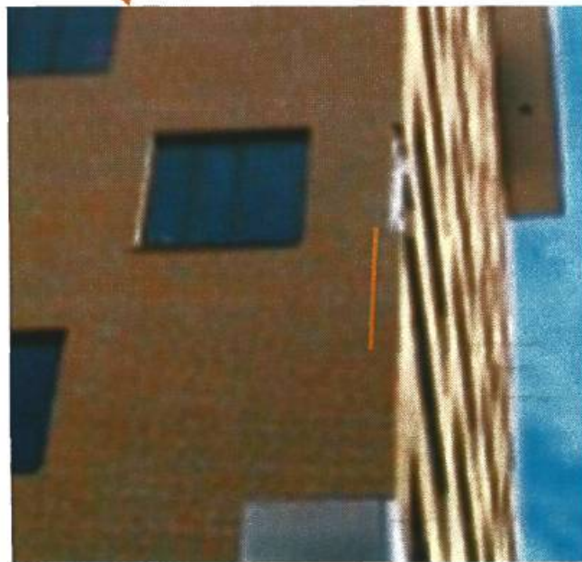
Foto 6, Het gearceerde gedeelte staat los. Ook hier is de dilatatie achteraf ingezaagd. Op de foto is de zijkant te zien. Aan de voorkant gaat het om hetzelfde gedeelte als bij foto 17 (gespiegeld).

Het bovenste van het metselwerk is op de straat terecht gekomen. Er staat op dit moment ca 1 m2 nog los (gearceerde gedeelte).